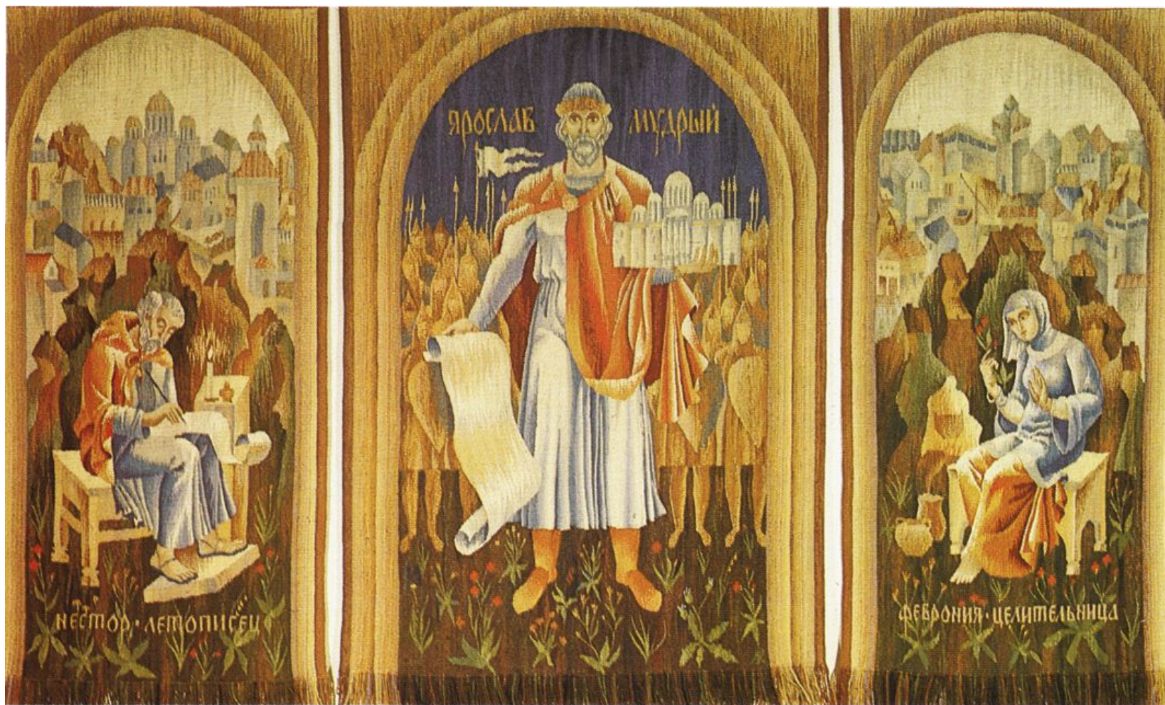
Гобелен-триптих Київська Русь (худ. Л. Козаченко)