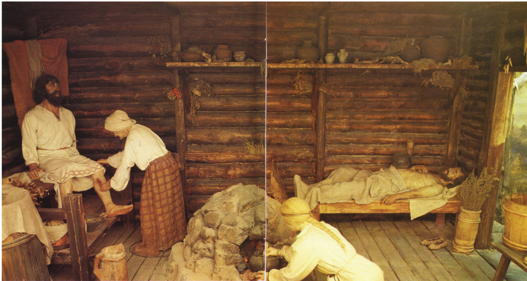
Інтер'єр Давньоруська лазня (худ. А. Крижопольський, Л. Козаченко, скульп. С. Британ)