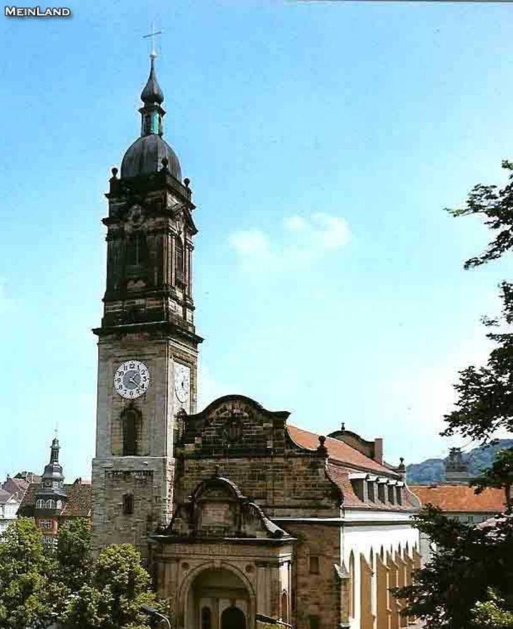
Die Georgenkirche in Eisenach ist Bischofskirche der Evangelischen Kirche in Thüringen