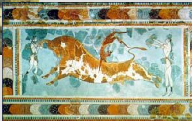
Крит сарайындағы жазбалар