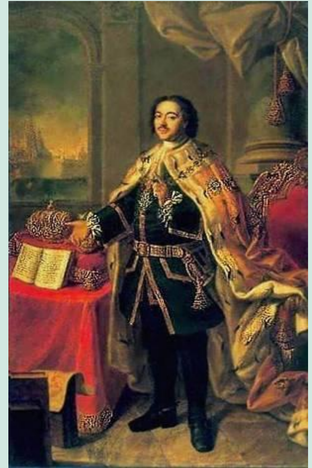
Портрет императора Петра I

Расцвет русского портрета падает на вторую половину XVIII в. А. П. Антропов- одна из самых примечательных фигур ломоносовской поры в русской художественной культуре