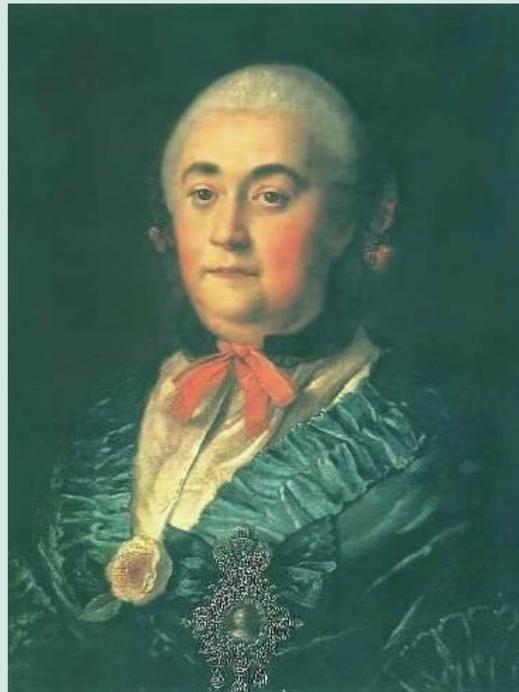
Портрет А.М.Измайловой. 1759