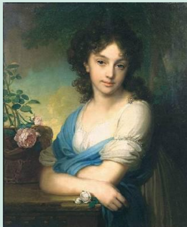
В. Боровиковский . Портрет Е.А.Нарышкиной

XVIII век в живописи- это век портрета. Портрет играл ведущую роль в русском изобразительном искусстве. В этой области русские художники не только достигли уровня европейской живописи, но и по праву заняли место среди крупнейших портретистов той эпохи.