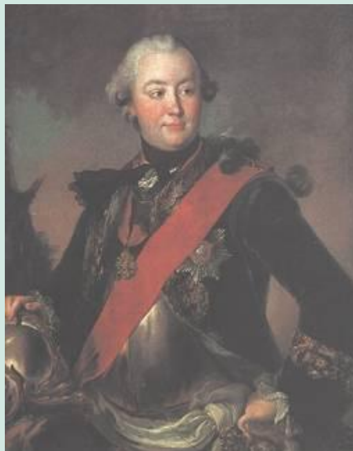
Портрет графа Орлова