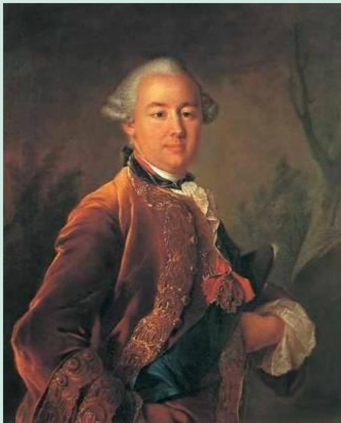
И.Аргунов . Портрет П.Шереметьева