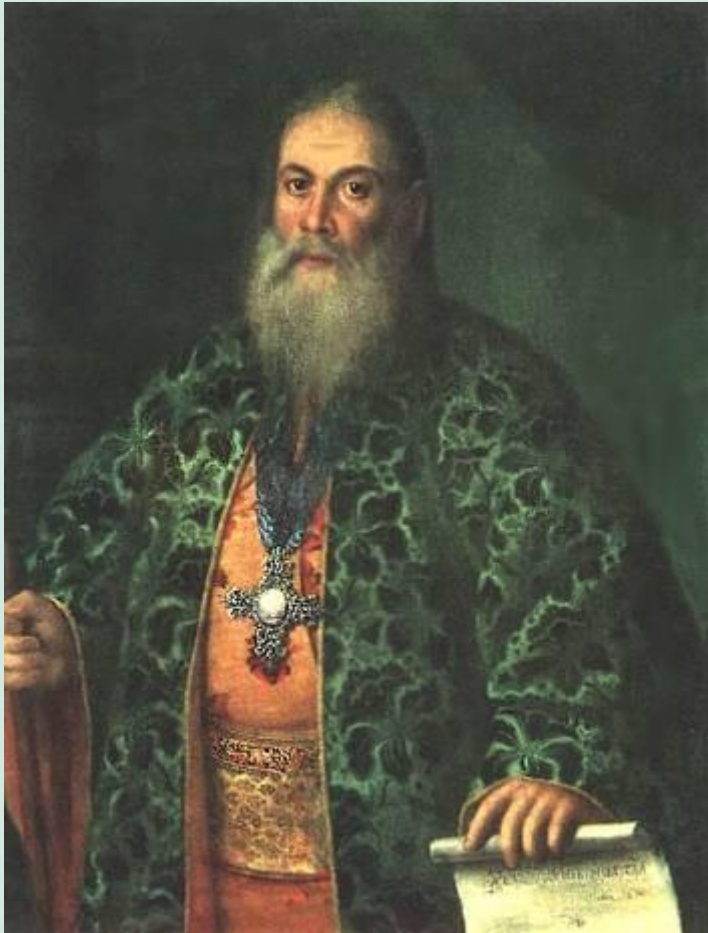
Портрет Ф.Я. Дубянского