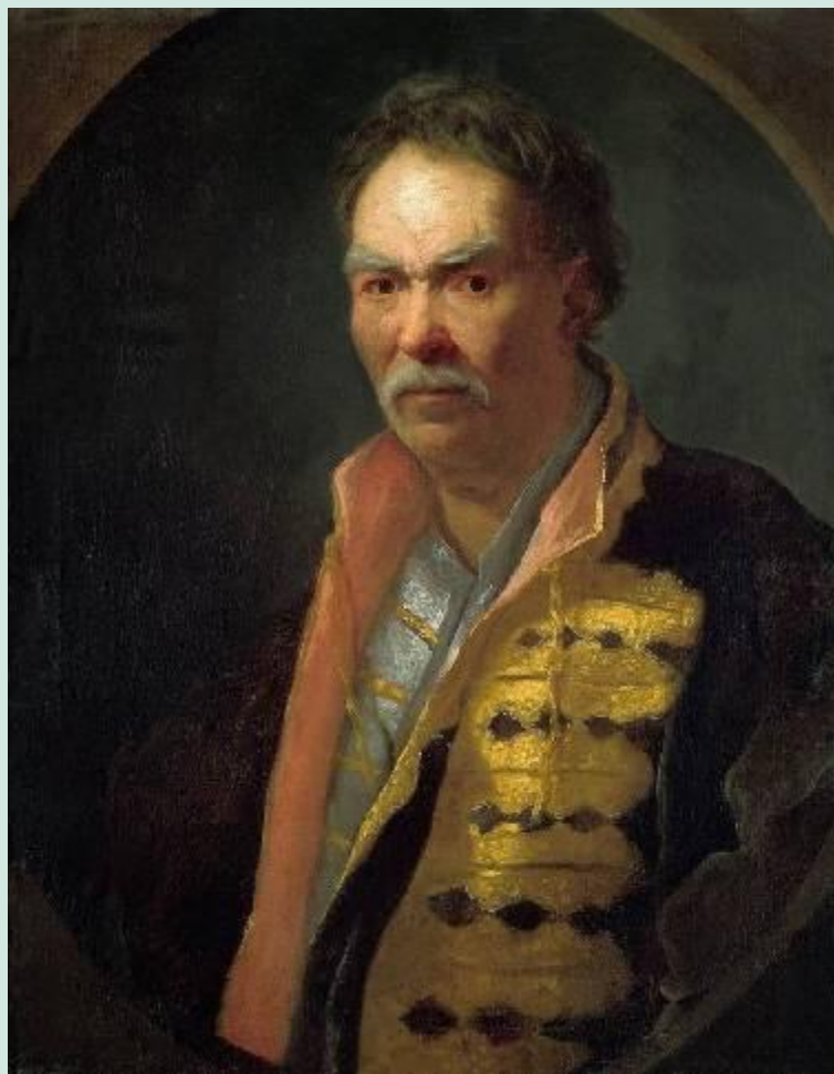
Портрет напольного гетмана