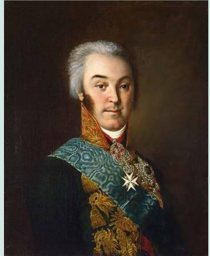
Н. И. Аргунов Портрет Н.П.Шереметьева

Сын Ивана Петровича Аргунова Николай стал крупным портретистом.