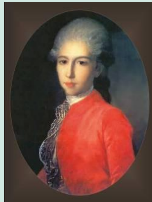
Портрет князя И.Барятинского

Ф.Рокотов- один из самых изысканных и тонких живописцев в европейском искусстве XVIII в. Это художник самобытного дарования , необычайно поэтический и лирический.