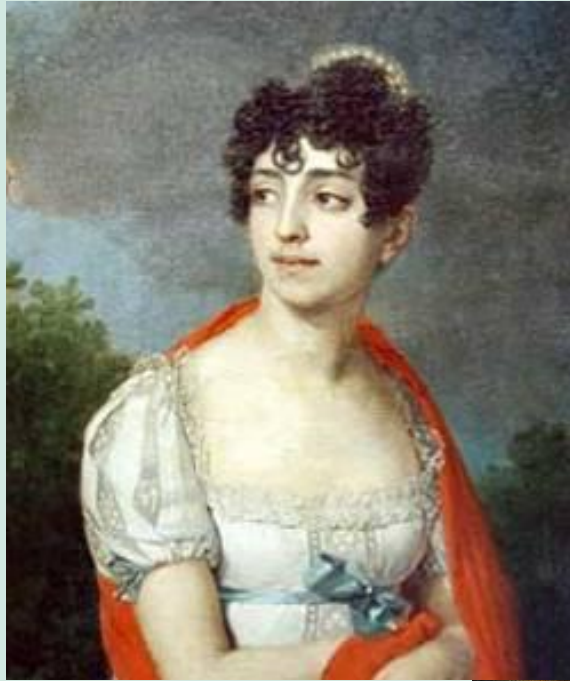
Портрет княгини Барятинской

Боровиковский Владимир Лукич (1757-1825)