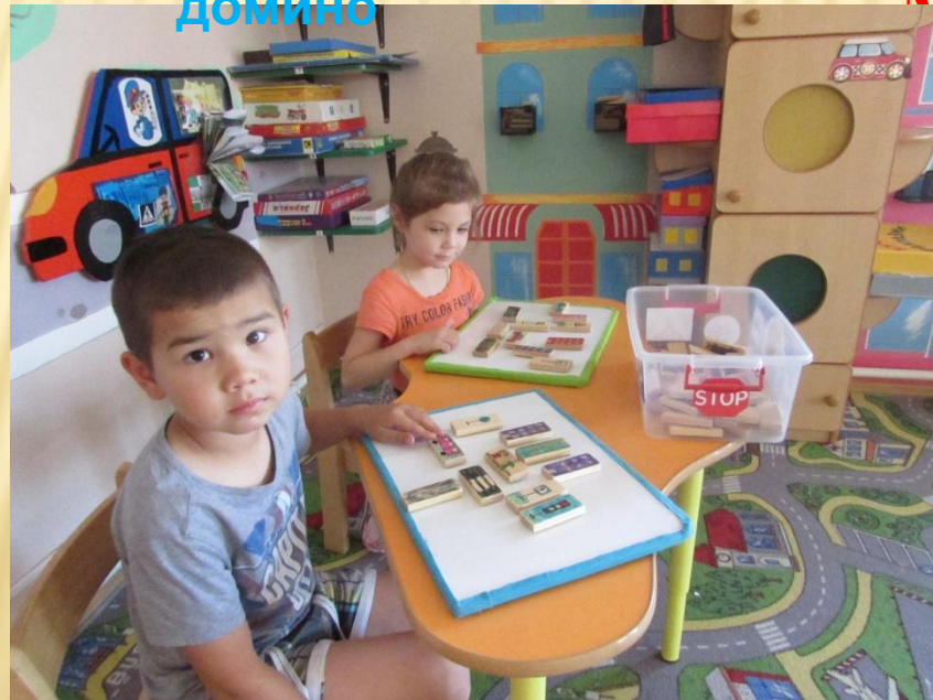
Фантазии на домино