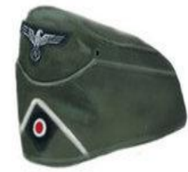
Side Cap M38