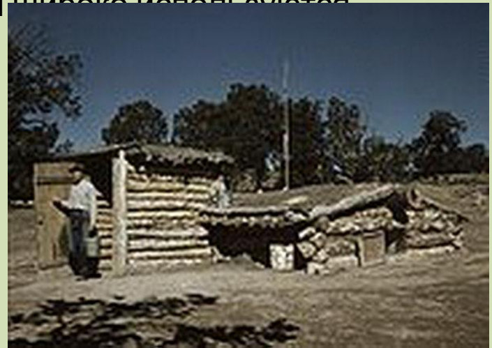
Землянки - первые жилища простых китайцев