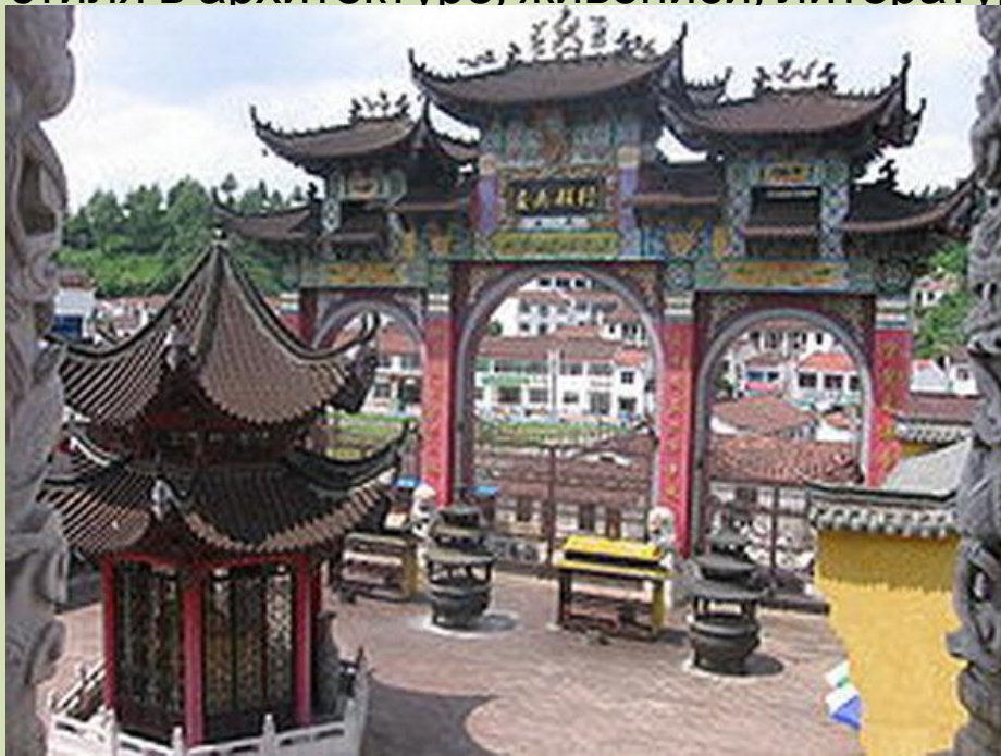
Ворота Буддийского храма

Буддизм проник в Китай на рубеже III - II до н. э. и воспринимался как часть даосизма . К VI веку он приобрёл статус государственной религии. Буддийские монастыри превратились в крупных земельных собственников и места сосредоточения богатств. Буддизм в Китае не вытеснил конфуцианство и даосизм , а составил комплекс «трех религий», где каждое учение как бы дополняло два других. Учение Будды выражало «внутреннюю» сторону наследия древних китайских мудрецов, в ведении буддистов оказались заупокойные обряды. Эти религии способствовали укреплению династий, которые проводили реформы по «воле Неба», монастыри всегда были центрами образования, науки. Религии способствовали формированию особого стиля в архитектуре, живописи, литературе и музыке.