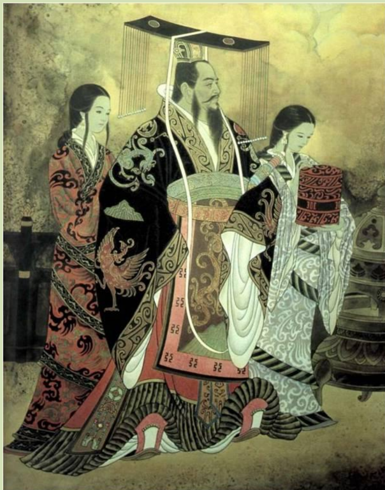
Император Цинь Шихуан