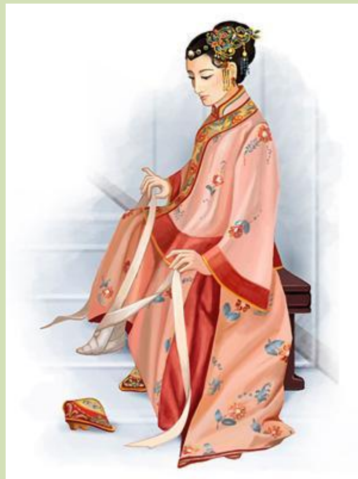
Девушка , бинтующая ножку