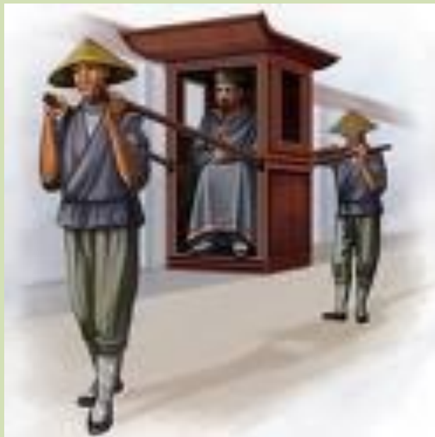
Чиновник в паланкине