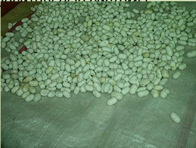
Коконь туового шелкопряда

В середине I тыс. до н. э. Китай переживает бурный социально-экономический рост. Складываются новые центры торговли, численность населения многих городов приближается к полумиллиону. Высокого уровня достигают плавка железа. Успешно развиваются ремесла, строятся гидротехнические сооружения. В земледелии широко используются оросительные системы.