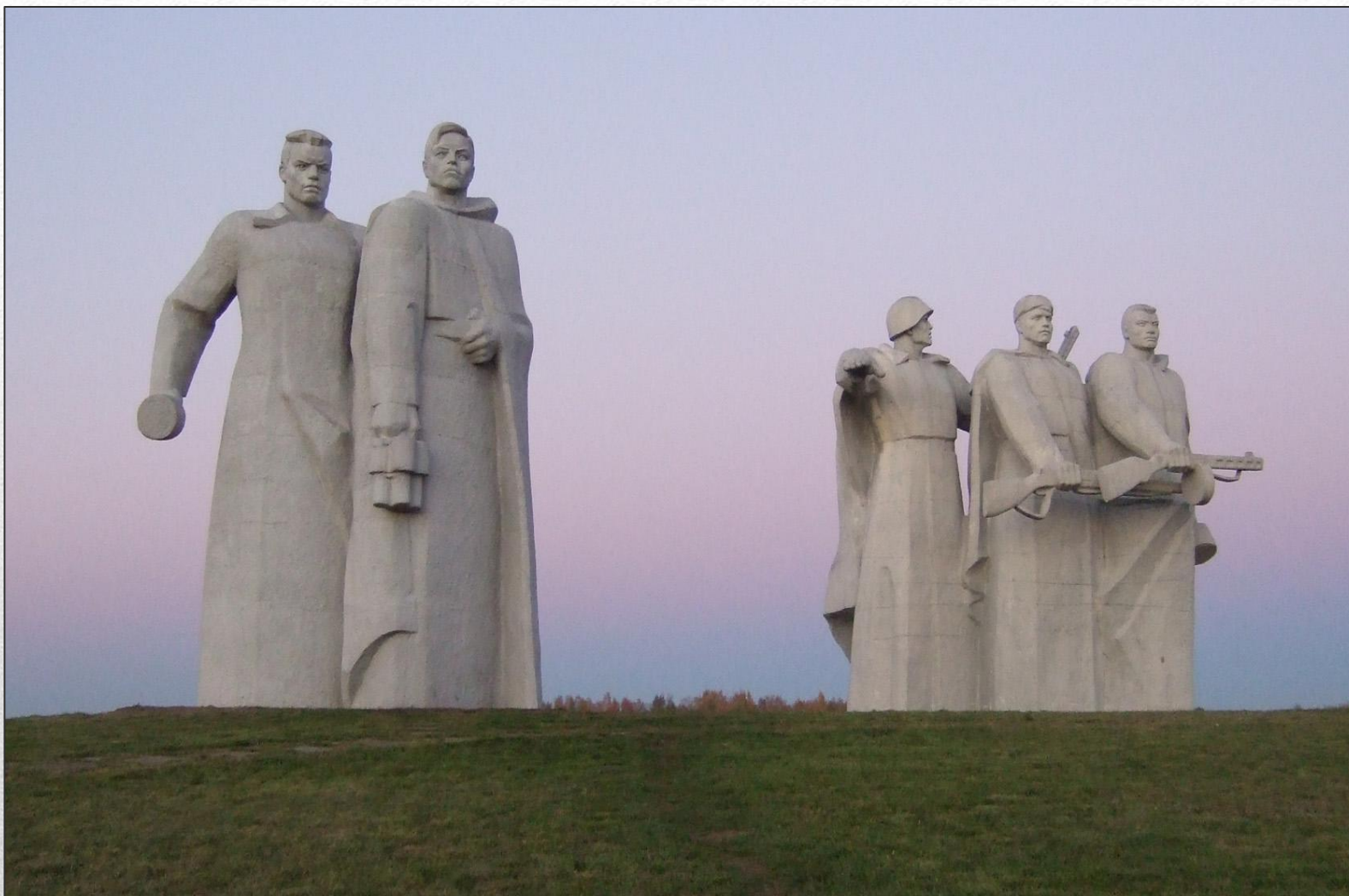
Мемориал «Героям-панфиловцам» у разъезда Дубосеково