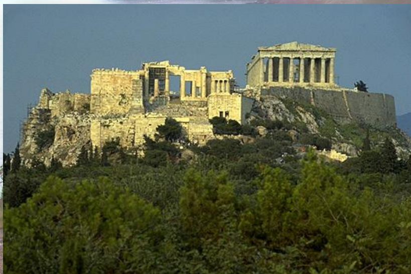
«Старі камені Європи»