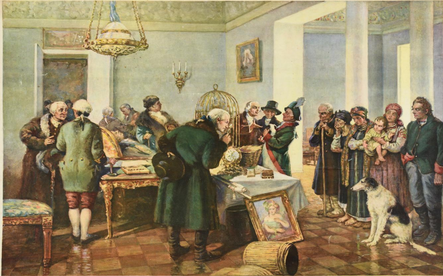
Иллюстрация к роману «Продажа крепостных» К.В. Лебедева. Рисунки: И.И. Шишкин. Редизайн: А.И. Виноградов.