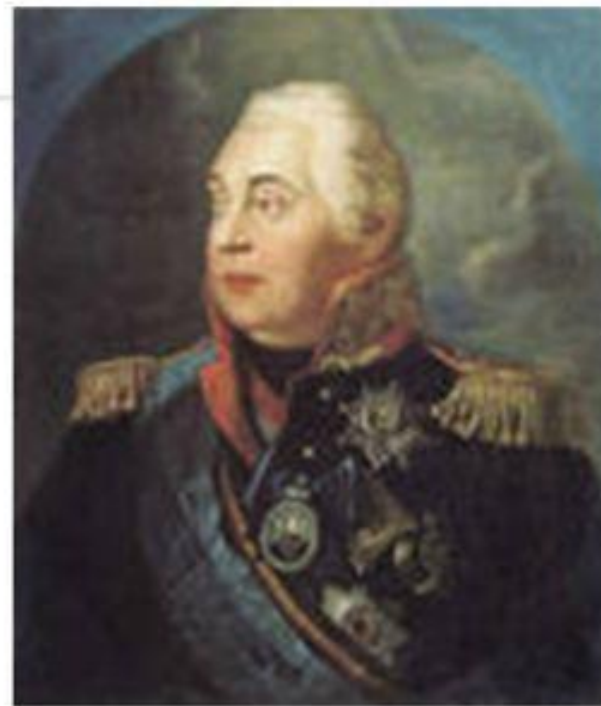
Кутузов Михаил Илларионович