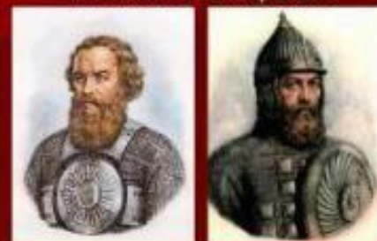
Герои земли Русской