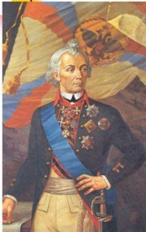
Суворов Александр Васильевич