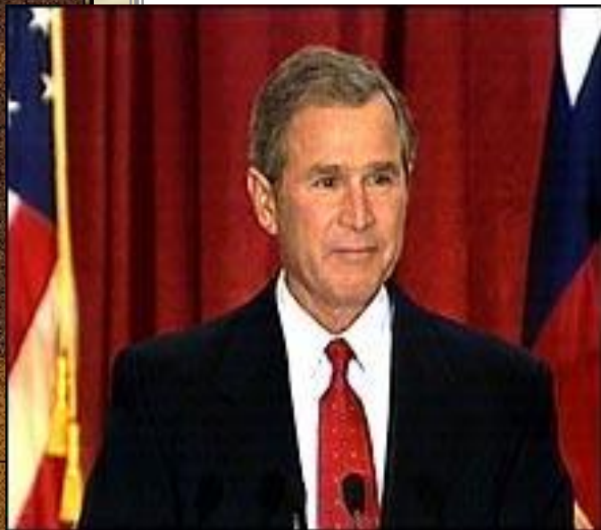
Дж. Буш младший