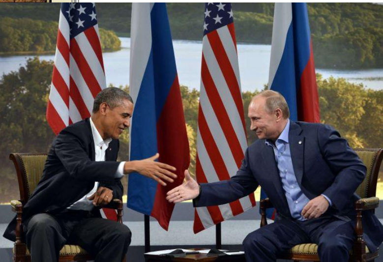
Б.Обама и В.Путин