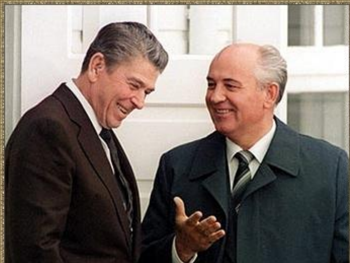
Р. Рейган и М. Горбачев 1986, Рейкьявик

Б. Обама выступил за «перезагрузку» отношений с Россией апрель 2010 США и Россия подписали договор об ограничении стратегических наступательных вооружений.