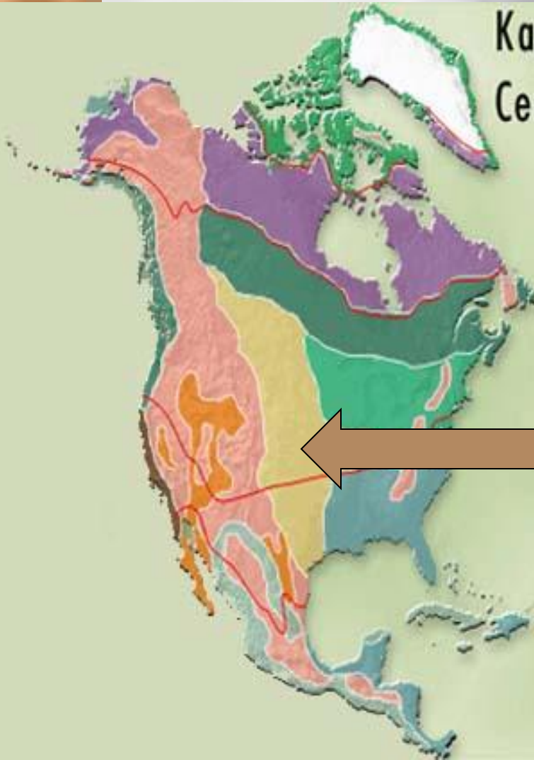
Карта природных зон Северной Америки

Зона степей вытянулась с севера на юг центре материка