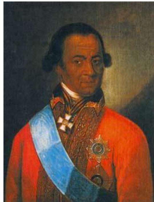
Прадед Александра Сергеевича — знаменитый «арап» Ибрагим (Абрам) Ганнибал, крестник Петра Великого.

Мать поэта, Надежда Осиповна, была внучкой знаменитого Ибрагима Ганнибала.