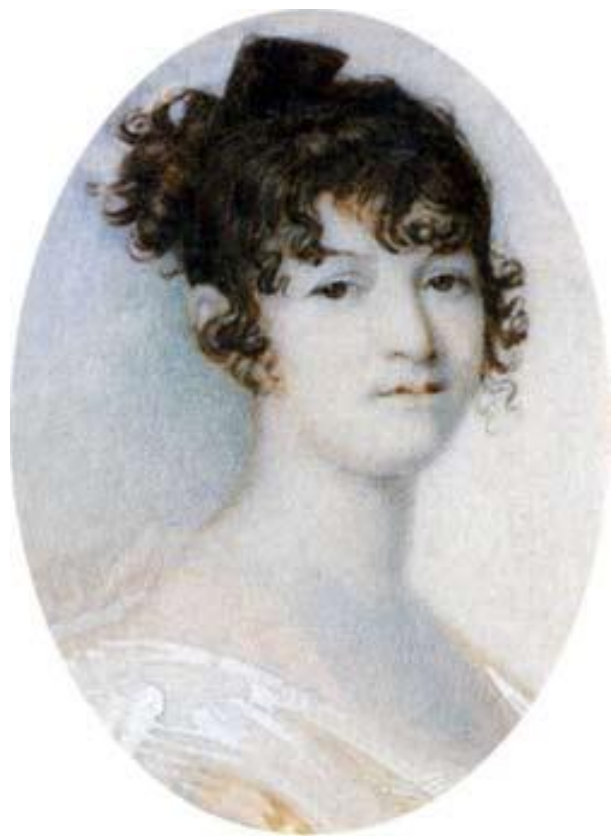
Надежда Осиповна Пушкина, рожд. Ганнибал (1775-1836), мать поэта. Художник Ксавье де Местр. 1800-е гг.

Мать поэта, Надежда Осиповна, была внучкой знаменитого Ибрагима Ганнибала.