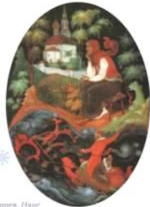
К. Бокшнев. Няне

Светлица — в старину так называли светлую комнату, часто расположенную в верхней части дома.