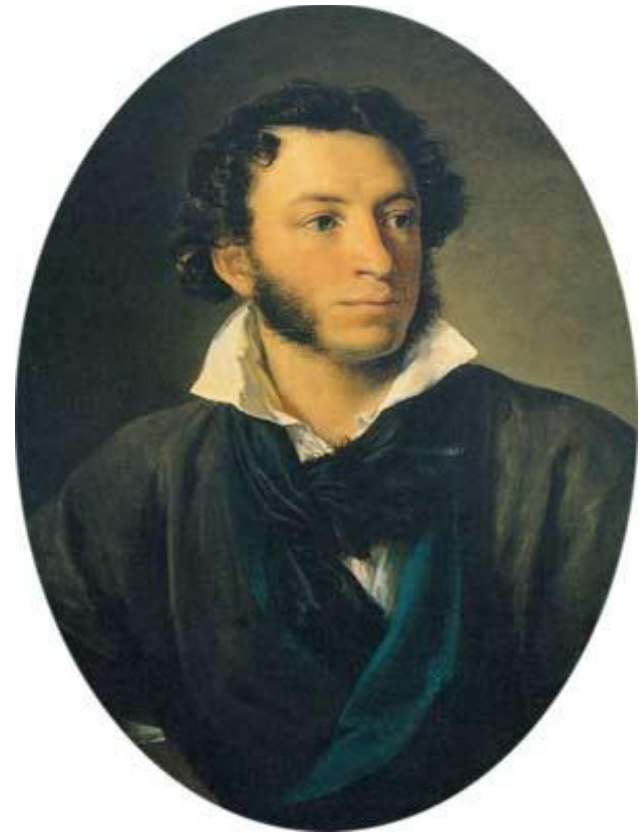
А.С.Пушкин. Портрет работы В. А.Тропинина. 1827 г.

Александр Сергеевич Пушкин.... Это имя сопровождает нас всю жизнь.