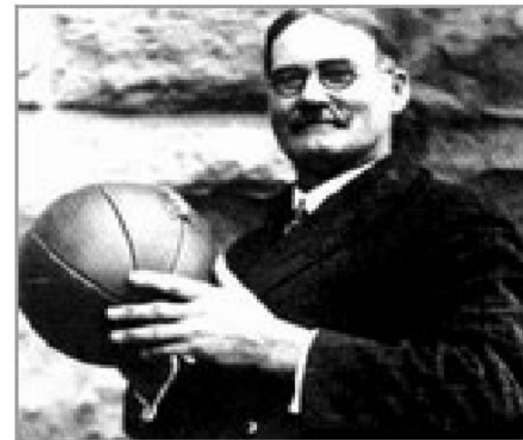
Изобретатель баскетбола Джеймс Нейсмит