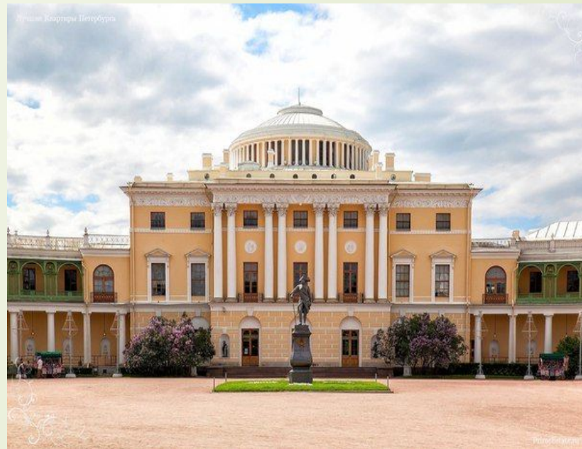
Павловский дворец арх. Ч. Камерон (Павловск)