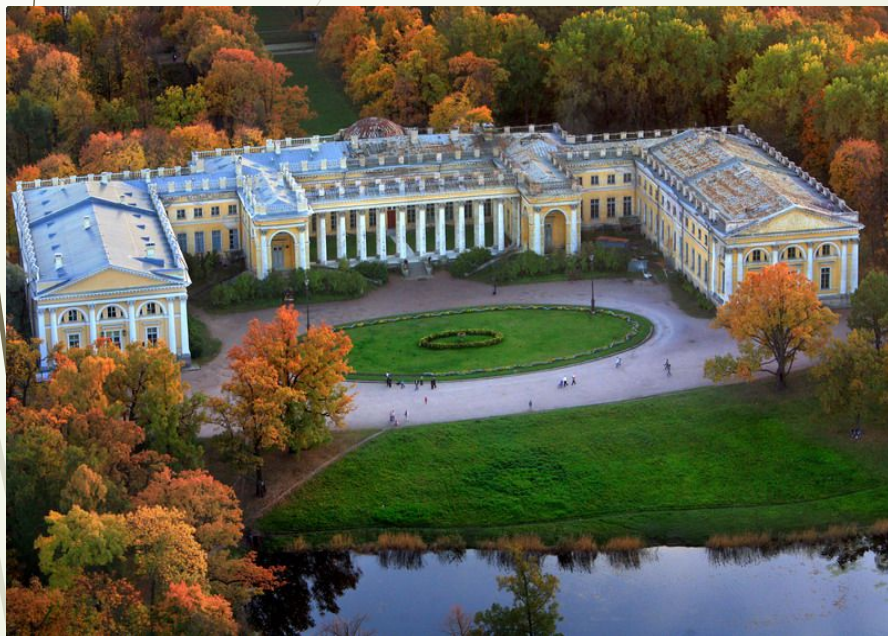
Александровский дворец арх. Д. Кваренги (Царское село)