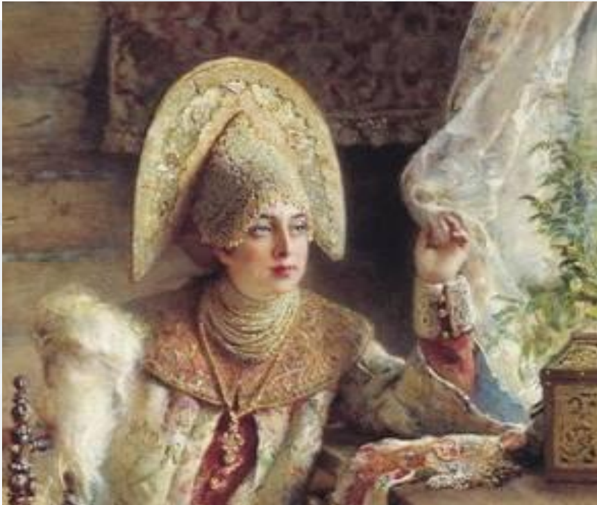
Маковский К.Е. Боярышня у окна (с прялкой). 1890-е (фрагмент картины)

Коккошник (от слав. «кокош», обозначающего курицу и петуха, от древнерусского «кокошь» — курица-наседка, в отличие от «кокот» — петух, диалект. кокошка, кокуй, златоглав, головка, наклонник, наклонка, шеломок, ряска ) — старинный русский головной убор в виде гребня (опахала или округлого щита) вокруг головы, символ русского традиционного костюма.