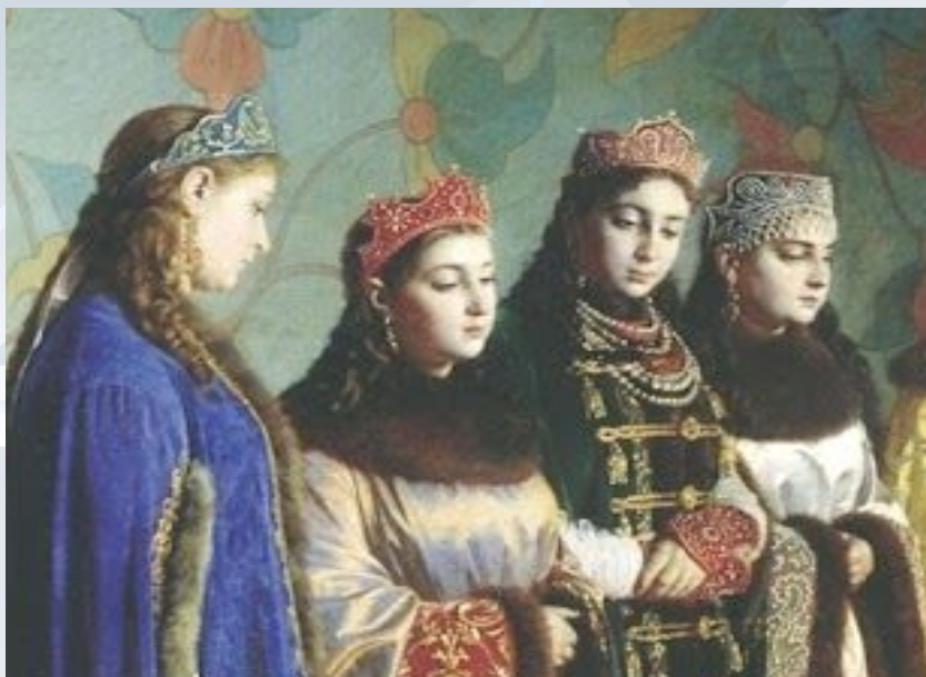
Г.С.Седов «Выбор невесты царем Алексеем Михайловичем» 1882 (фрагмент картины)