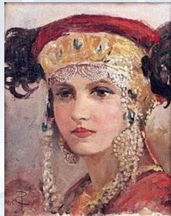
Сергей Соломко «Молодая женщина в народном головном уборе»