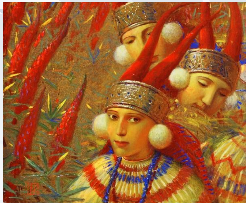
Андрей Ремнёв «Кичка рогатая» 2007