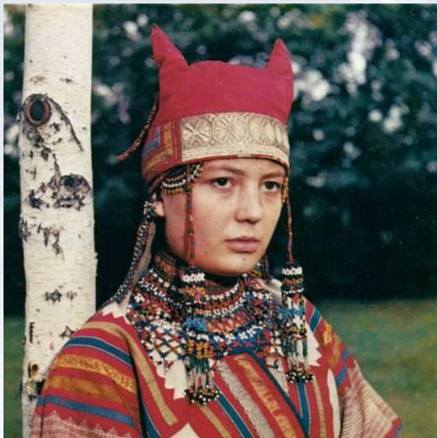
Рогатая кичка - головной убор крестьянок Рязанской губернии. Конец XIX - начало XX веков.

Праздничный головной убор замужней женщины (преимущественно севернорусский). Впервые «чело кичное» упоминается в документе 1328 года. Рогатые кики носились ещё в древности, их особенная форма была связана с существующими в то время поверьями. Позже кика стала атрибутом наряда новобрачной и замужней женщины, так как она, в отличие от девичьего «венца» полностью скрывала волосы. В связи с этим кика стала именоваться «коронай замужества».