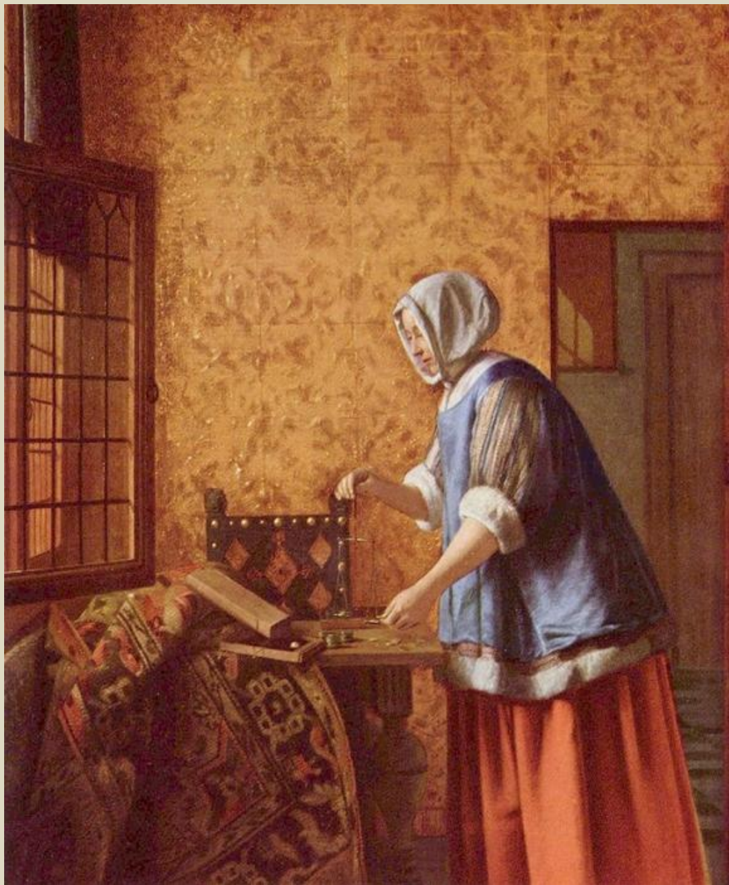
Женщина, взвешивающая золото.