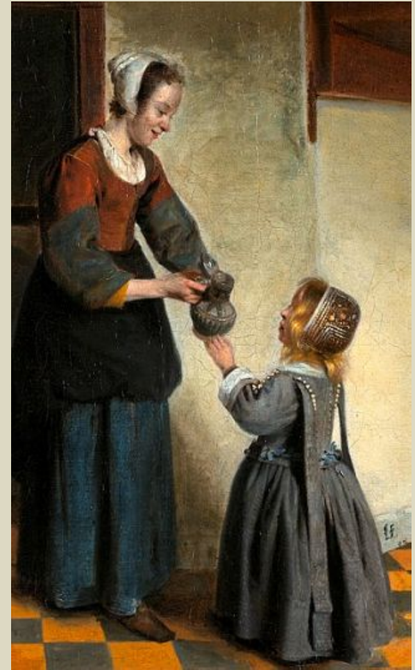
«Кладовая». «Женщина с ребёнком в кладовой». Ок. 1658. Государственный музей. Амстердам