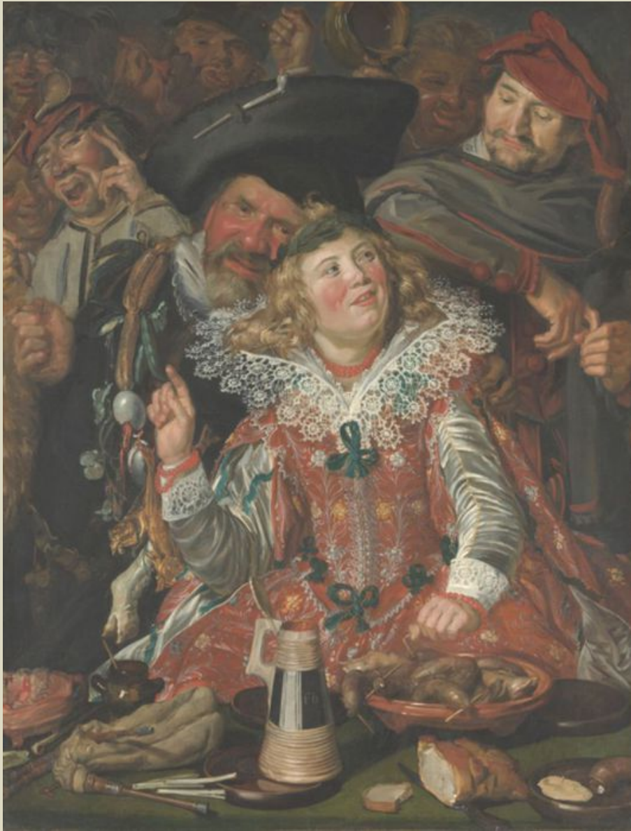
Франс Хальс Масленичное гулянье

Главным объектом изображения для голландских художников была окружающая действительность, никогда ранее не находившая столь полного отображения в произведениях живописцев других национальных школ. Обращение к самым различным сторонам жизни приводило к укреплению реалистических тенденций в живописи, ведущее место в которой заняли бытовой жанр и портрет, пейзаж и натюрморт. Чем правдивее, глубже отражали художники открывающийся перед ними реальный мир, тем более значительными были их произведения.