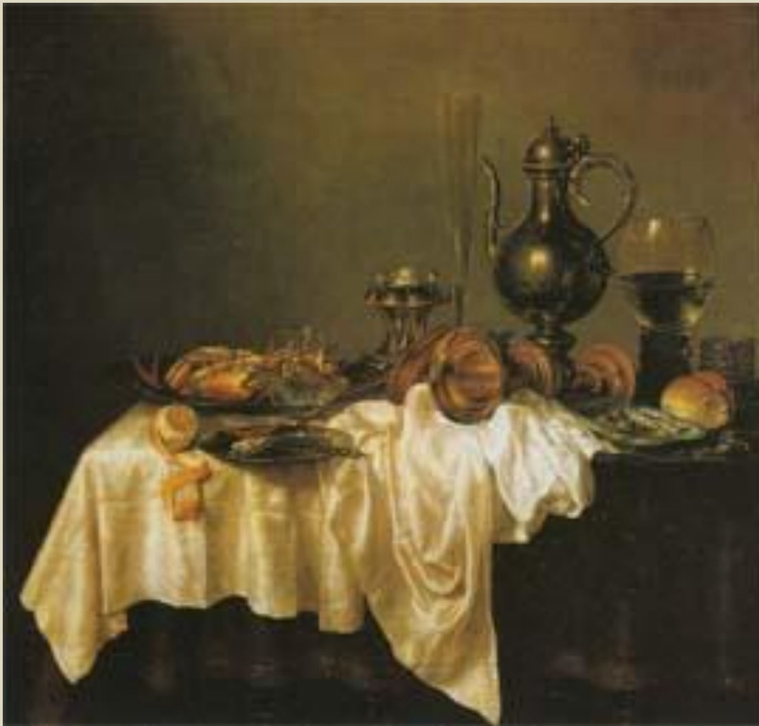
Хеда Виллем Клас Завтрак с крабом

В Голландии XVII в. жанр натюрморта получил большое распространение. Эстетические принципы натюрморта были довольно консервативными: горизонтальный формат полотна, нижний край стола с изображаемой натурой строго параллелен раме. Складки на столовой скатерти, как правило, уходили параллельными линиями, вопреки законам перспективы, в глубину полотна; предметы рассматривались с высокой точки зрения (чтобы легче было охватить их все взглядом), располагались в линию или по кругу и практически не соприкасались