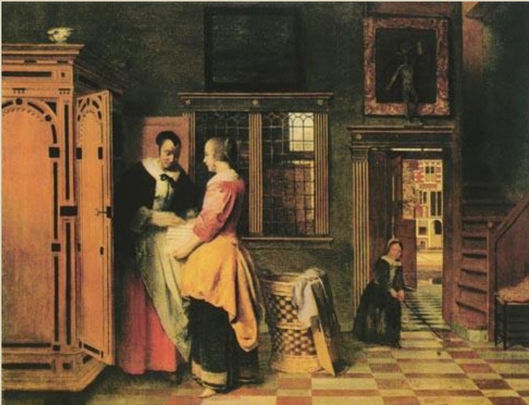
Питер де Хох У бельевого шкафа

Самым популярным в голландской живописи был бытовой жанр , во многом определивший своеобразные пути ее развития по сравнению с искусством других стран. Обращение к самым различным сторонам повседневной жизни, ее поэтизация обусловили формирование разнообразных типов жанровых картин. Высокое живописное мастерство их создателей, оптимистический характер, мягкий лиризм сообщают им то обаяние, которое оправдывает изображение самых незначительных МОТИВОВ.