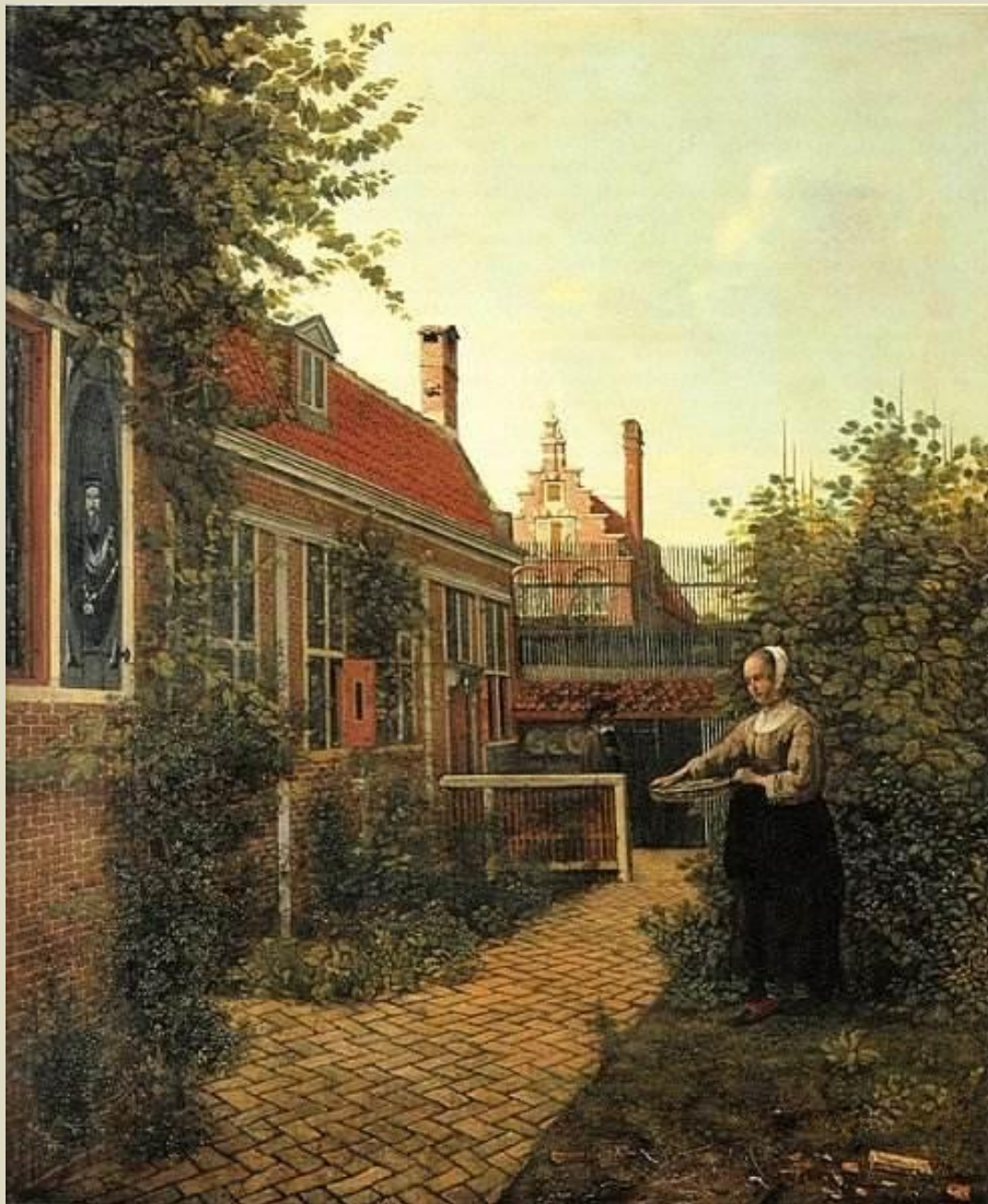
Женщина с корзиной бобов в огороде