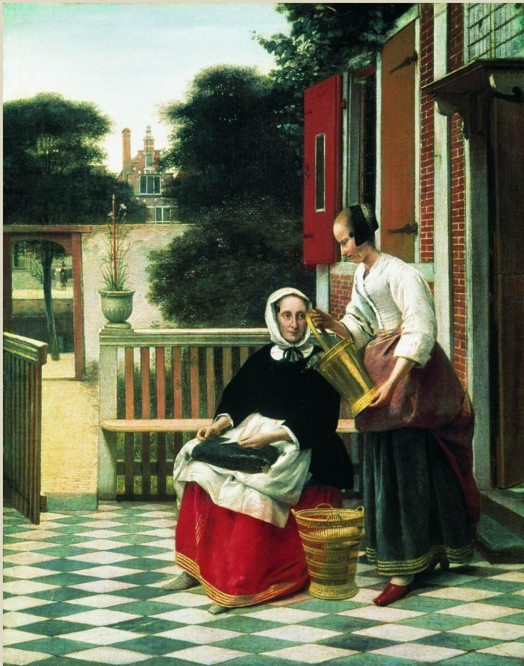
Хозяйка и служанка