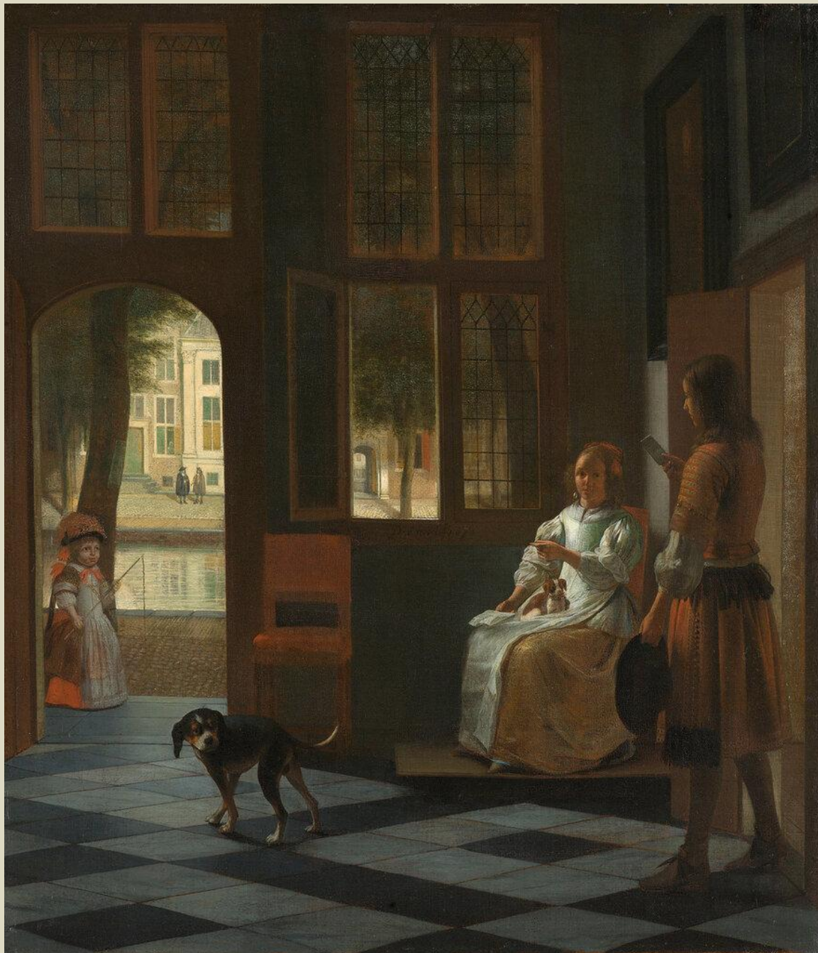
Передача письма в дом. 1670 г.