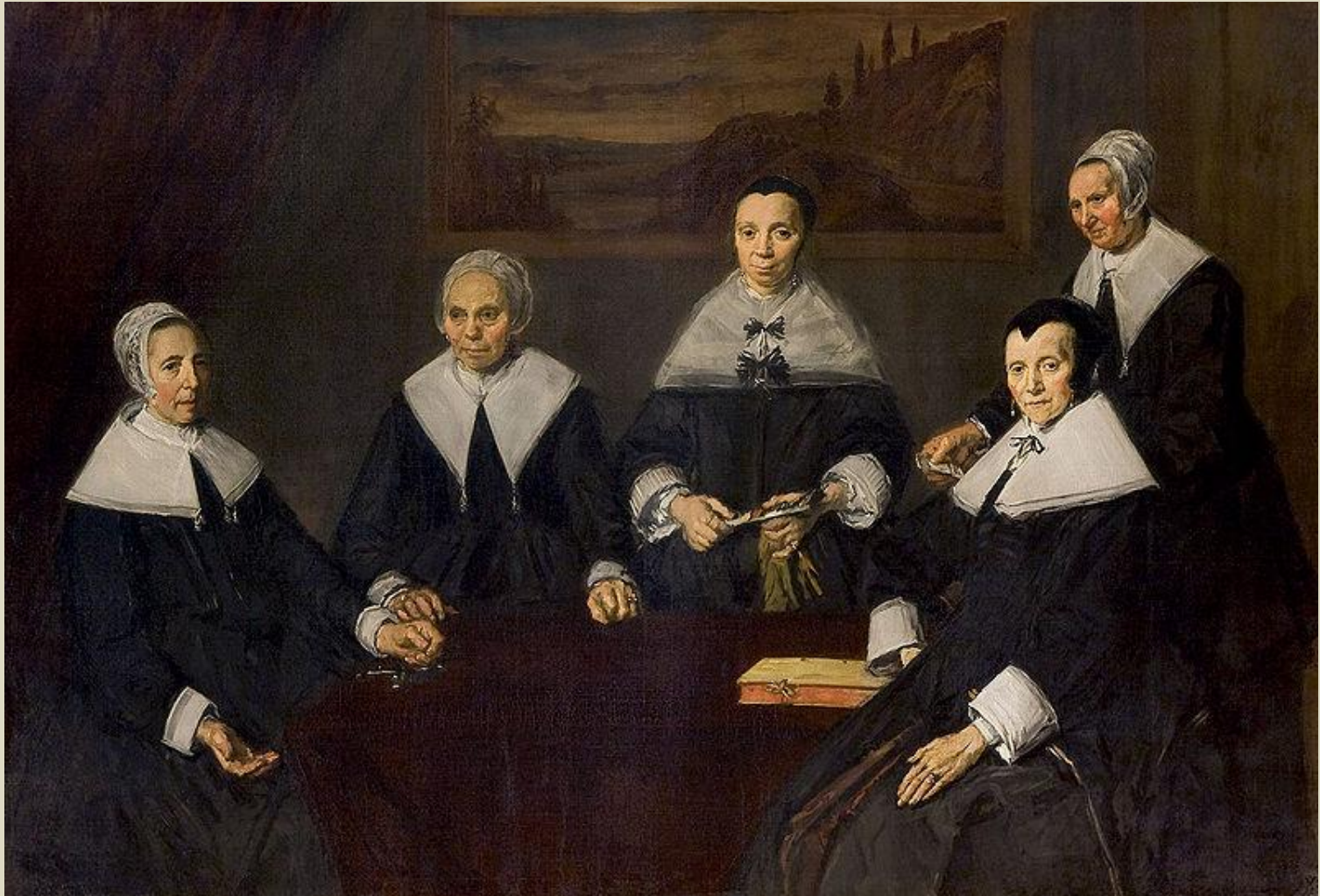
Регентши приюта для престарелых

Высшее достижение Хальса — его последние групповые портреты регентов и регентш (попечителей) приюта для престарелых, исполненные в 1664 г., за два года до смерти художника, одиноко окончившего жизненный путь в приюте.