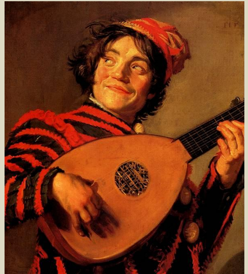
"Паяц с лютней"