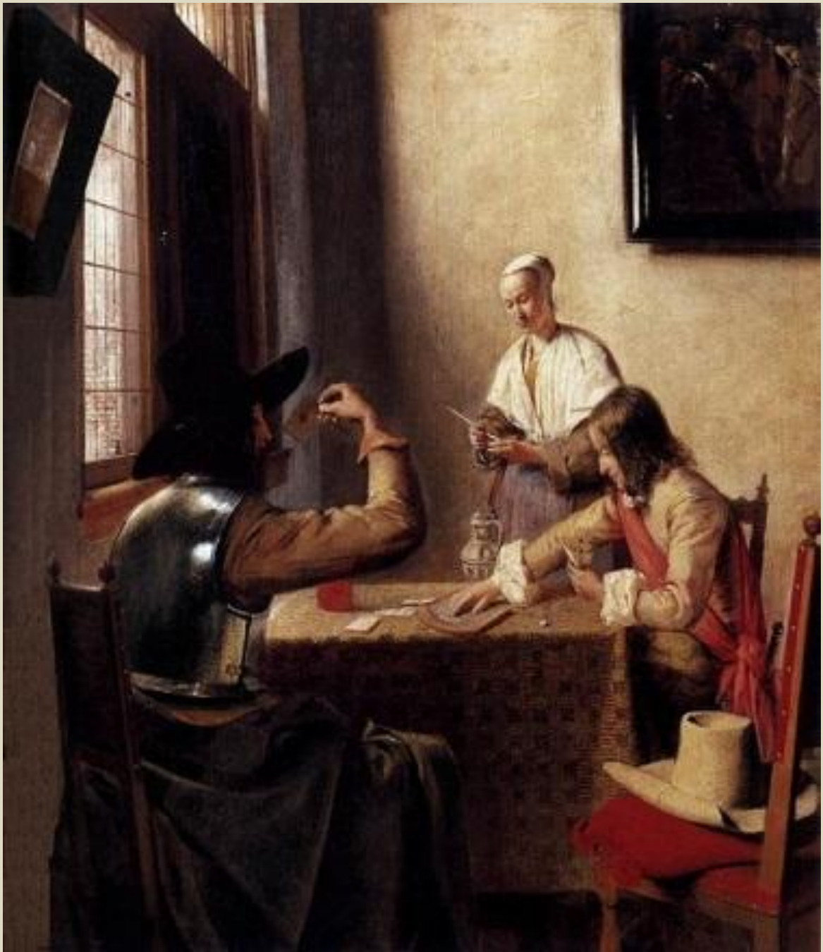
Солдаты, играющие в карты