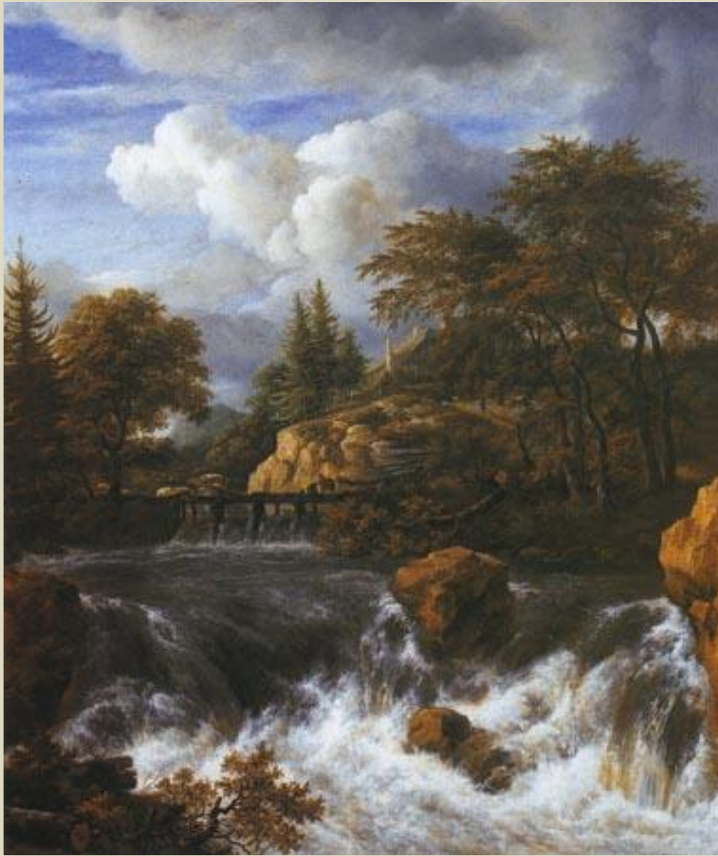
Скалистый пейзаж с водопадом