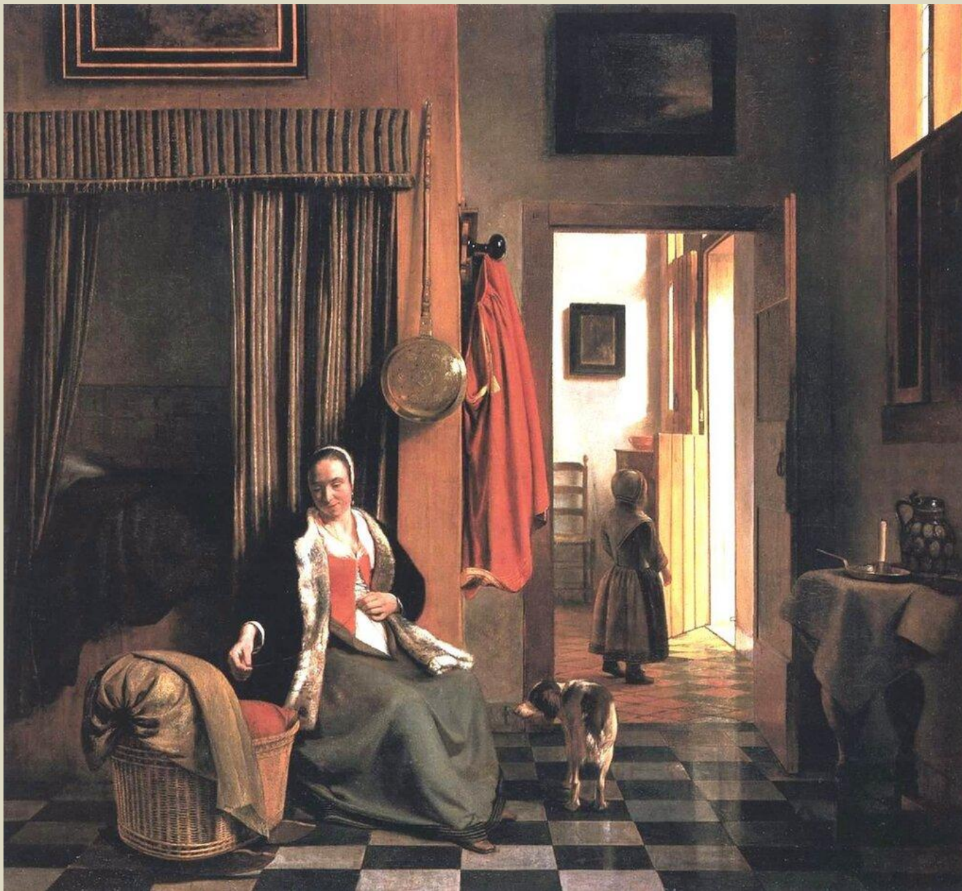
Мать у котелки