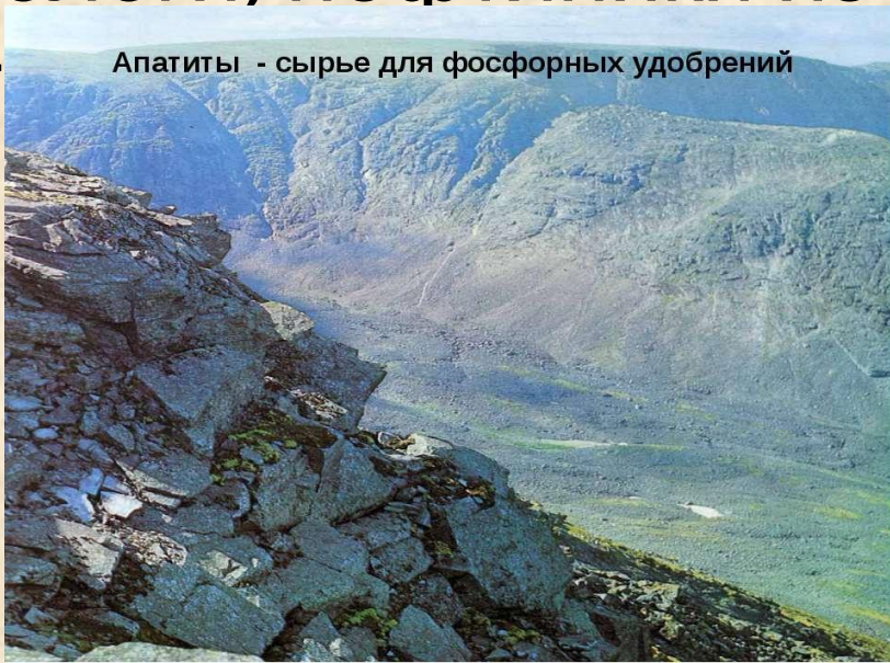
Апатиты - сырье для фосфорных удобрений