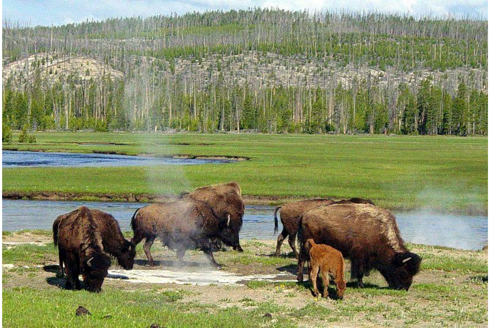
Бизоны у горячего источника