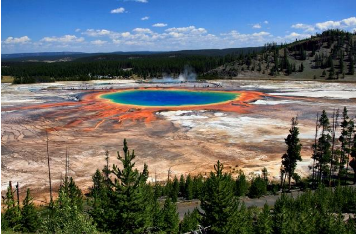
Гейзер Большой Фонтан (Great Fountain Geyser)