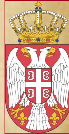
Белый двуглавый орёл