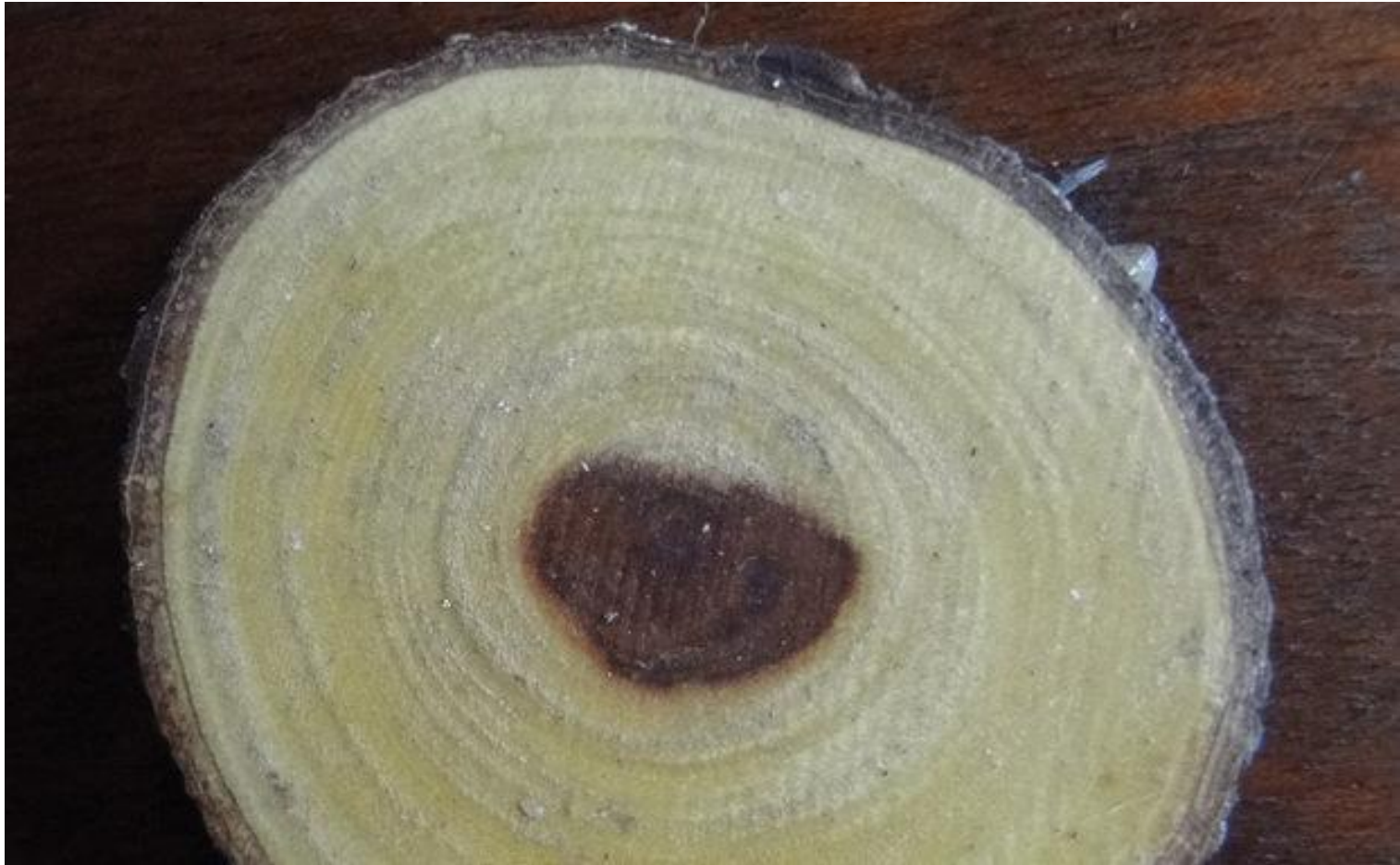
Дерево «пау бразил» (шиповая цезальпиния)