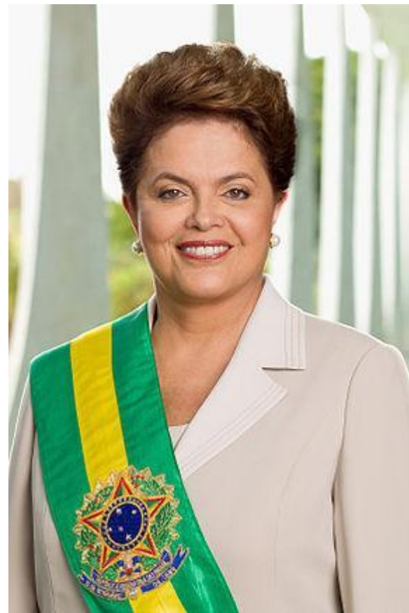
Дилма Русеф (с 1.01.2011 г.), избрана от Партии трудящихся