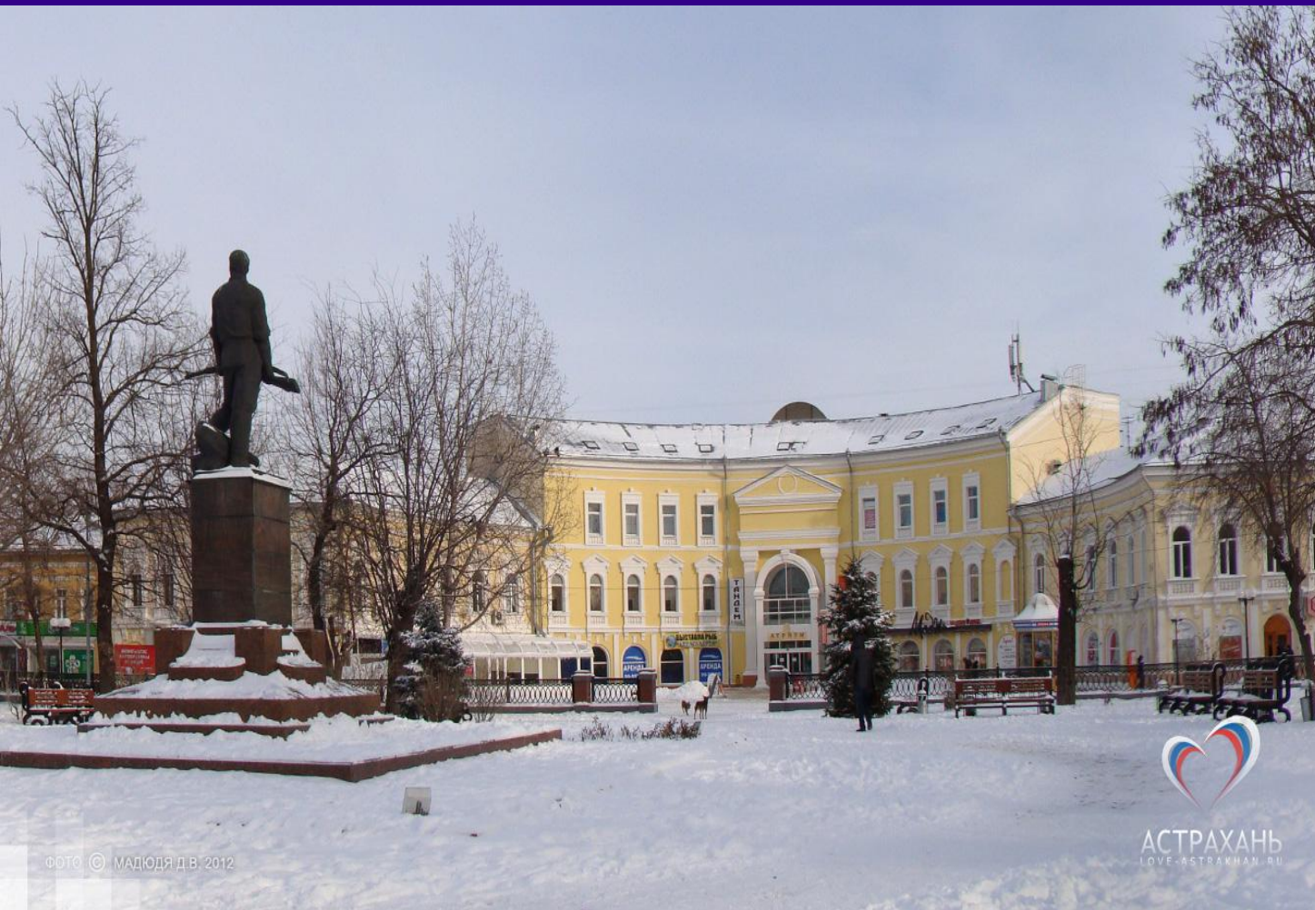
ФОТО © МАДОДЯ Д.В. 2012