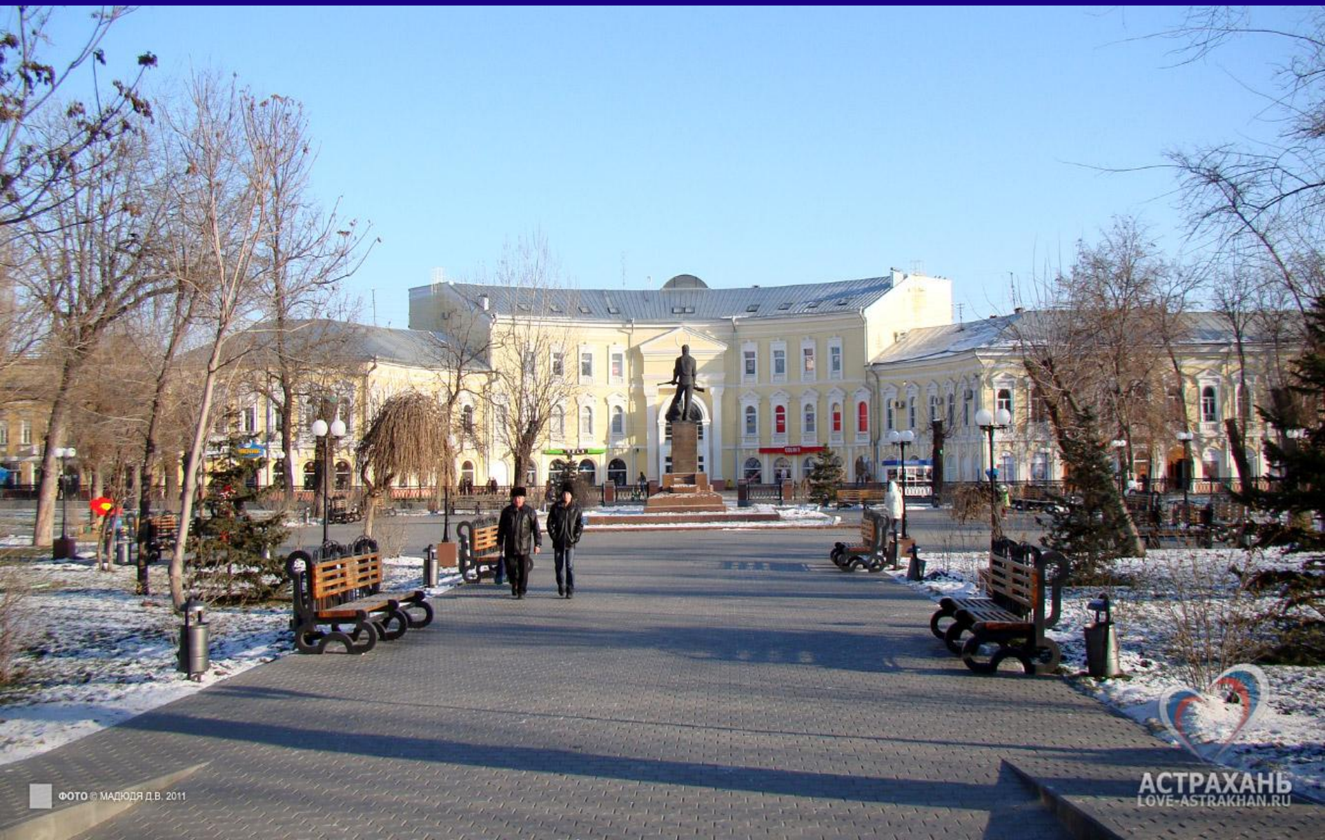
ФОТО © МАДЮДА Д.В. 2011