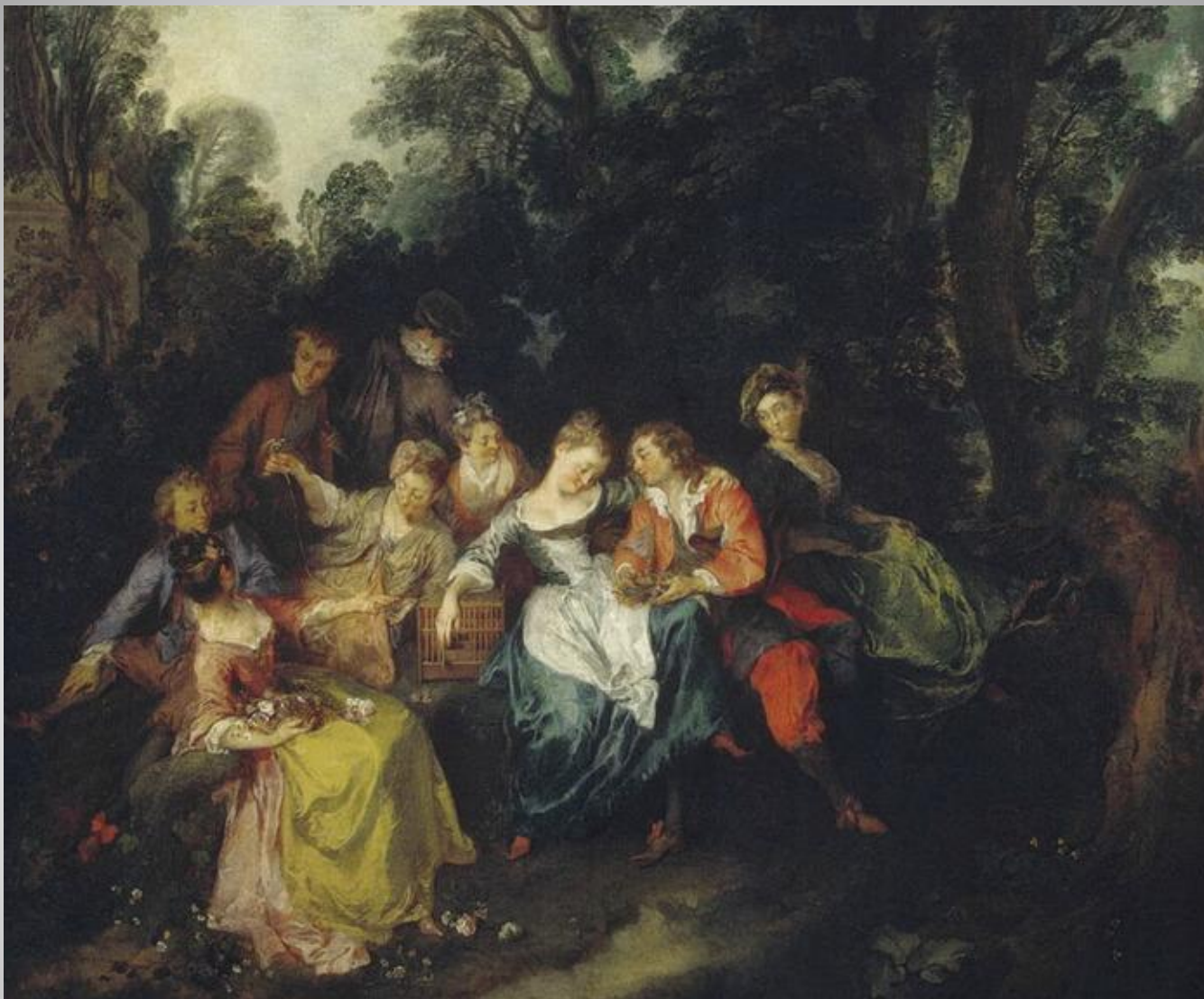
Н. Ланкре Общество в парке