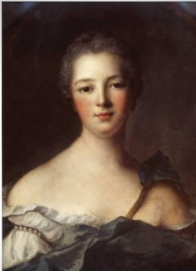
К. Ванлоо Женский портрет