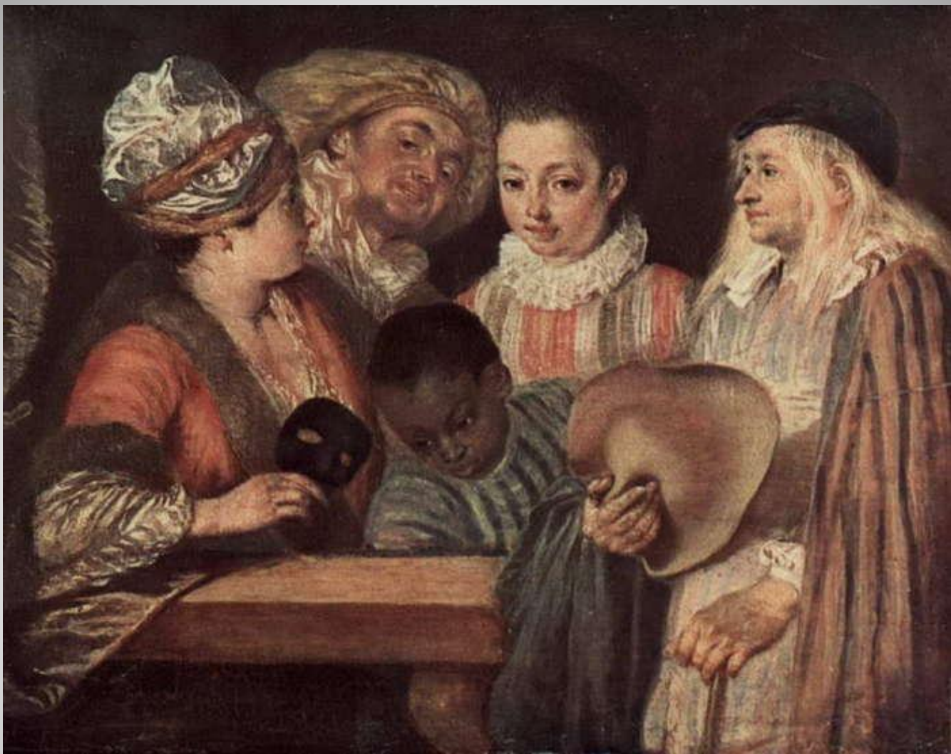
Ж.А. Ватто Актеры