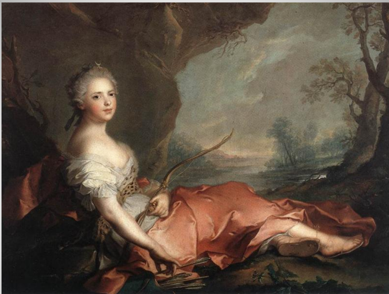
Жан-Марк Натъе Мария Аделаида в образе богини Дианы