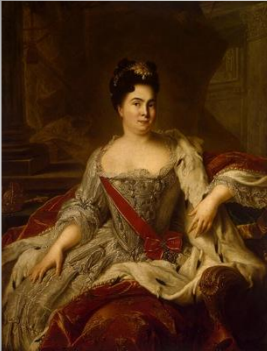
Жан Марк Натъе Портрет Екатерины I