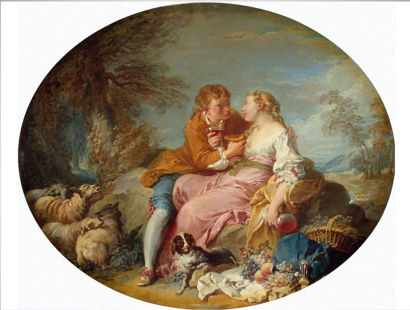
Франсуа Буше Пастораль