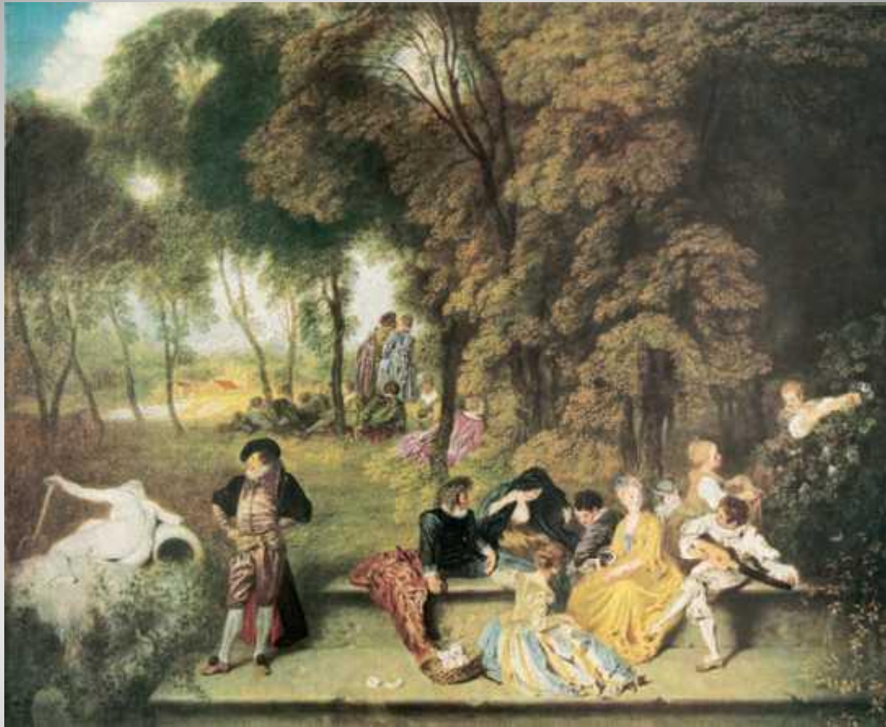
Жан Антуан Ватто Компания на лоне природы