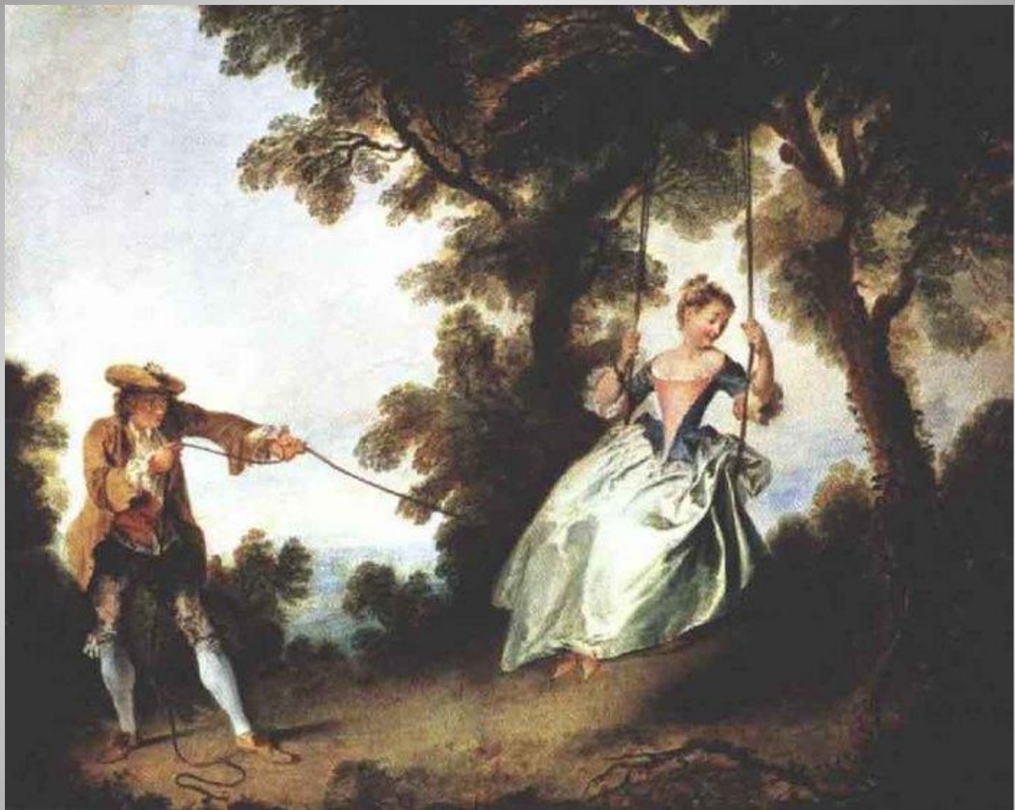
Н. Ланкре Качели