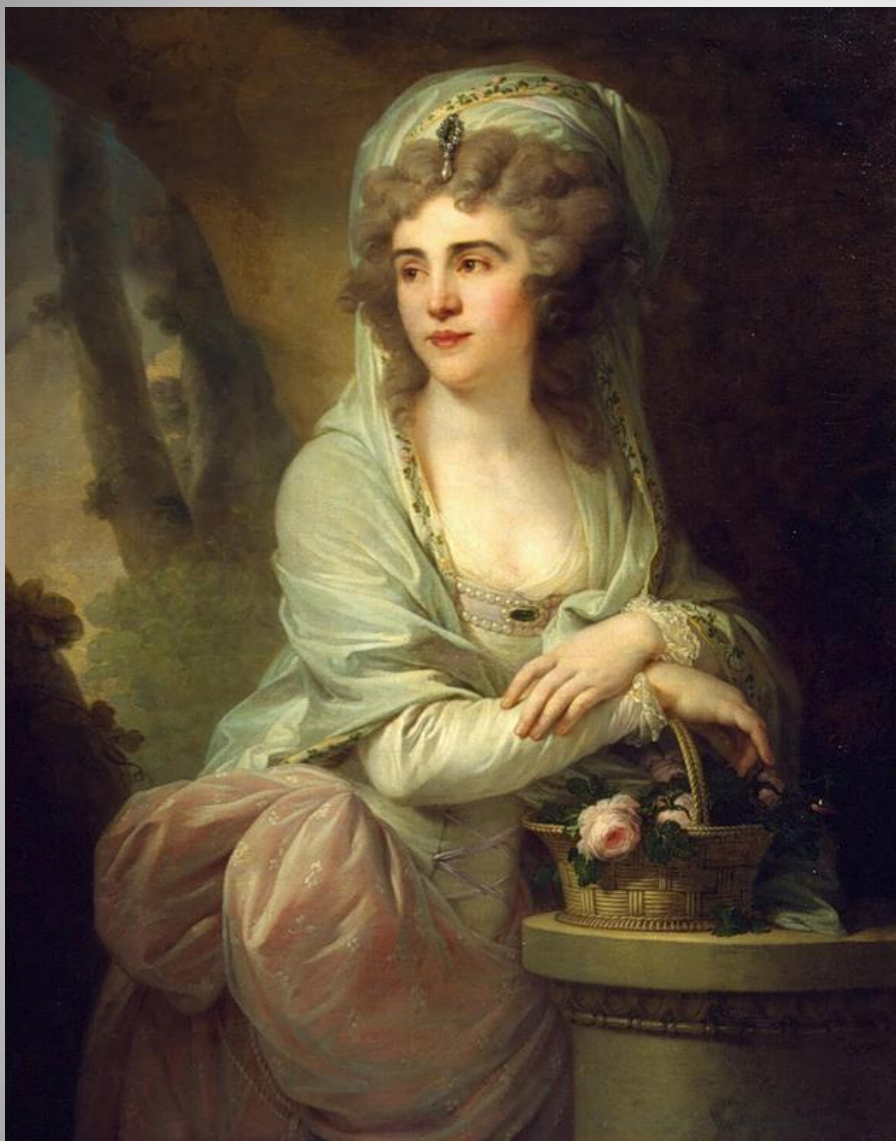
Н. Ларжильер Женский портрет