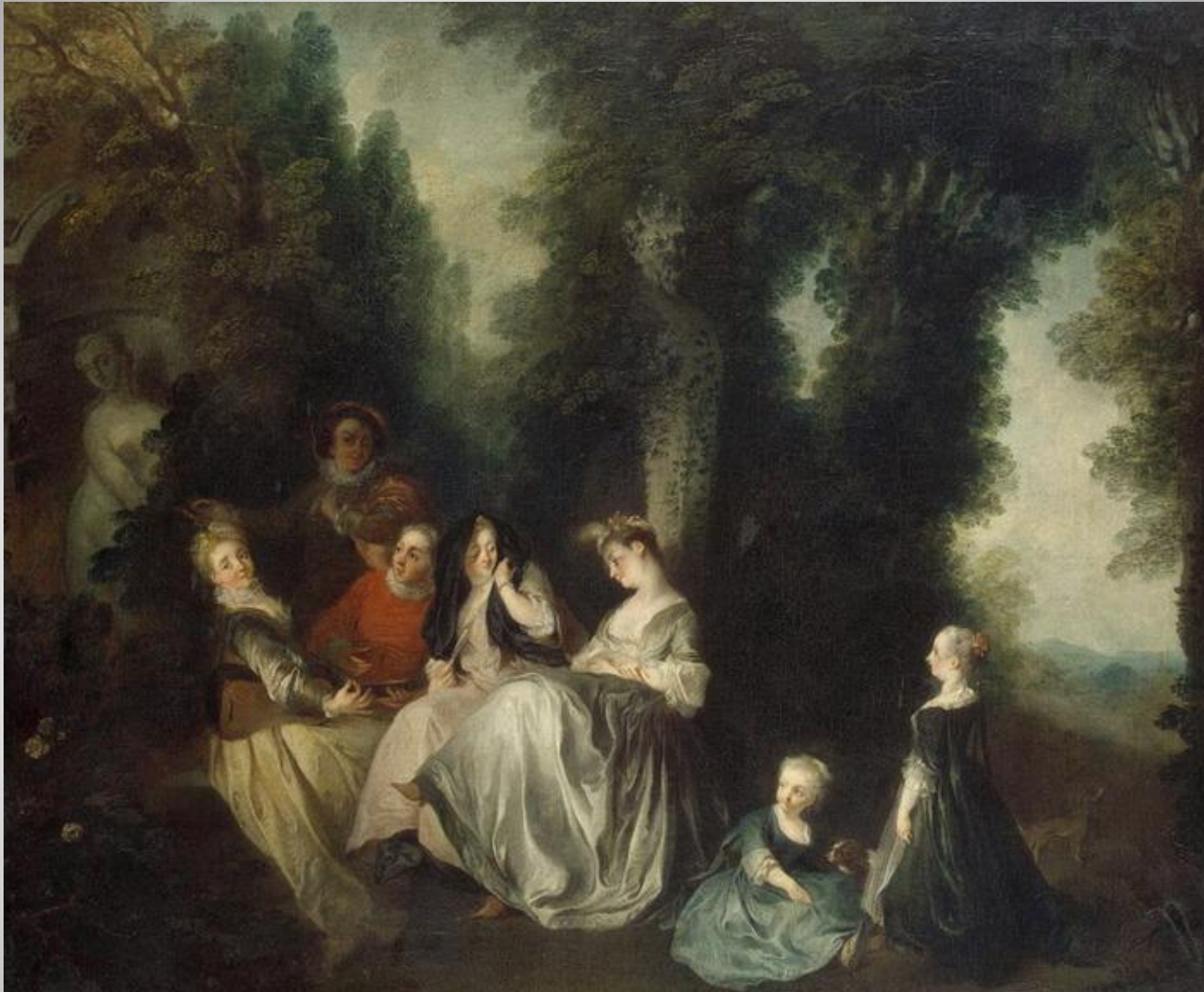
Н. Ланкре Общество в саду