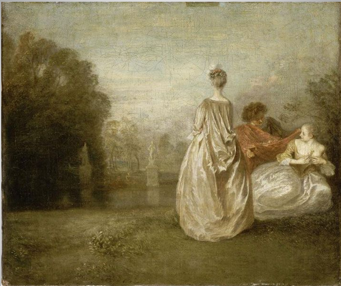
Ж.А. Ватто Две кузины