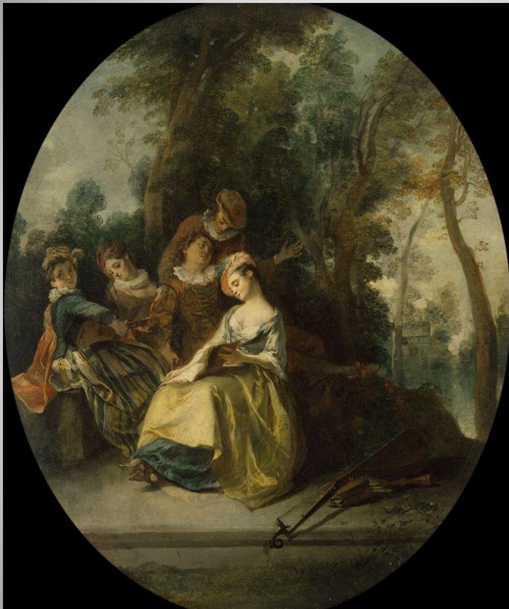
Н. Ланкре Концерт в парке