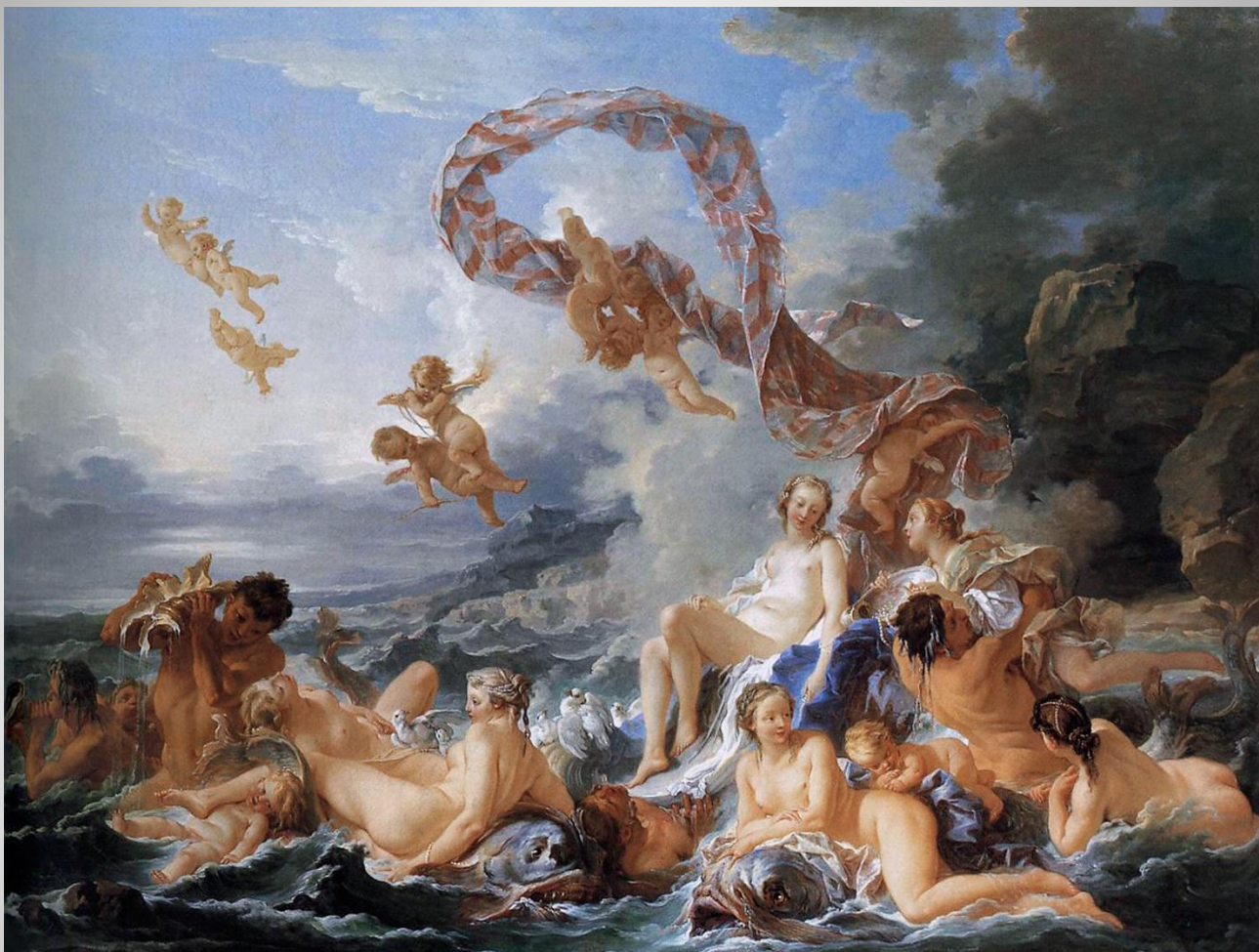
Франсуа Буше Триумф Венеры