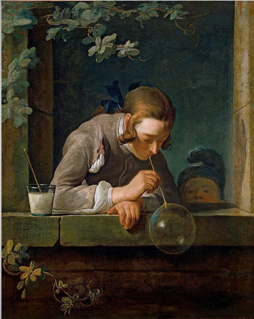
Ж.Б.С. Шарден Мальчик, пускающий мыльные пузыри