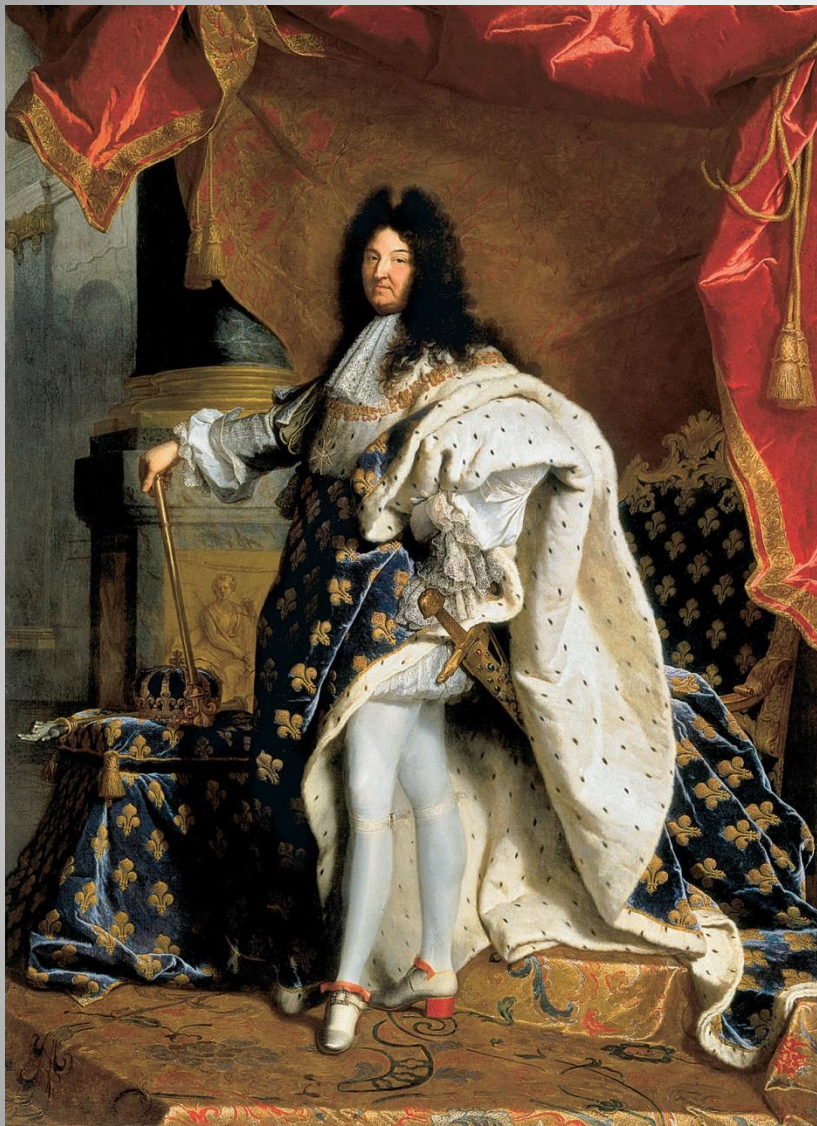
Иасент Риго Портрет Людовика XIV