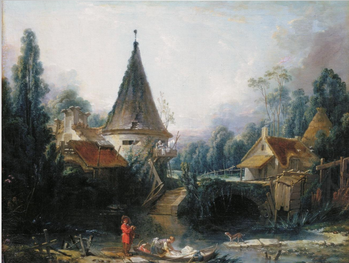
Франсуа Буше Вид в окрестностях Бове