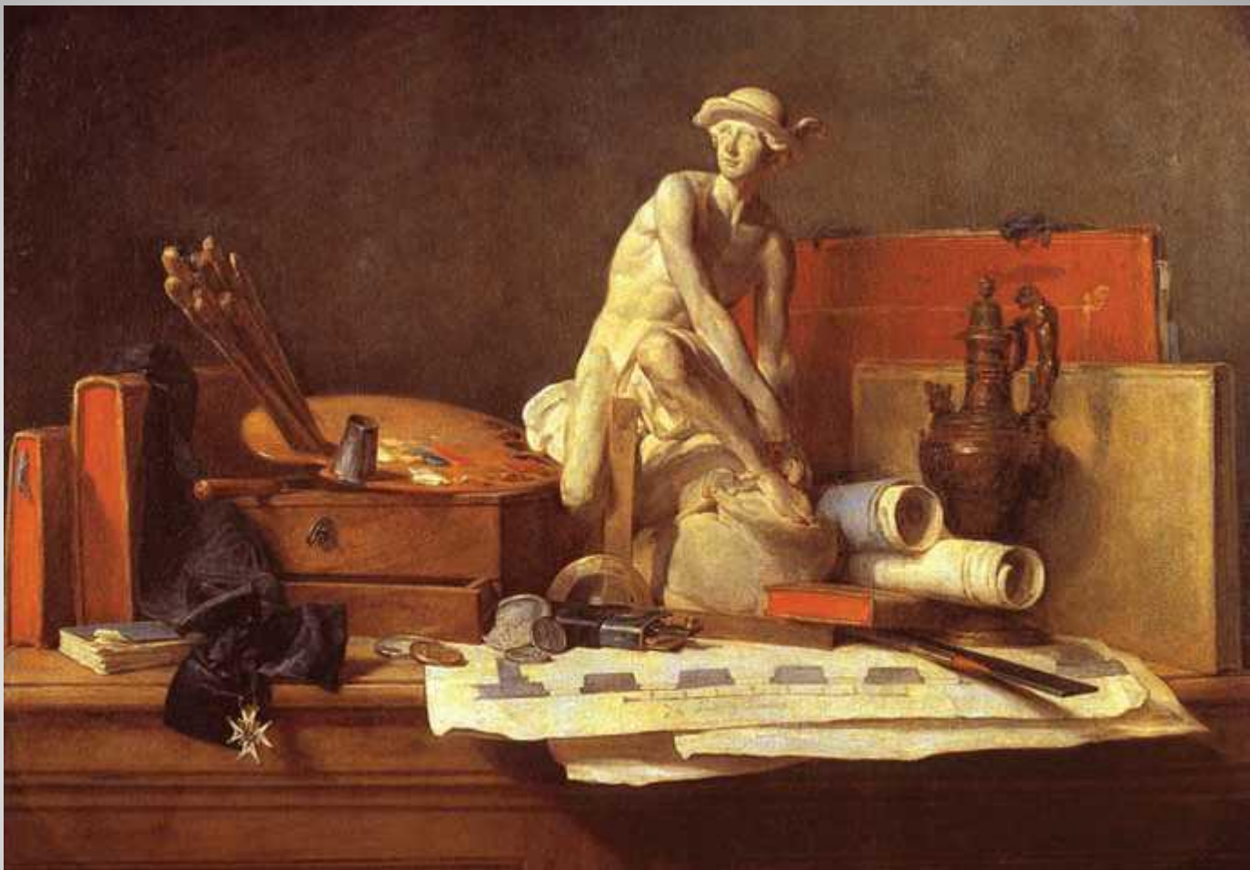
Ж.Б.С. Шарден Атрибуты искусства