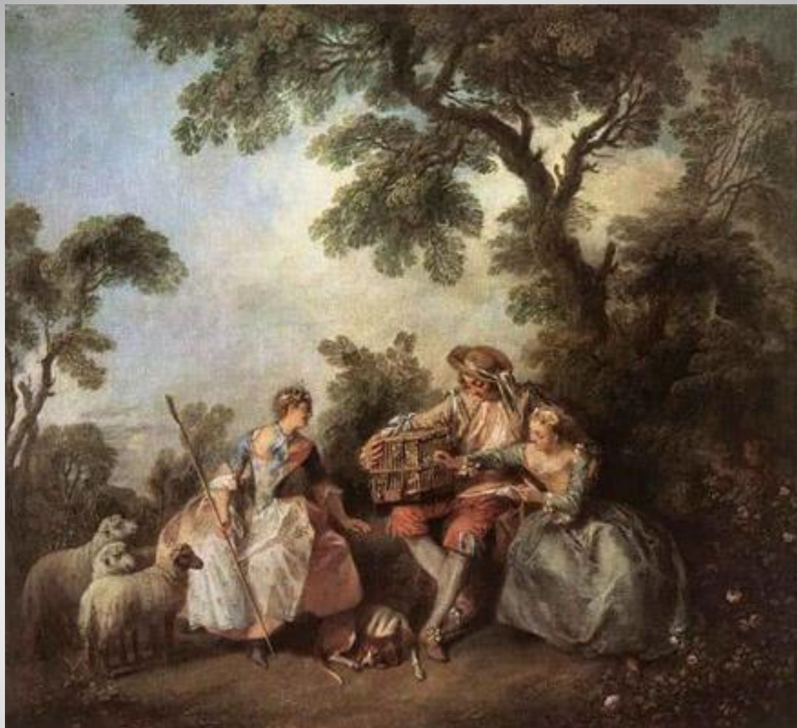
Никола Ланкре Птица в клетке