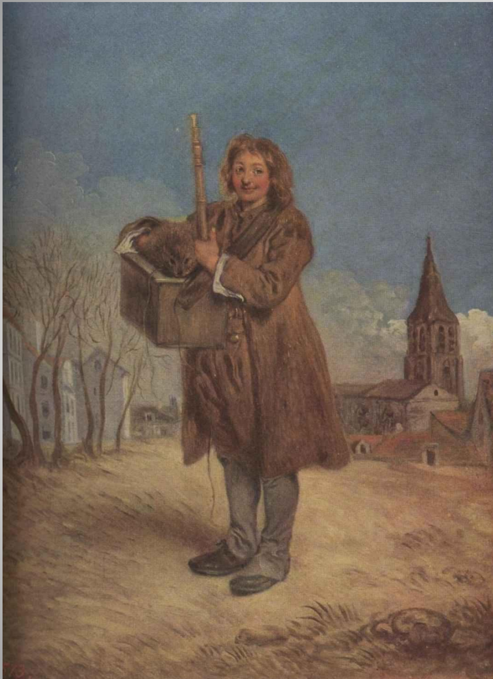
Жан Антуан Ватто (1684-1721)