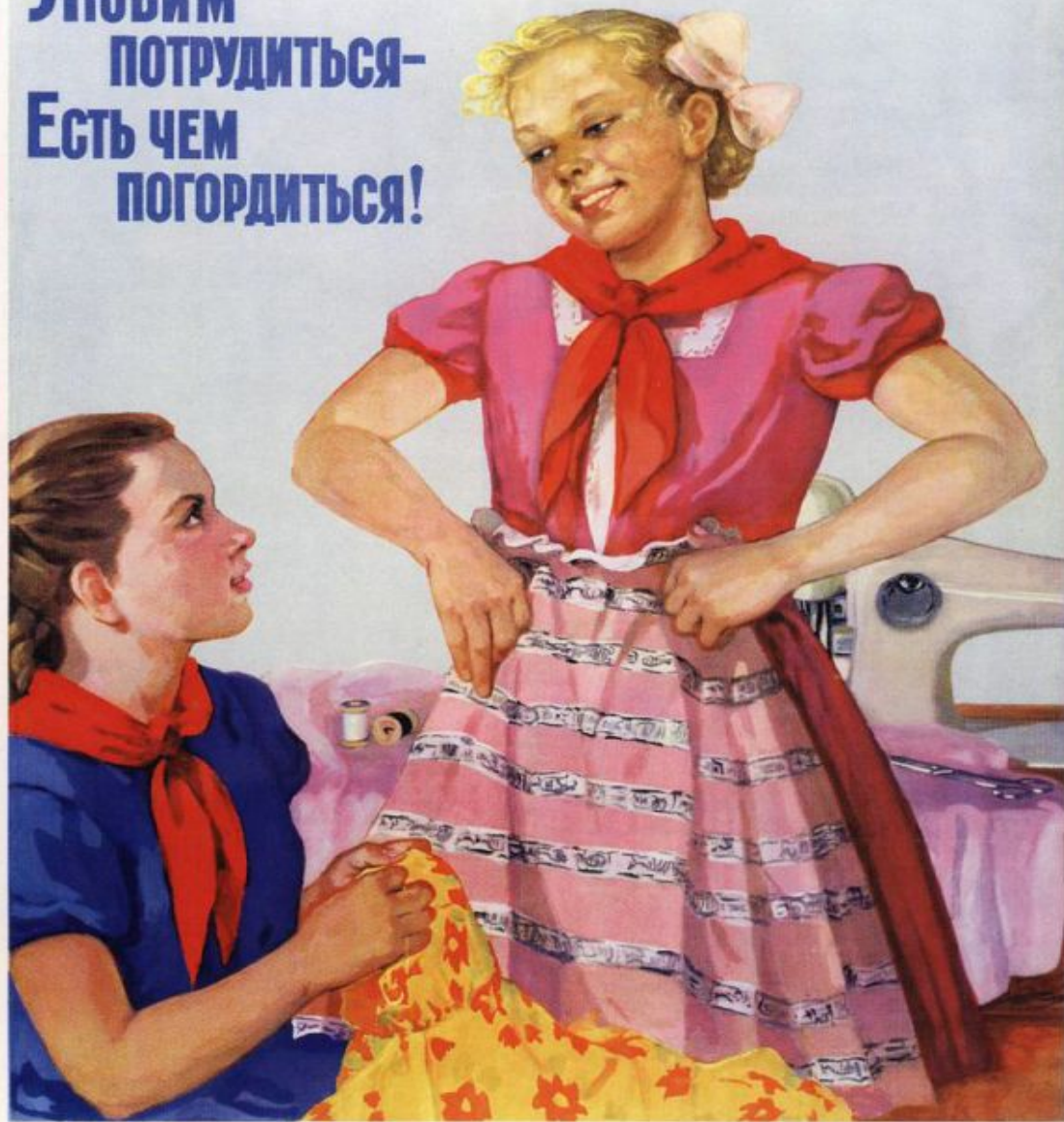
484. Маризе—Краснокутская М. Любим потрудиться — есть чем погордиться! 1960

Любим потрудиться— Есть чем погордиться!