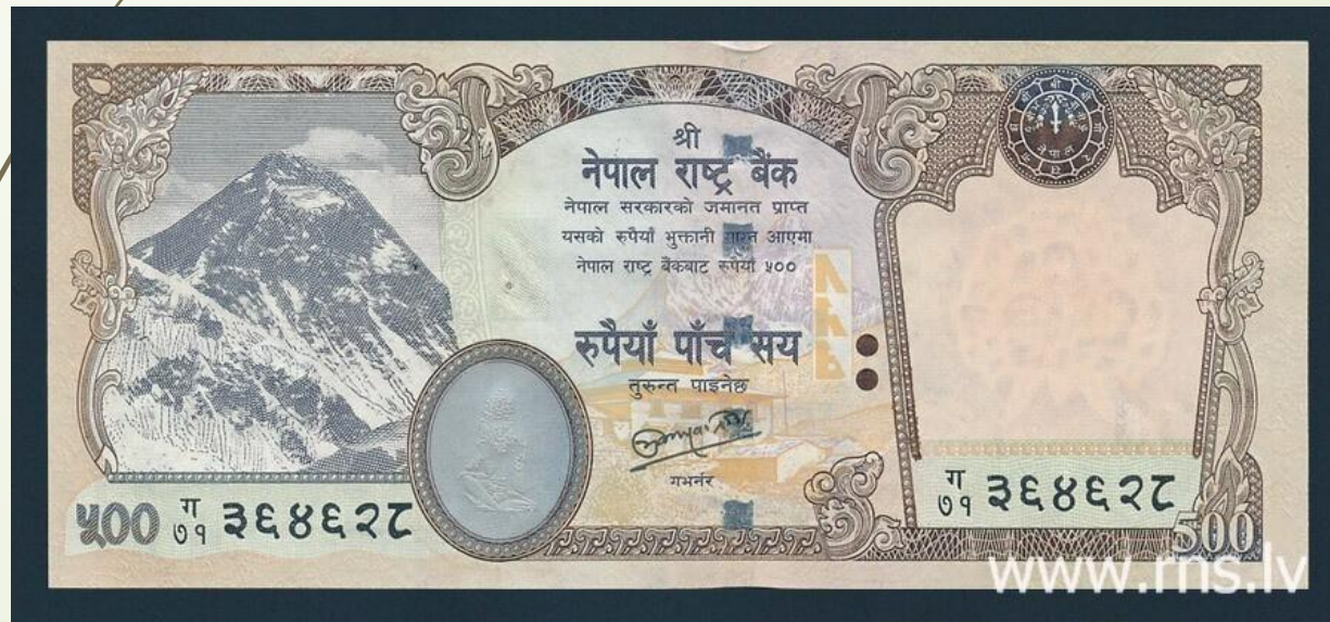
Nepal, 500 Rupees 2011.