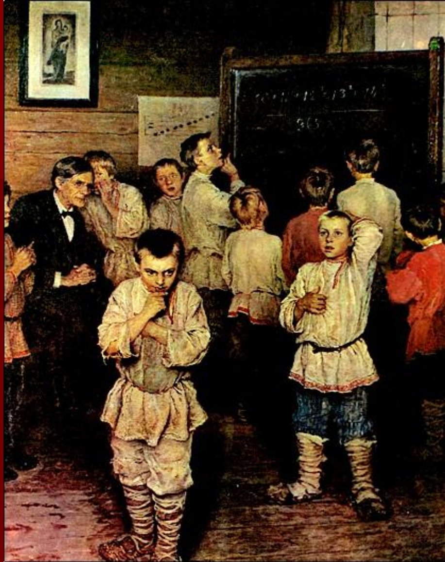
Н.П.Богданов – Бельский «Устный счёт»