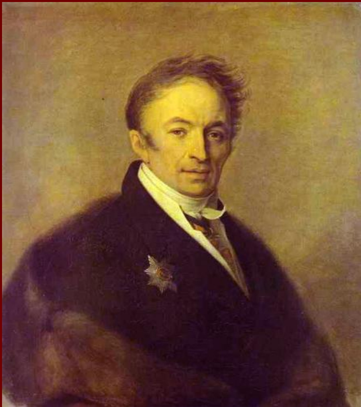
Русский писатель и историк Николай Михайлович Карамзин

«История ума представляет две главные эпохи: изобретение букв и типографии; все другие были их следствием».