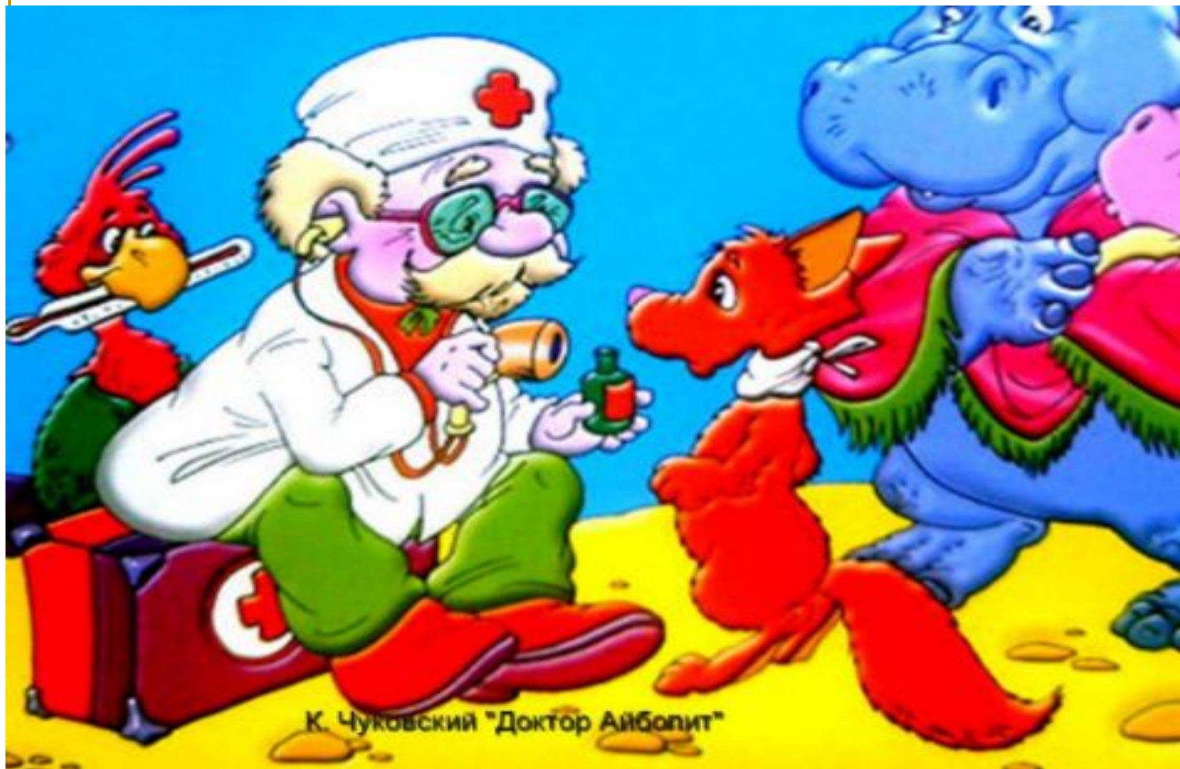
К. Чуковский "Доктор Айболит"