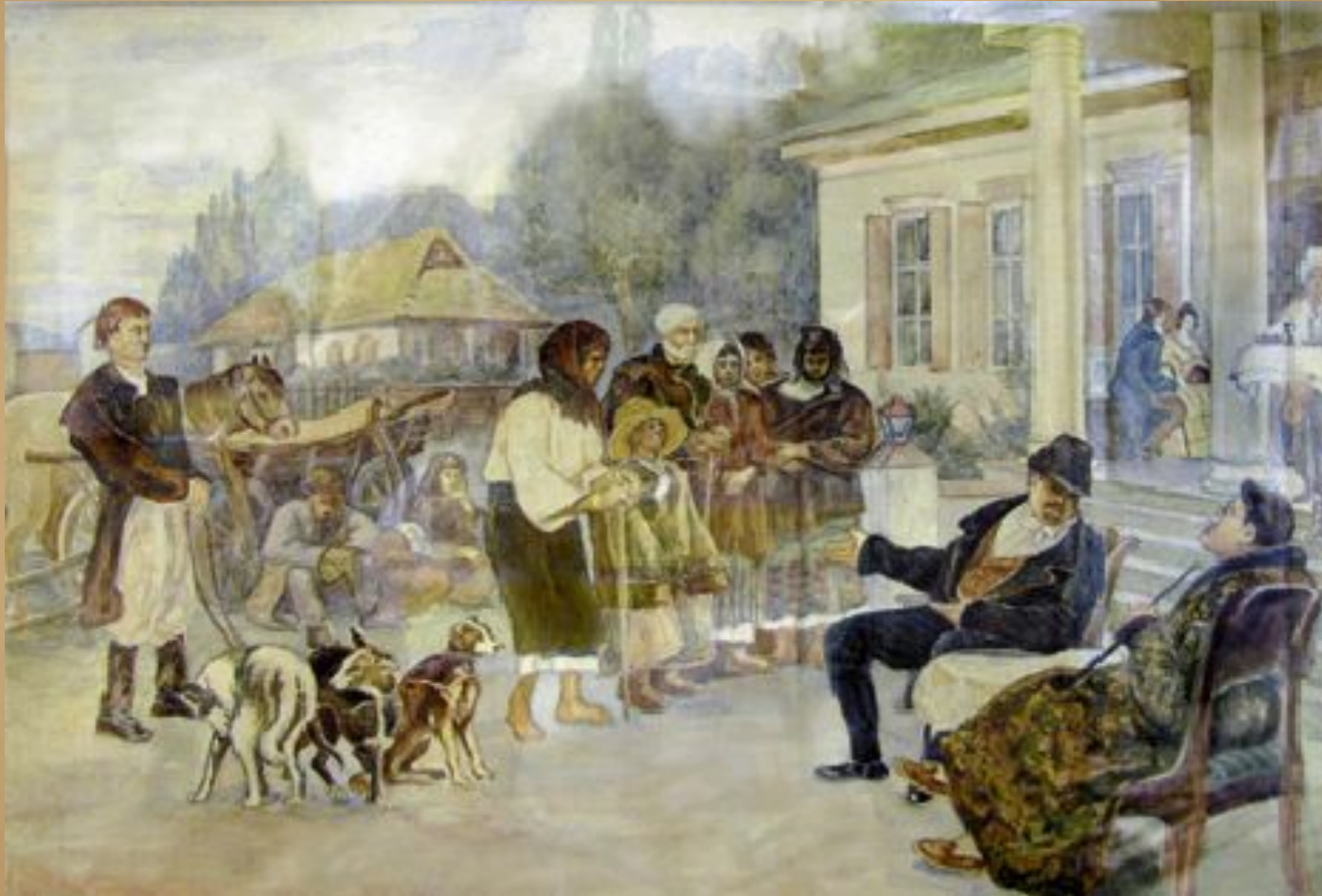
Кріпаків міняють на собак. Картина І. Їжакевича.

Роздивіться картини українських художників, на яких зображено буденні сцени із життя українського села наприкінці 18 - на початку 19 ст., дайте відповіді на запитання.