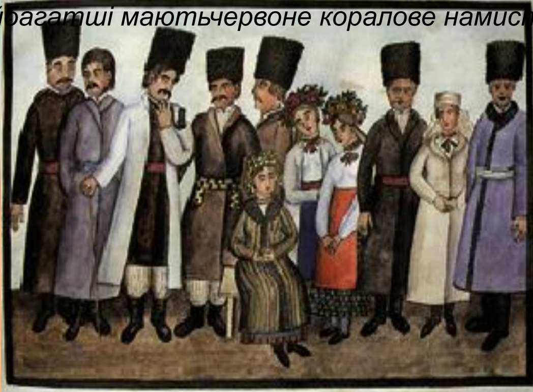
Селяни Київщини на малюнках де ла Фліза.

«...Жінки й дівчата звичайно носять довгі свитки. Спідниці та фартухи шують з барвистого, у великі квіти полотна або з блакитної чи червоної матерії, яку селяни виготовляють фарбують самі. На околицях Києва жінки та дівчата носять сорочки з тонкого полотна з довгими й широкими рукавами, прикрашені майстерно вишитими червоними узорами. Чоботи жінки і дівчата носять майже завжди, особливо у святкові дні. Головний убір жінок дуже різний. Дівчата, як і жінки, носять на шиї багато разків намиста, найбагатші мають червоне коралове намисто».