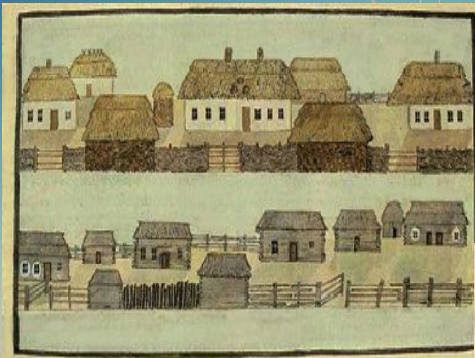
Зразки селянських жител. З книжки де ла Фліза