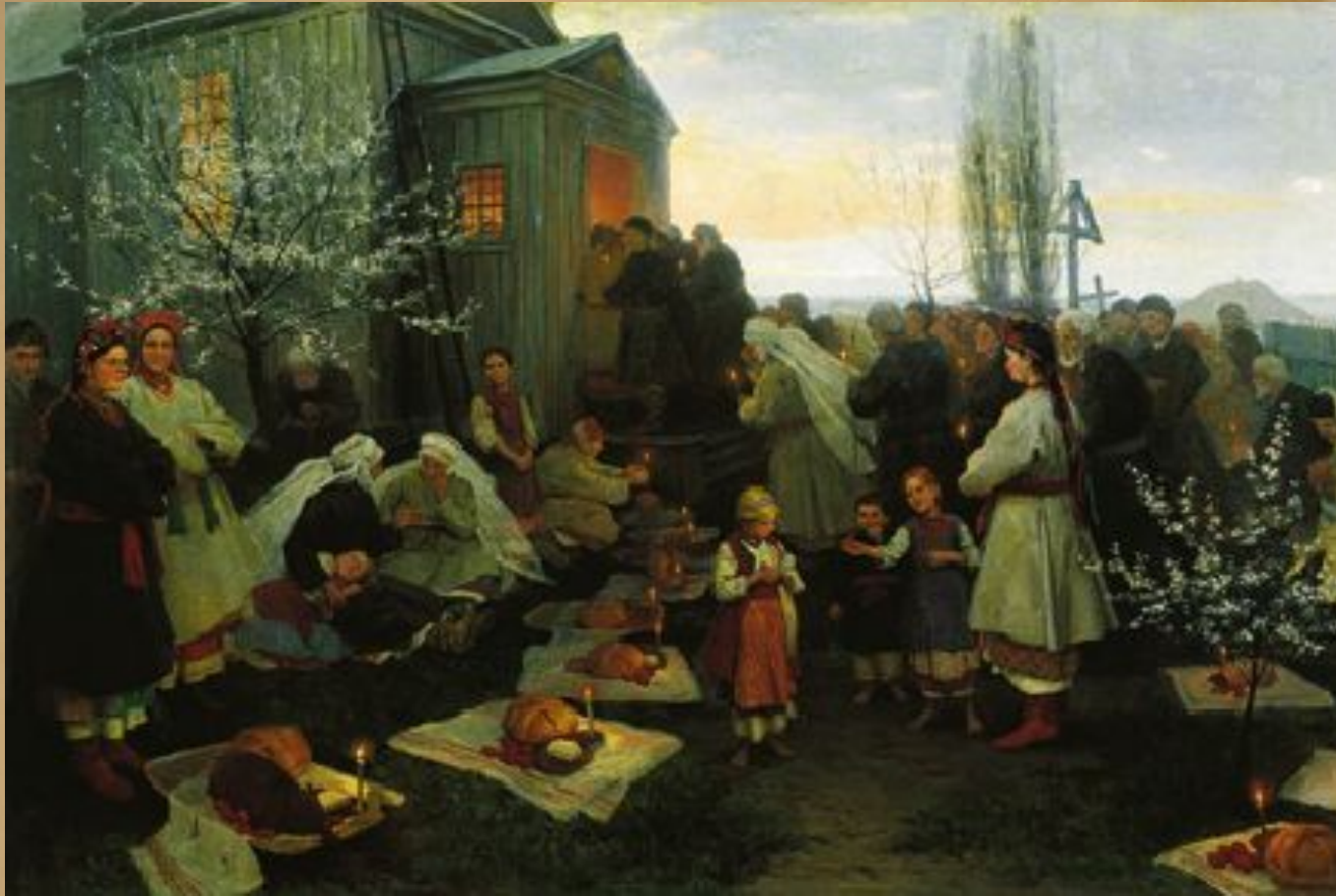
Великодня утрень. Картина М. Пимоненка.

Які обставини життя українських селян засвідчують картини? Доберіть 5-7 прикметників, доречних у розповіді про українське село в зазначений період. Обґрунтуйте доречність кожного дібраного слова.