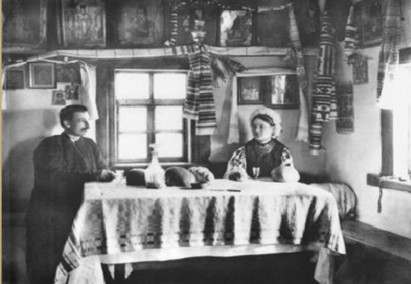
Парубок та дівчина за столом у сільській хаті. 1903 р.

(Мотиваційний момент). Роздивіться фотографію. Розкажіть про опорядження сільської хати. Що відрізняє її від сучасного помешкання, а чим вона подібна до нього? Чому нині хатнє начиння здебільшого втратило традиційні національні риси?