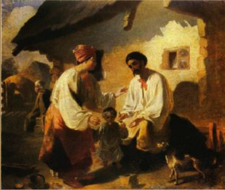
Селянська родина. Картина Т. Шевченка

Про те, яким був побут українських селян, якими клопотами вони переймалися, якими були звичаї українського села, довідуємося з творів І. Котляревського, Г. Квітки-Основ'яненка, Т. Шевченка, М. Гоголя. У другій половині 19 - на початку 20 ст. картини селянського побуту майстерно змальовували Панас Мирний та Іван Нечуй-Левицький, з творами яких познайомитися на уроках української літератури.