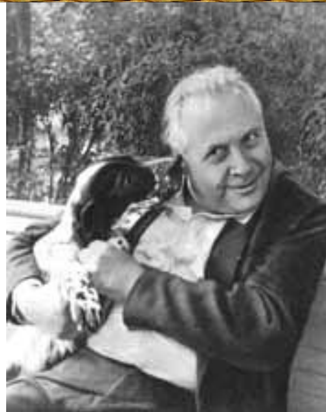
Георгий Алексеевич Скребицкий 1903 - 1964