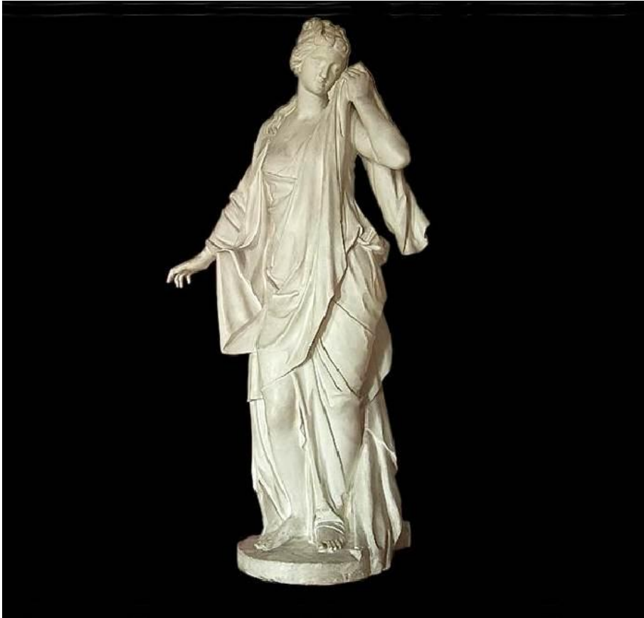
Надгробок І. Гагаріної