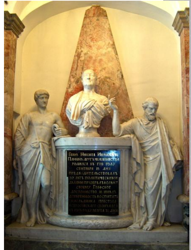
Надгробок Н. І. Паніна