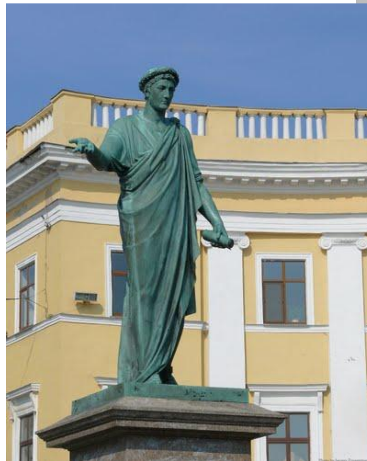
Пам'ятник герцогу де Рішельє в Одесі.