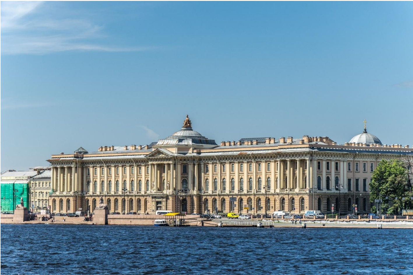
Академія Мистецтв у Петербурзі