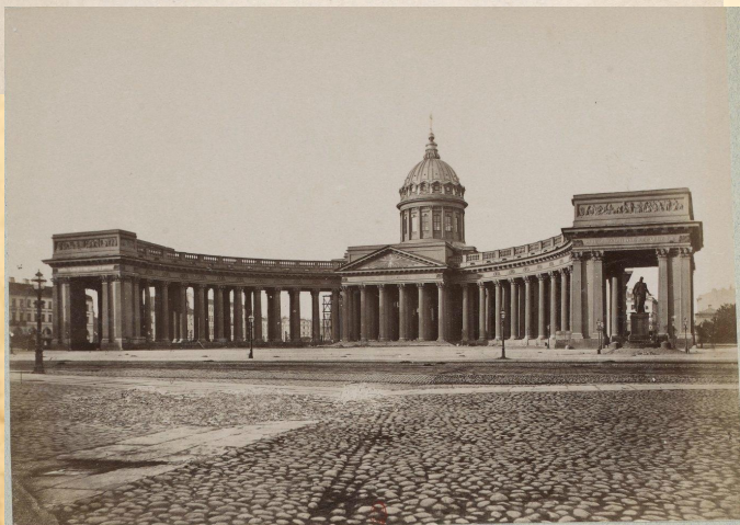
Петербург — Cattedrale de Kazan (sulla Prospettiva Nevsky)