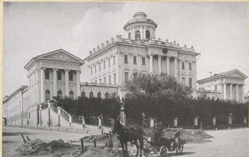
—LE MUSÉE DE ROUMIANTZEW.—