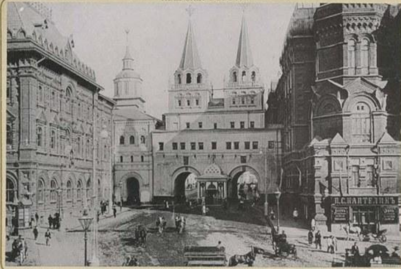
—LA PORTE D'IVERSKY.—