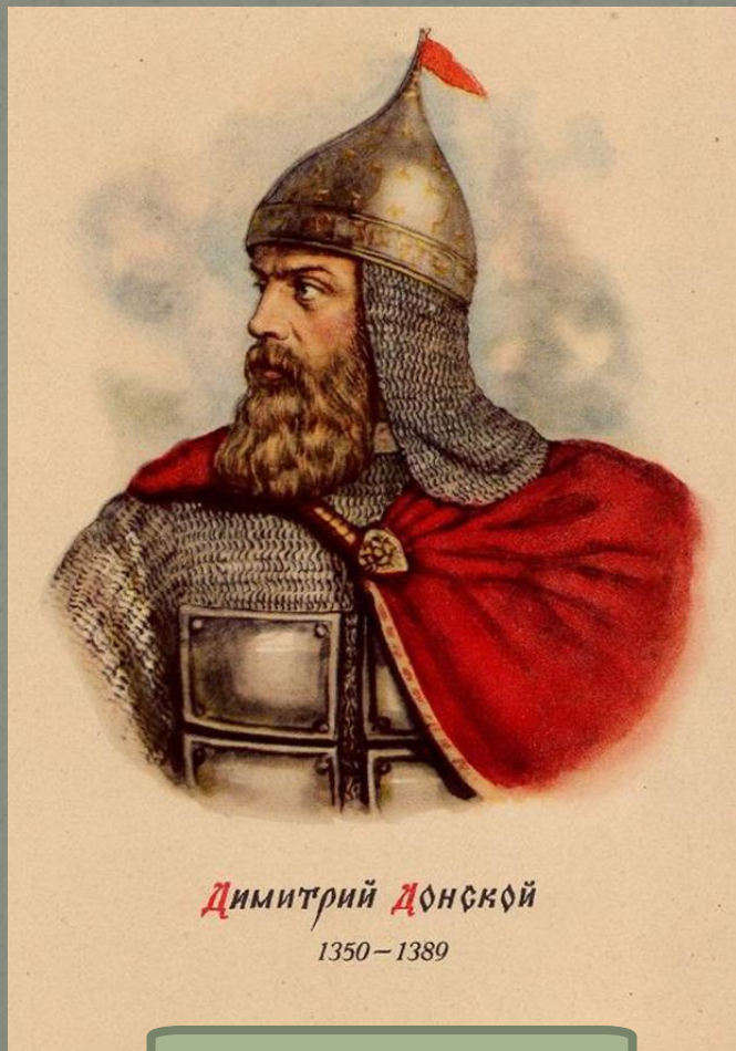
Дмитрий Донской 1350 – 1389