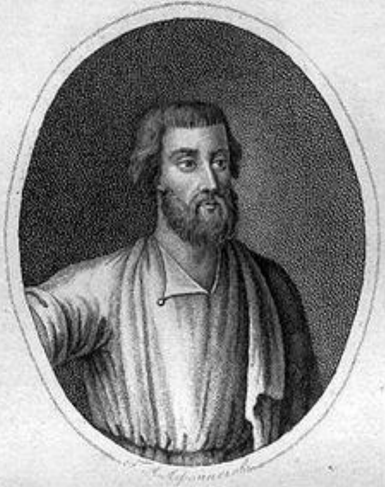
Кузьма Мининъ, Грижданинъ Нижегородскій, потомъ Думный Дворянинъ.

Деяния Минина не были забыты царём. Минин стал думным дворянином. Государь пожаловал ему во владение большую вотчину – село Богородское в Нижегородском уезде. Вплоть до самой смерти Минин пользовался большим доверием Михаила.