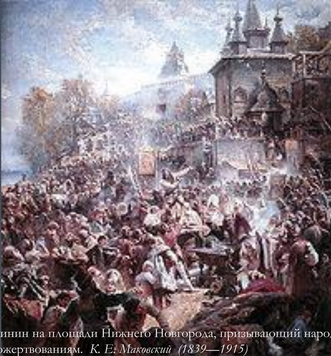
Минин на площади Нижнего Новгорода, призывающий народ к пожертвованиям. К. Е. Маковский (1839—1915)