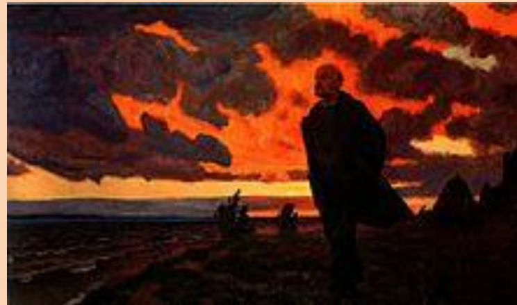
Аркадий Рылов. «Ленин в Разливе в 1917 году»