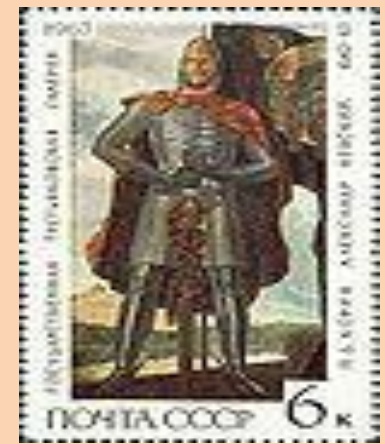
«Александр Невский» кисти Корина