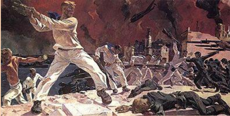
А. Дейнека. «Оборона Севастополя»