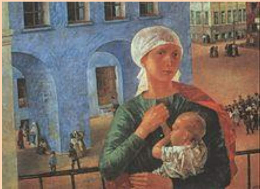
К. Петров-Водкин. «Петроградская мадонна»