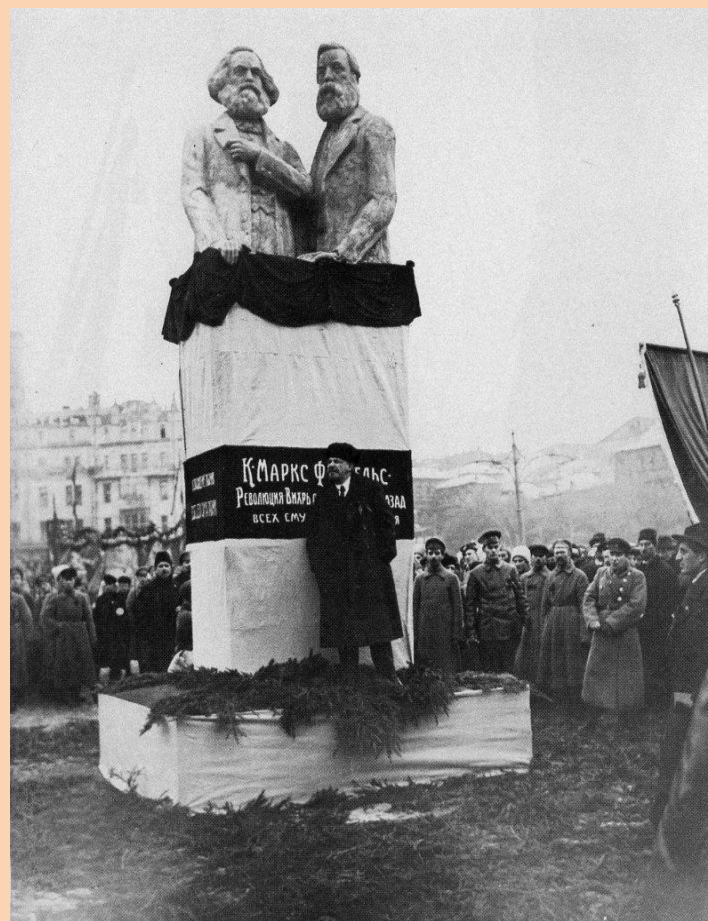
Ленин выступает на открытии памятника Марксу и Энгельсу (ск. С.А. Мезенцев). 7 ноября 1918 года. Москва.