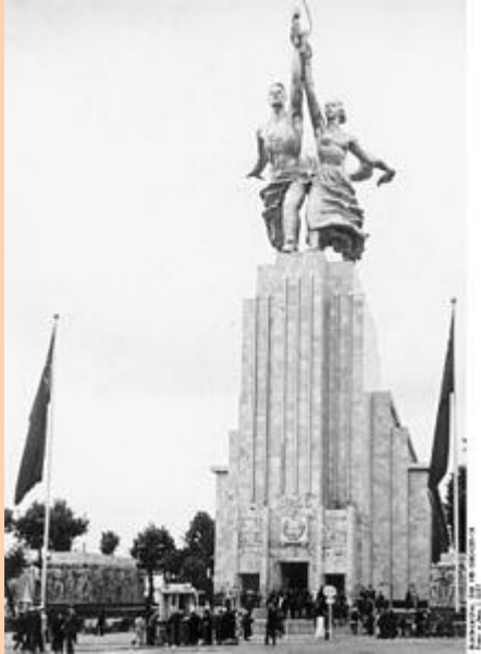
Павильон СССР на Всемирной выставке в Париже 1937 года