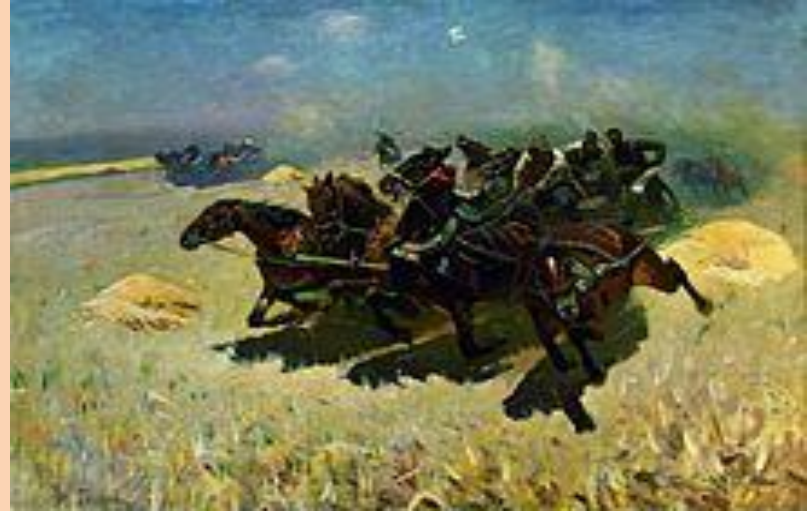
Митрофан Греков. «Тачанка», 1925

Ядро составляли бывшие передвижники, манера которых оказала большое влияние на подход группы — реалистичный бытописательский язык позднего передвижничества, «хождения в народ» и тематические экспозиции.