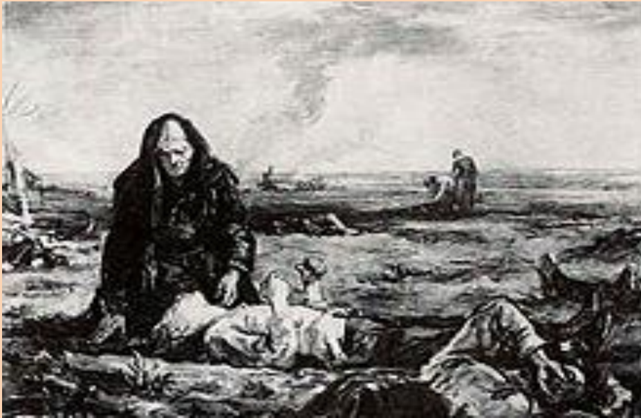
Д. Шмаринов. «Мать»

Графики-станковисты тоже создавали в этот период значительные произведения. Этому способствовала портативность их техники, что отличало их от живописцев с длительным периодом создания произведений. Обострилось восприятие окружающего, поэтому создавалось большое количество взволнованных, трогательных, лирических и драматических образов.