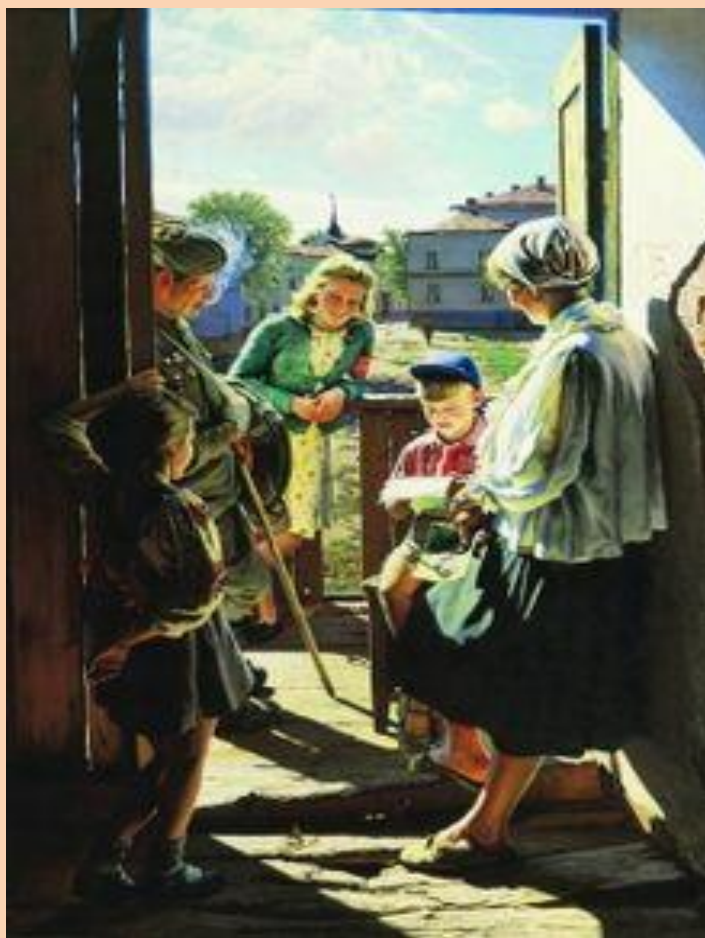
А. Лактионов. «Письмо с фронта»