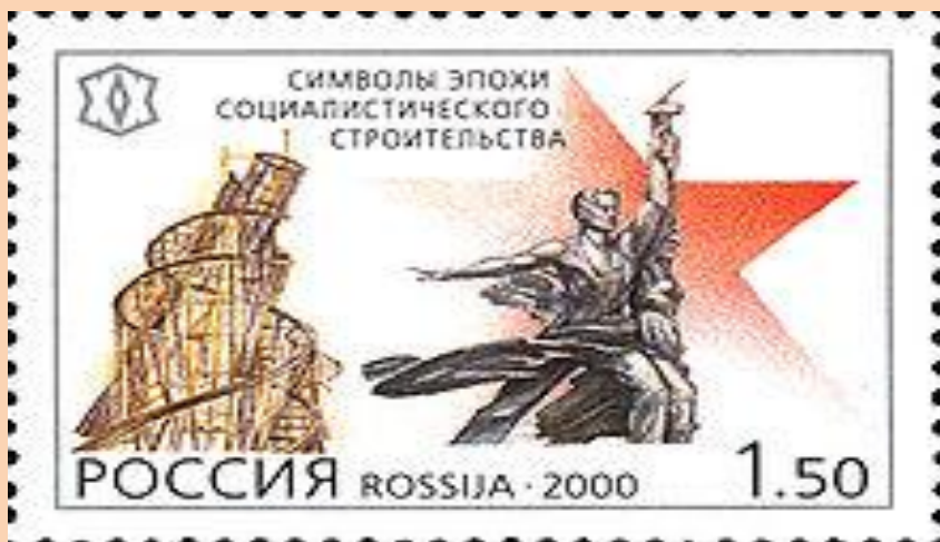
Башня Татлина и более поздняя скульптура «Рабочий и колхозница»

В военный период большинство архитекторов осталось без работы и занималось «бумажной архитектурой». Некоторые сотрудничали со скульпторами, создавая памятники.