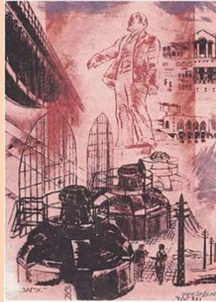
Игнати́й Нивинский. ЗаГЭС. 1927. Цветной офорт, сухая игла.