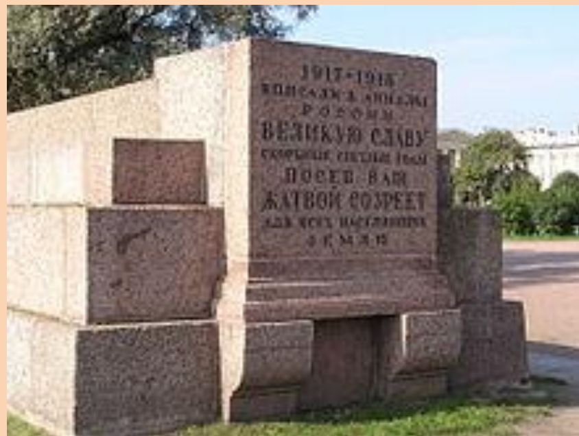
Л. В. Руднев. Памятник на Марсовом поле