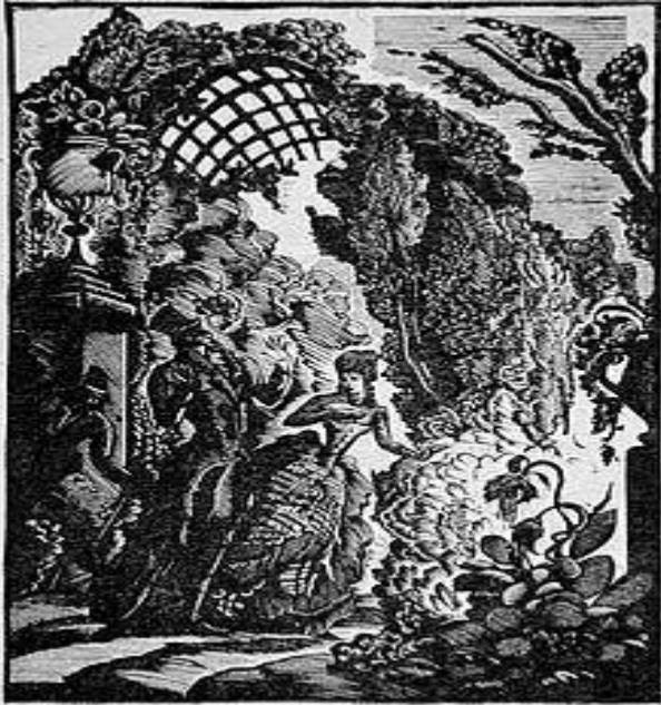
А. Кравченко. Иллюстрация к повести Э. Т. А. Гофмана «Повелитель блох». 1922. Ксилография.

Если графики предыдущего периода выступали как комментаторы произведения, которое иллюстрировали, наглядно толкуя его для зрителей, то иллюстрация двадцатых годов отличается. Её характерные черты: тема — обычно классическая литература (произведения небольшого размера), техника — обычно фотомеханическое воспроизведение перьевого или карандашного рисунка.