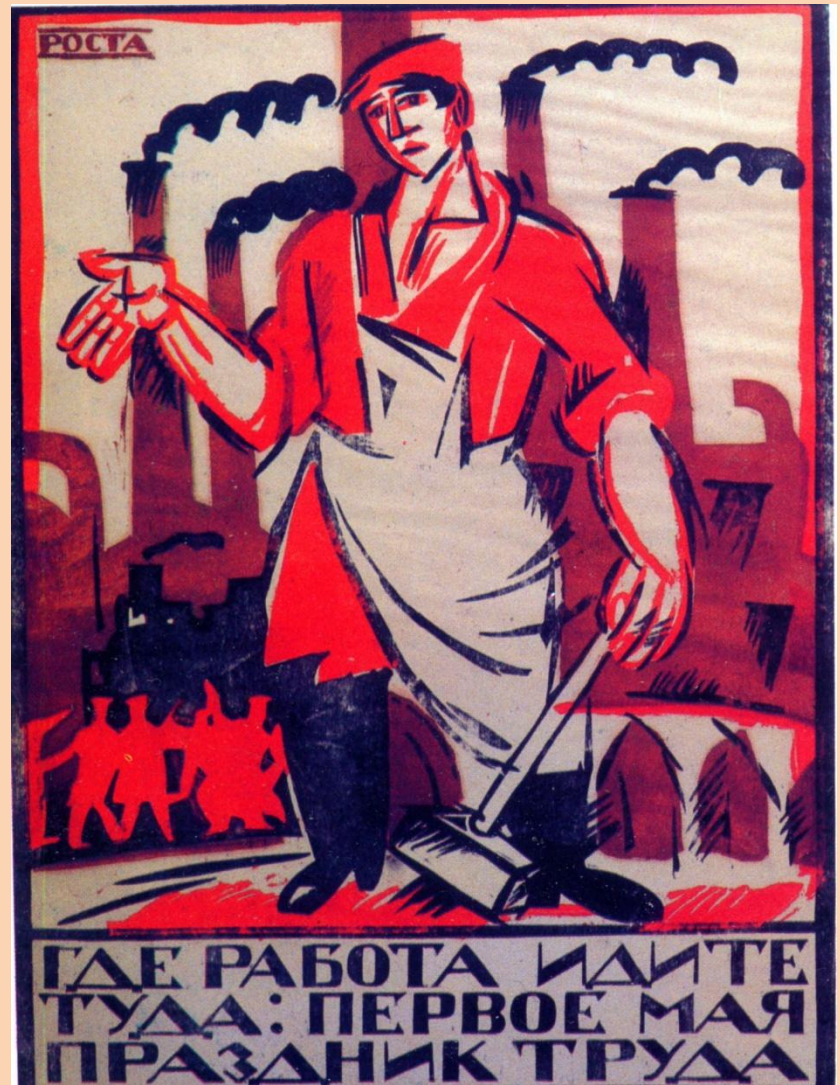
Первомайский плакат И. Малютина, 1920 (Окна РОСТА).