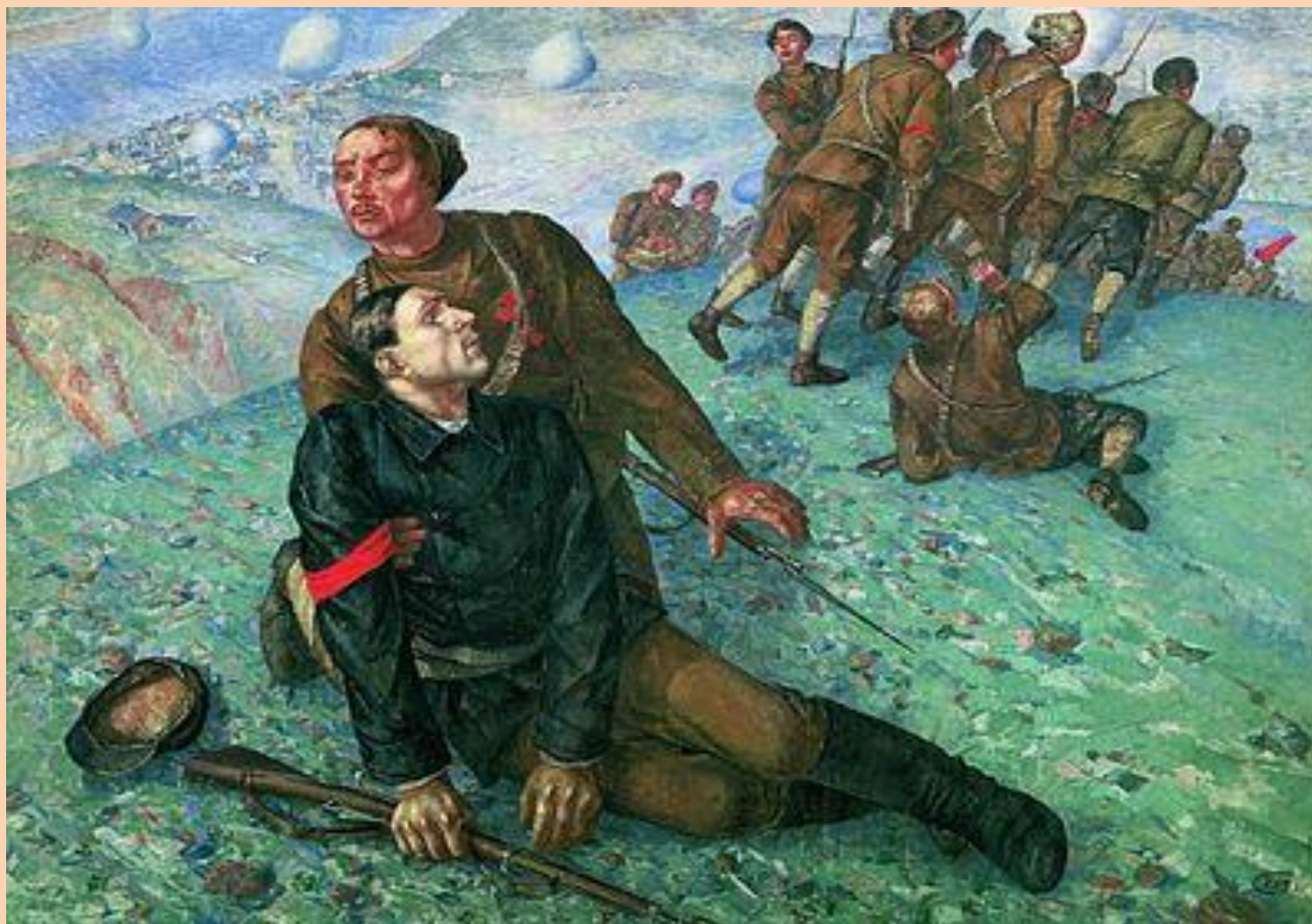
Кузьма Петров-Водкин. «Смерть комиссара», 1928

Советское искусство, изобразительное искусство СССР охватывает период 1917—1991 гг. и включает как официальное, так и неофициальное искусство.