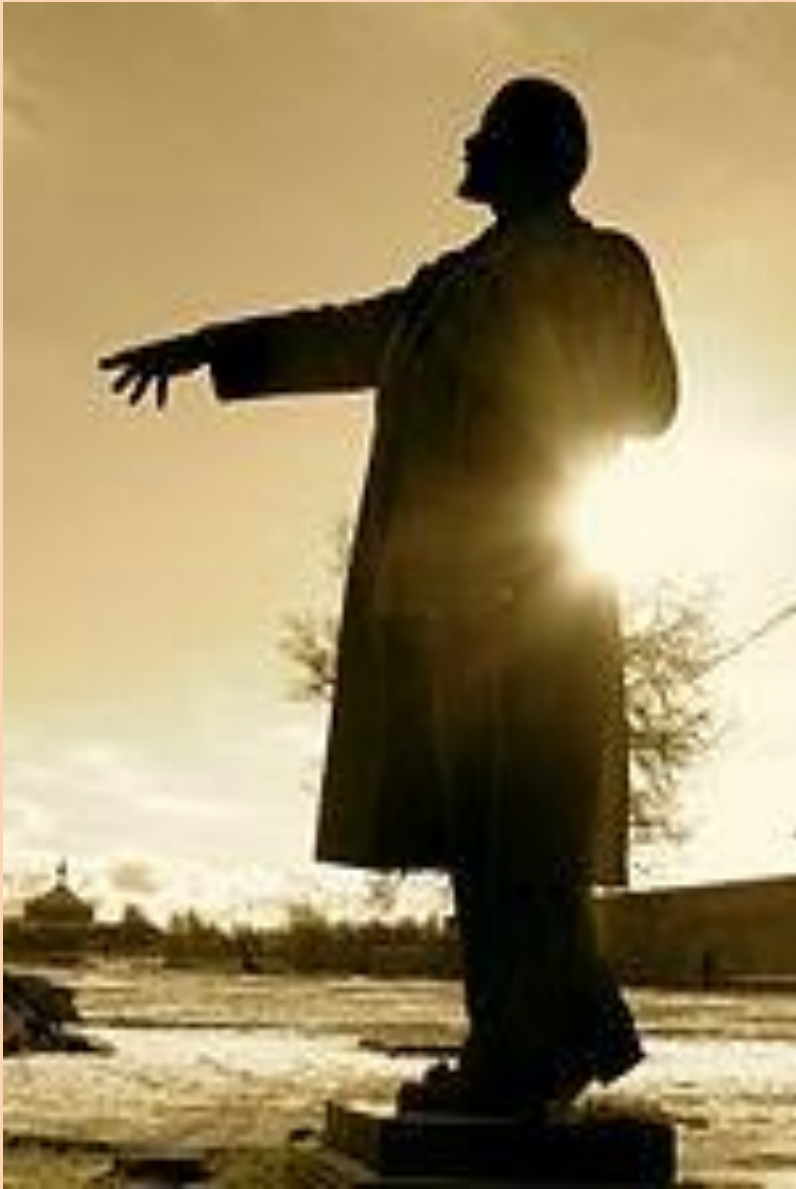
Статуя Ленина в Эстонии