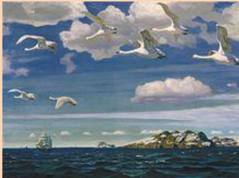
А. Рылов. «В голубом просторе»