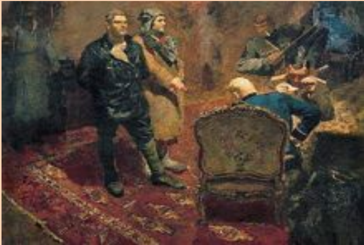
Борис Иогансон. «Допрос коммунистов»

Советская станковая живопись также испытывает упомянутую выше тягу к монументальным значительным формам и образам. Живопись становится все более широкой по сюжету и менее этюдной по манере. «В станковую картину проникает героическая обобщенность ».