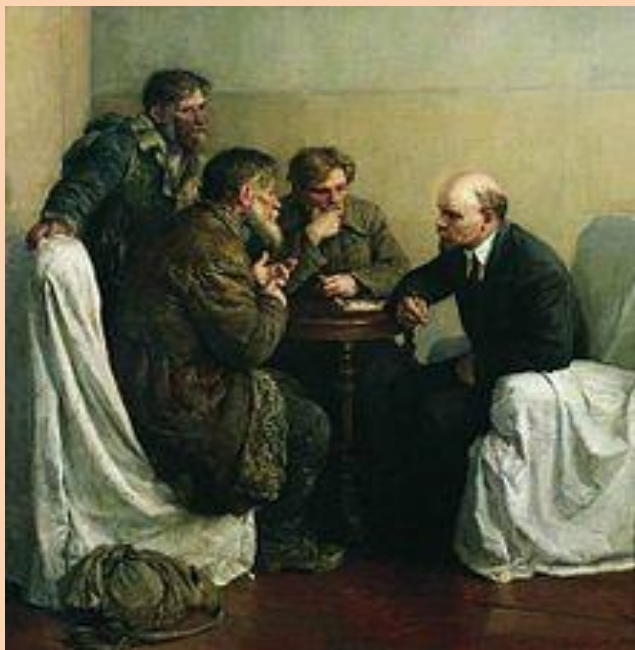
В. А. Серов. «Ходоки у Ленина»

В живописи этих лет широкое распространение получил исторический , « историко-революционный » жанр