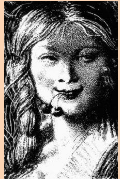
«Ласточка». Иллюстрация Е. Кибрика к повести Р. Роллана «Кола Брюньон».