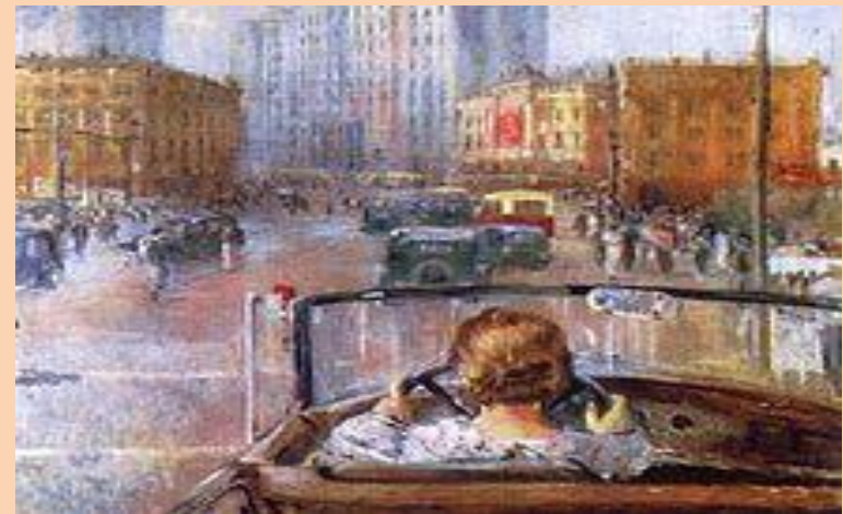
Юрий Пименов. «Новая Москва»