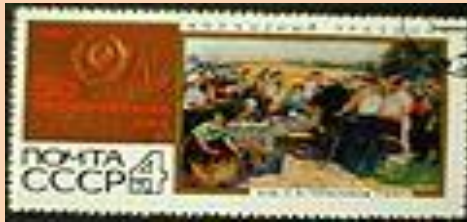
«Колхозный праздник» кисти Герасимова