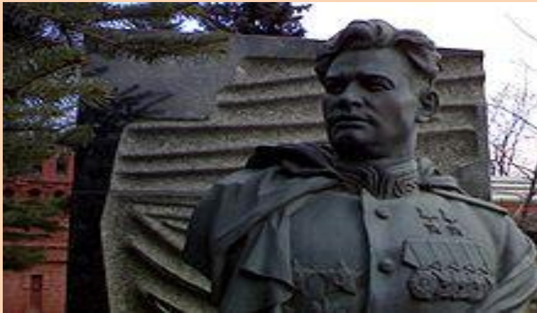
Е. Вучетич. «Портрет И. Д. Черняховского» (копия, установленная на надгробии героя)