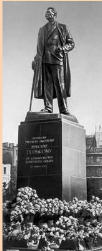
И. Шадр. Памятник Максиму Горькому