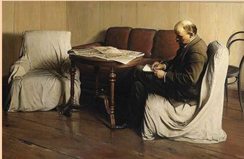
И. И. Бродский, «В. И. Ленин в Смольном в 1917 году», 1930