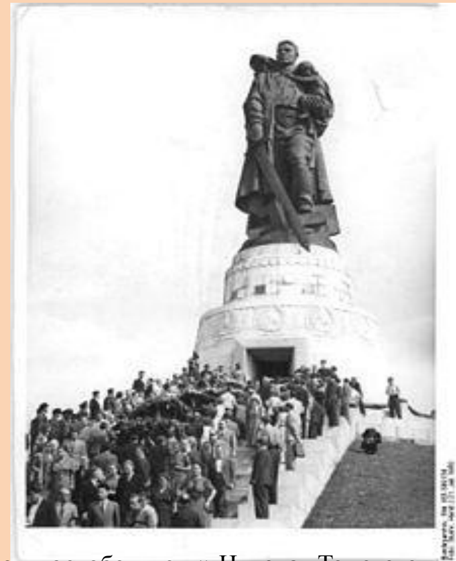
«Воин-освободитель» Николая Томского, архитектор Белопольский