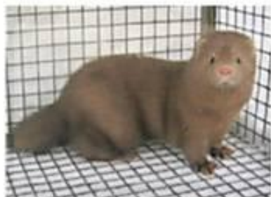
Финский топаз (t'/t' b/b)