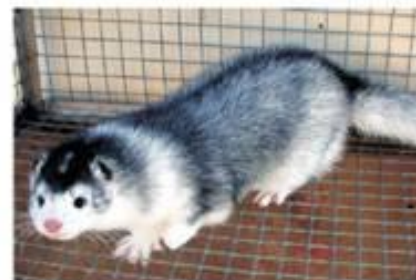
Крестовка стандартная (S/+)