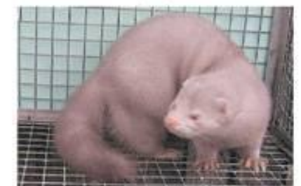
Лавандовая (m/m a/a)