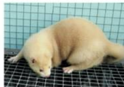
Американское паломино (k/k)