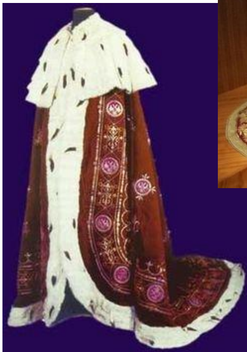
Мантия сербских королев.