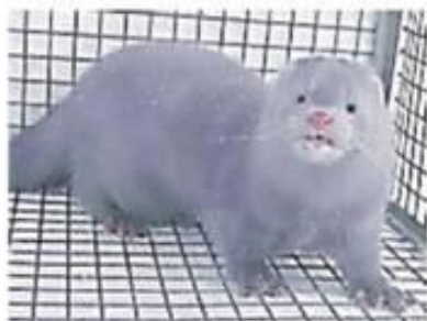
Сапфир (a/a p/p)