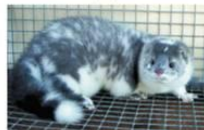
Леопард платиновый (S k /+ p/p)