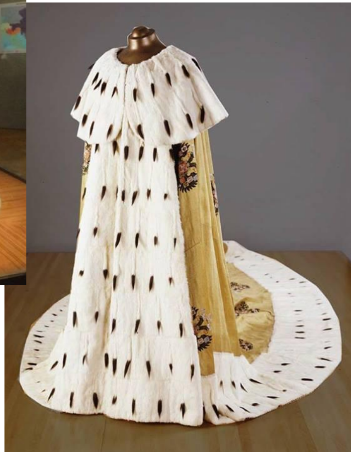
Российская коронационная мантия.