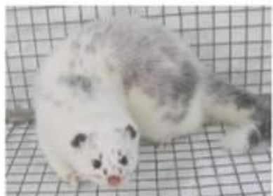
Снежный леопард (S N /+ S k /+ t'/t' b/b)