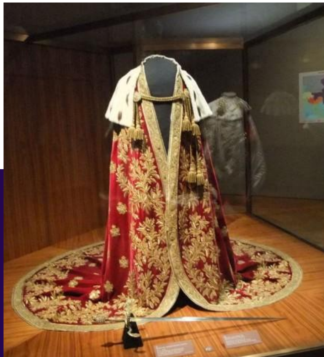
Мантия Австрийской империи

В прошлом мантию из меха горносталя одевали в торжественных случаях короли и цари многих стран.