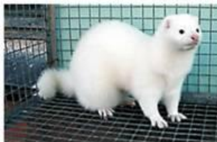
Белая хедлюнд (h/h)