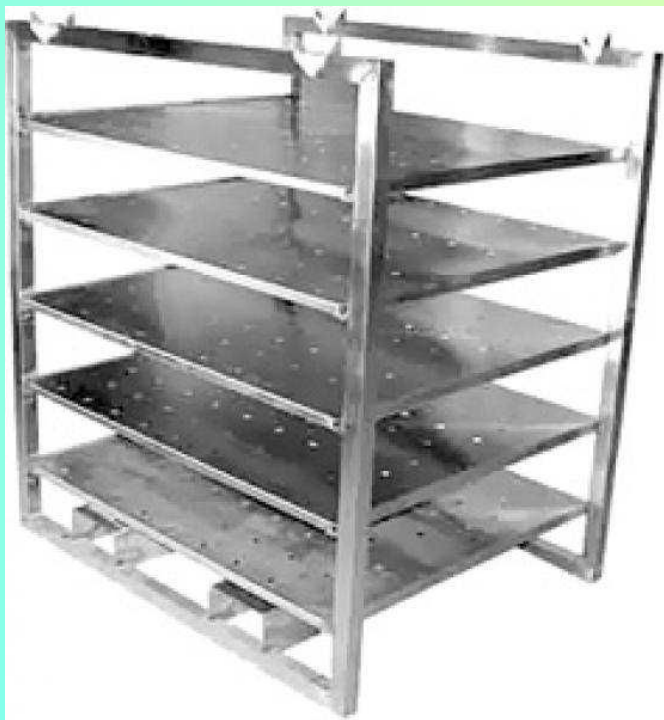
Контейнер, стеллаж для посолки сыра

Сыр солят для придания ему соответствующего вкуса. Посолка влияет также на структуру, консистенцию и качество продукта. Вместе с тем соль регулирует микробиологические и биохимические процессы в сыре.