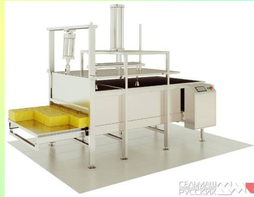
Аппарат формовочный для сыра.