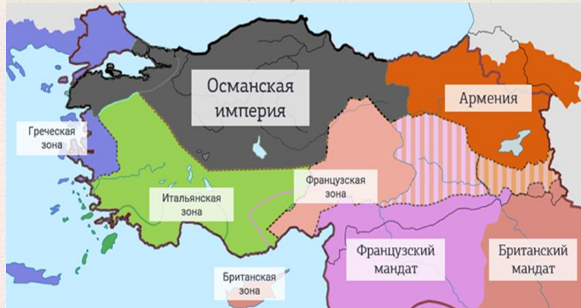
Раздел Османской империи по Севрскому мирному договору

Первой мировой войне был подписан Севрский мирный договор , фиксирующий фактическую ликвидацию Османской империи и предполагавший раздел собственно турецкой территории. В его основу были положены соглашение Сайкса-Пико 1916г. и решения конференции в Сан-Ремо 1920г.