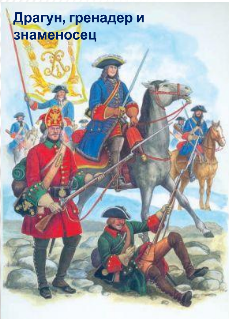
Драгун, гренадер и знаменосец