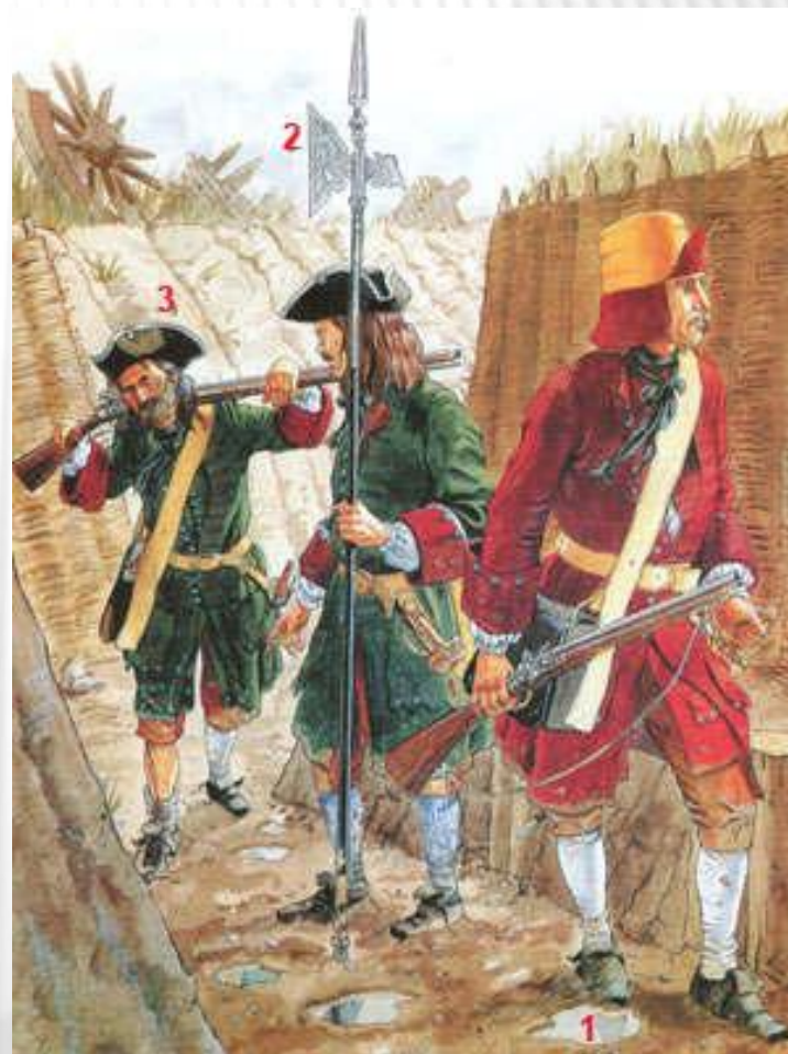
1 - фузилер Бутырского полка 2 - унтер-офицер Ингерманландского полка 3 - фузилер Псковского полка