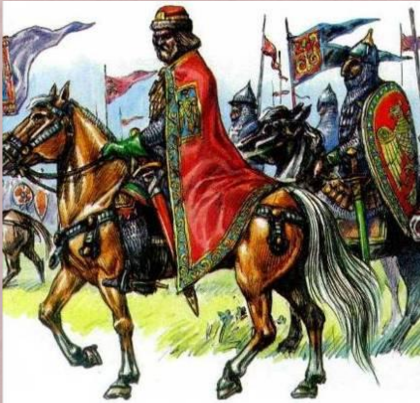
Князь с дружиной