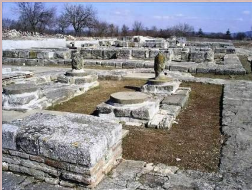
Развалины болгарского города Плиска

С севера на Болгарию и Византию совершала набеги венгерская конница, а затем полтора столетия — кочевники-печенеги , оттесненные в Северное Причерноморье из глубин Азии.