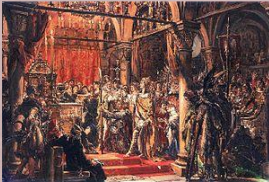
Коронация Болеслава I Храброго

Болеслав ходил походом на Киев, пытаясь посадить на престол своего зятя, но безуспешно. На западе он вел долгие войны со Священной Римской империей. Незадолго до смерти Болеслав был провозглашен королем Польши.