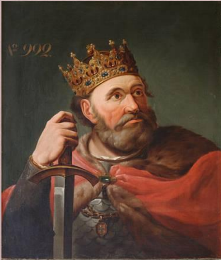
Болеслав I Храбрый

Объединение Польши завершилось в годы правления Болеслава I Храброго (992—1025). Ему удалось присоединить южные польские земли. В город Краков — крупный торговый центр на пути из Киева в Прагу — была перенесена столица Польши. Болеславу I на время удалось захватить Чехию с Прагой, но вскоре Чехия освободилась от его власти