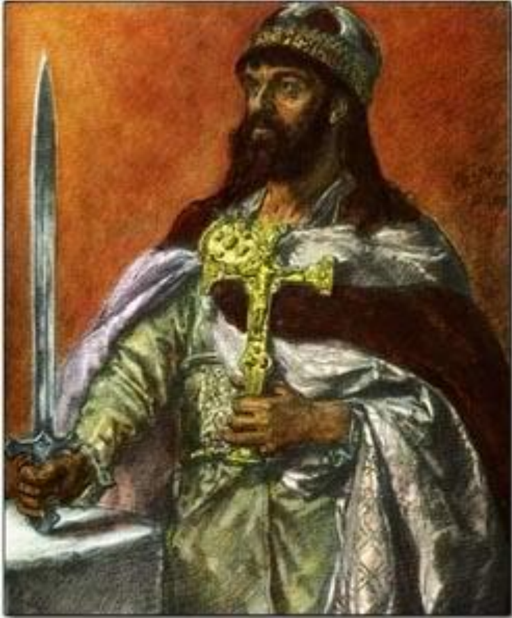
Князь Мешко I

Во второй половине X века польский князь Мешко I (960—992) подчинил себе племена, обосновавшиеся вдоль реки Вислы . Вместе с 3-тысячной дружиной он принял христианскую веру и этим очень укрепил свою власть. Он положил начало Польскому государству . Ведя борьбу за объединение польских земель, Мешко заключил союз со Священной Римской империей против полабских славян, но временами поддерживал германских феодалов против императора.