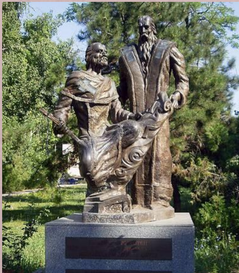
Памятник Кириллу и Мефодию Одесса

После смерти братьев немецкое духовенство начало гонения на их учеников. Некоторые ученики нашли приют в Болгарии. Здесь они продолжали переводить греческие религиозные книги, способствовали подъему болгарской литературы.