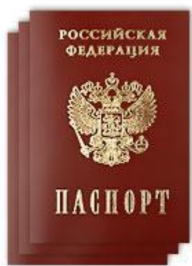
Данные паспорта учредителей и директора