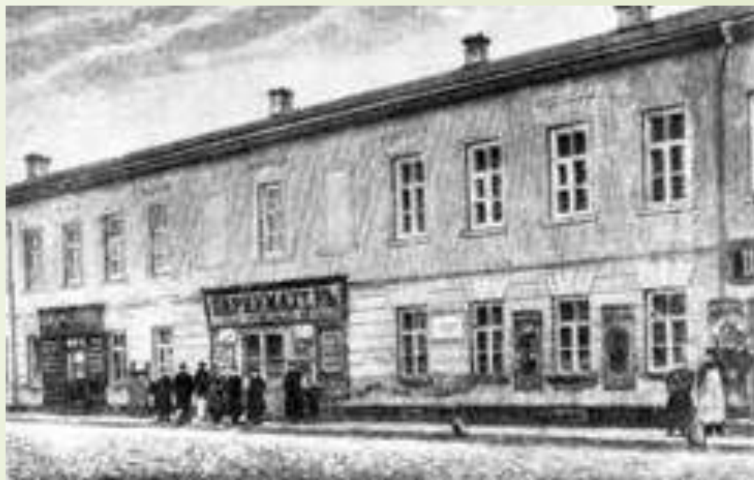
Дом на Немецкой улице в Москве, где родился А. С.Пушкин. С фотографии конца XIX века