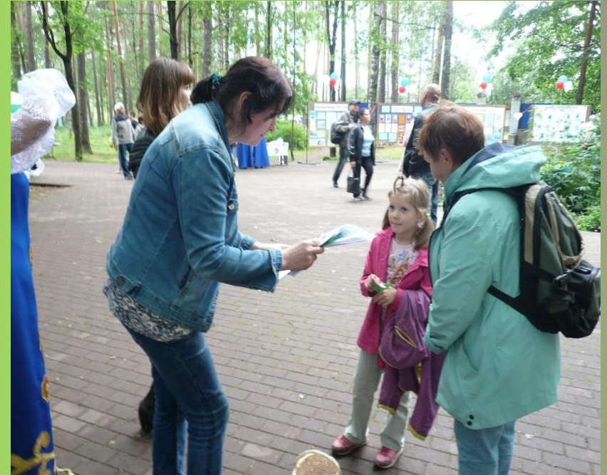
Игровая площадка для детей. День поселка.