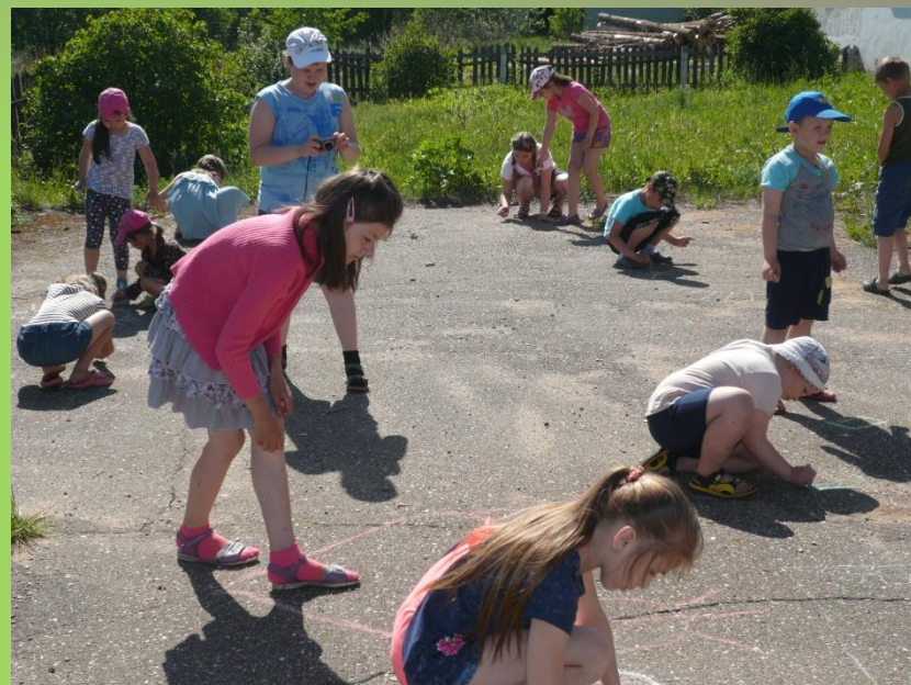
«Здравствуй, лето!». Конкурс