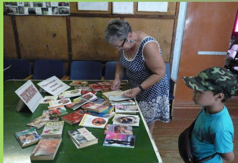
«Прочитал – отдай»