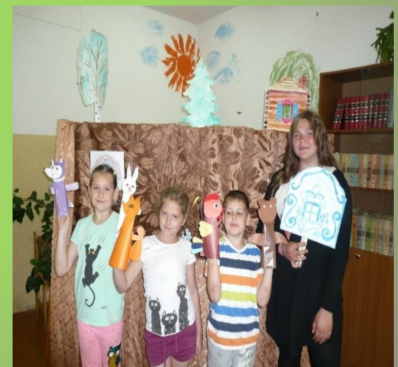
«Заюшкина избушка». Кукольный спектакль