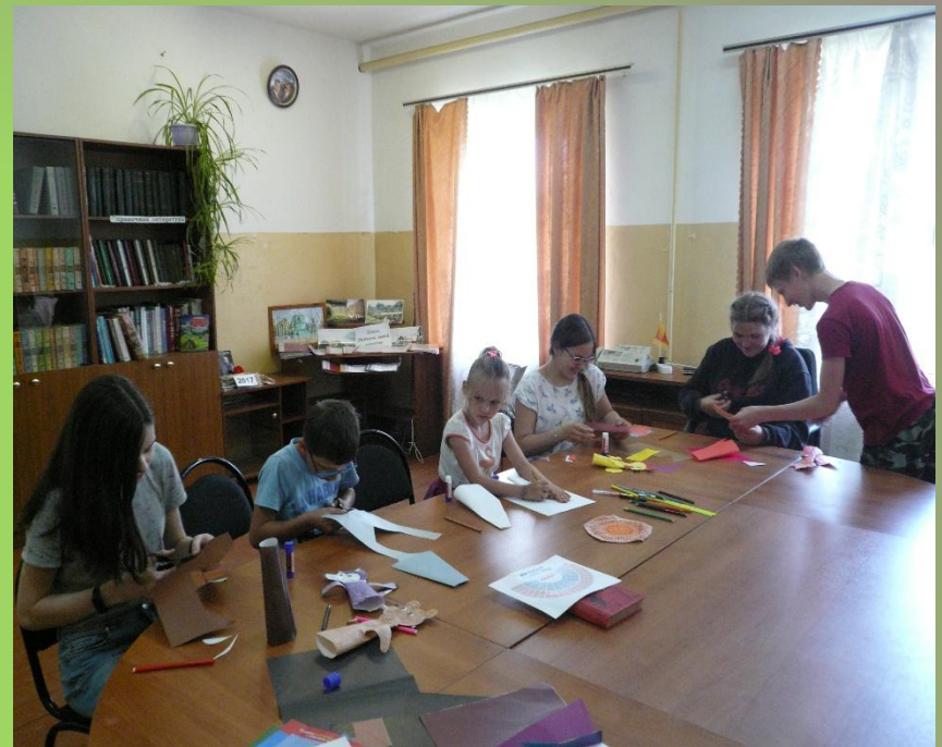
«Фигурки для кукольного театра». Мастер-