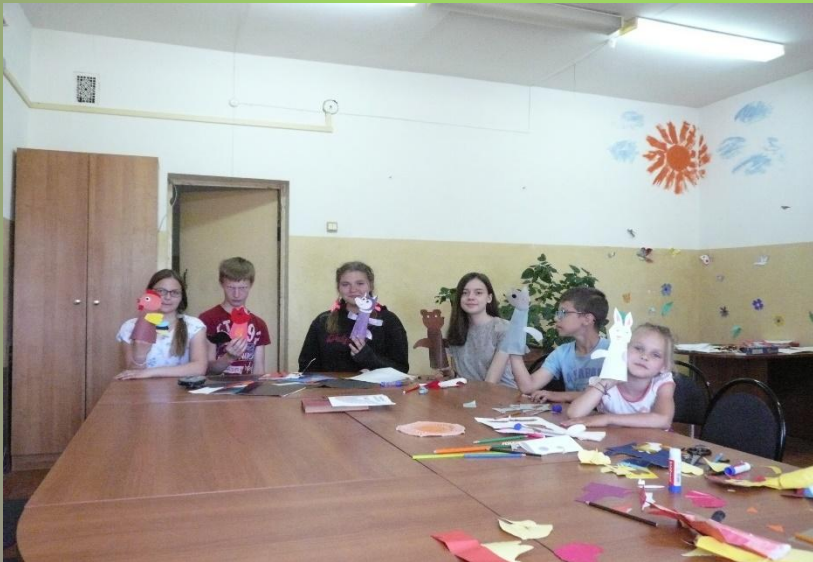
«Фигурки из бумаги для кукольного