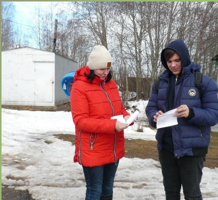
«Стихи в кармане».