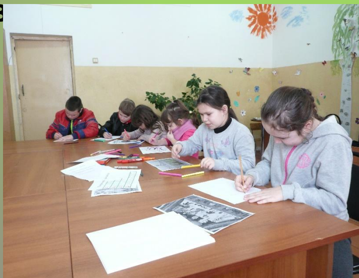
«Театр глазами детей». Конкурс