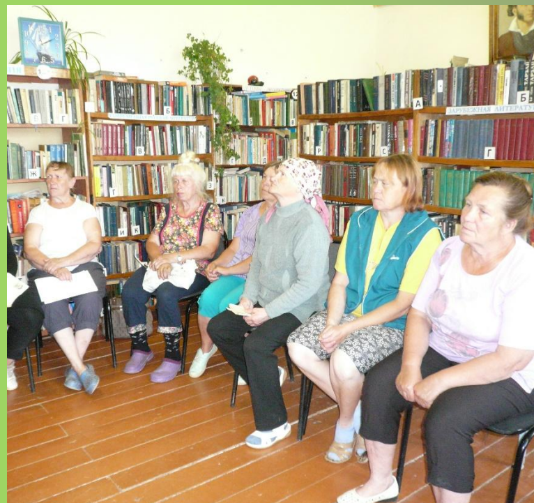
«Писатели родного края». Обзор.