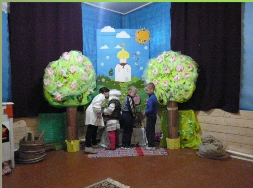
Свет Рождественской звезды».