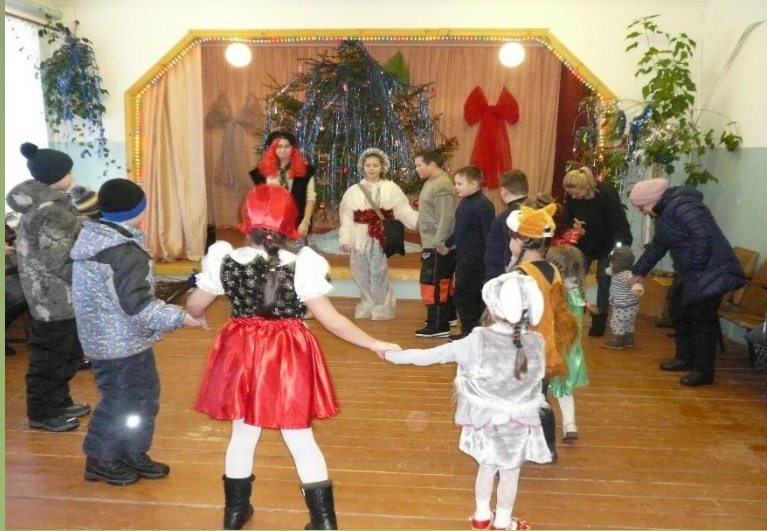
«Всех в хоровод зовет Новый год». Президиум