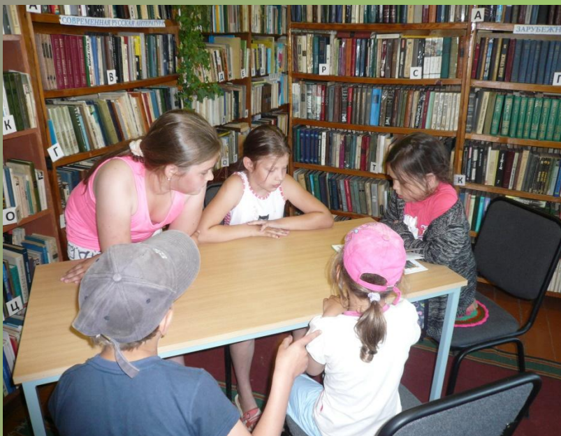
«Говорящая книга». Громкие