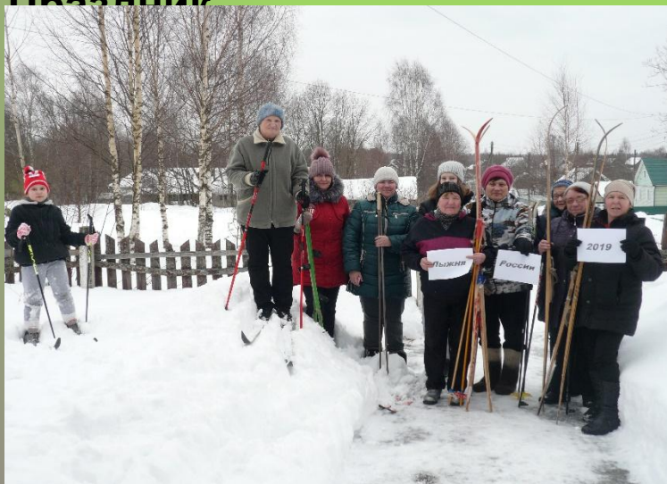
«Лыжня России». Акция.