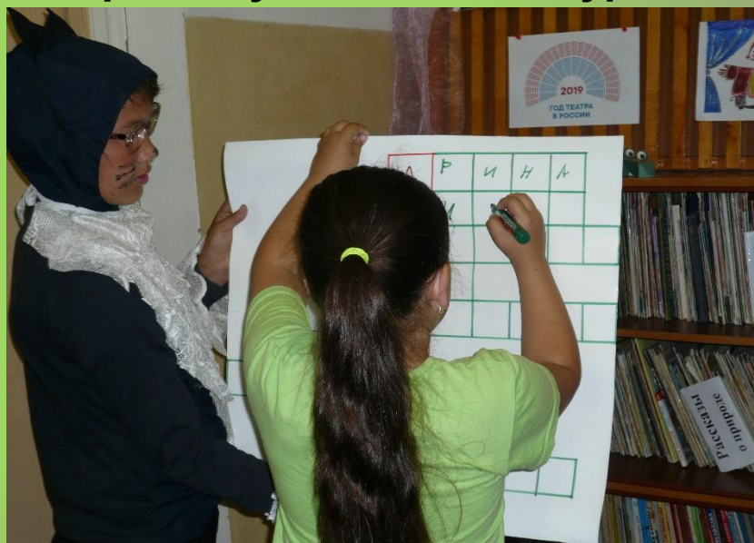
«У Лукоморья». Игровая программа