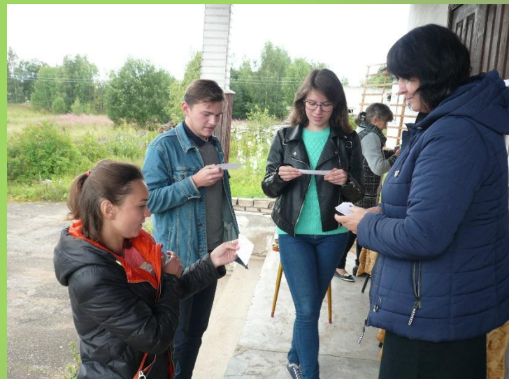
«Литературный серпантин». Блиц-викторина.