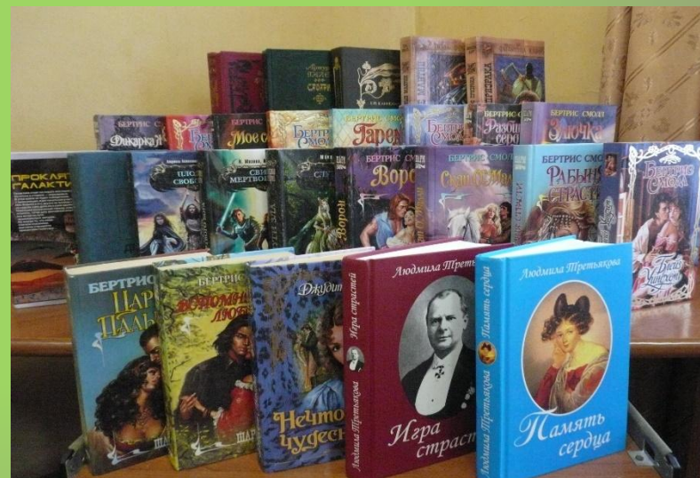
«Дарите книги с