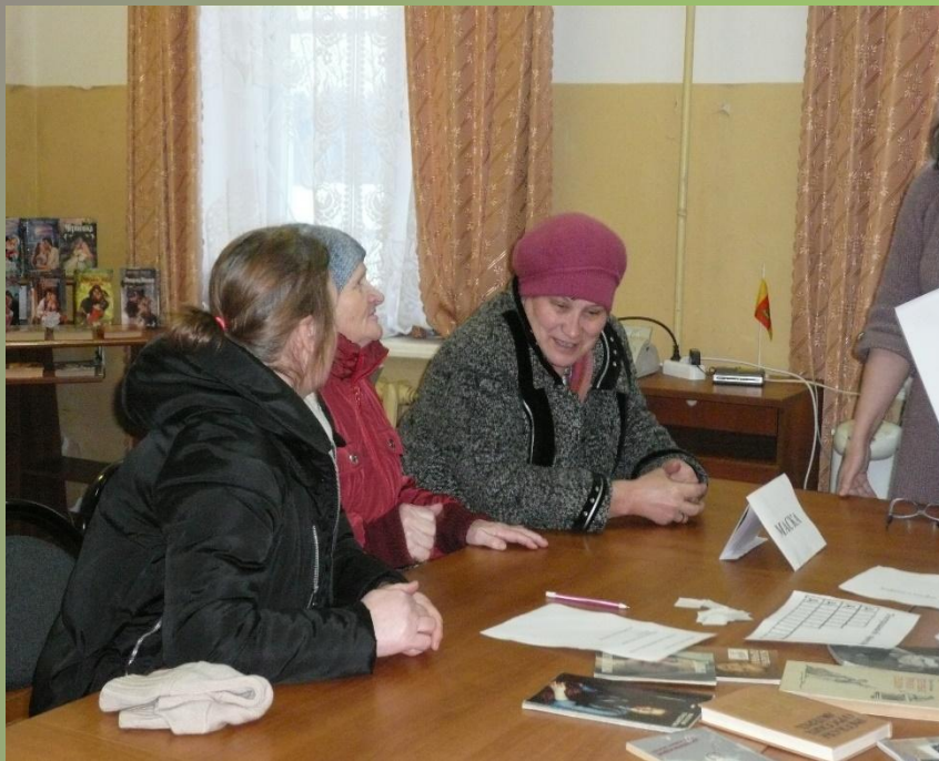
Знатоки театра». Командная