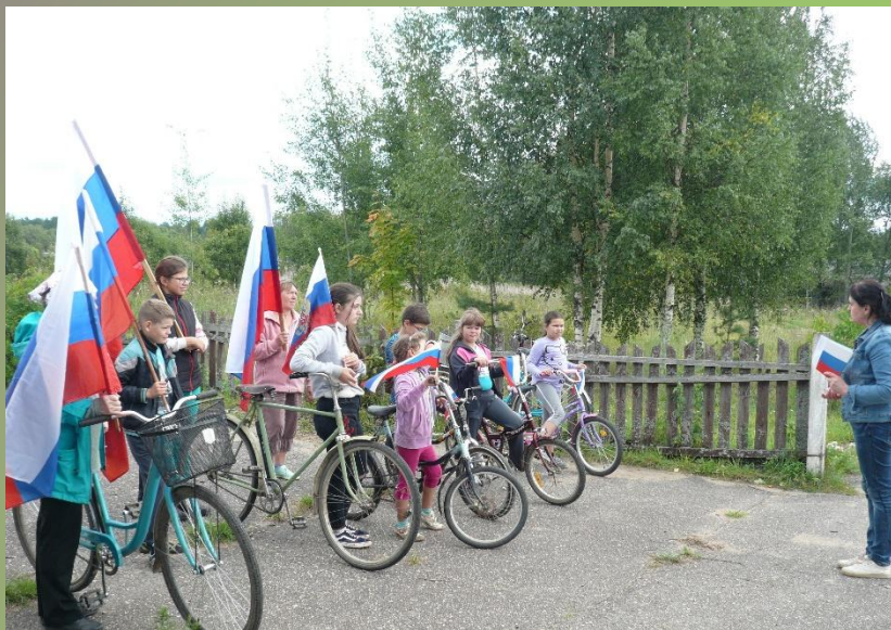
«Гордо реет триколор».