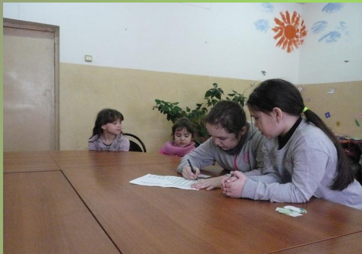
«Его Величество Театр».