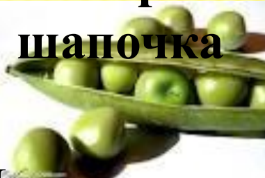
Принцесса на Горошине