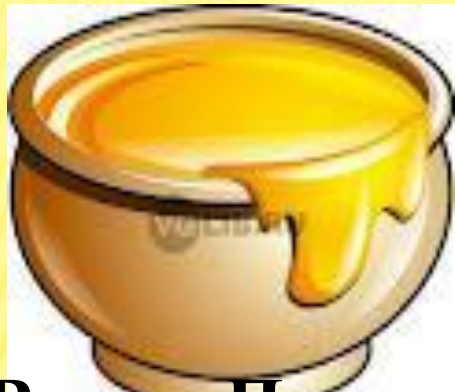
□ Винни Пух