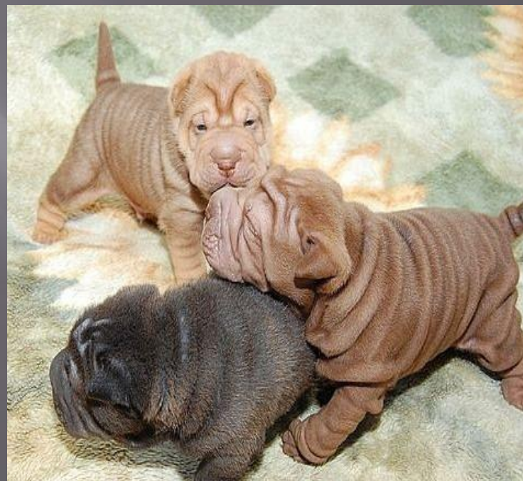
Ронис с братиками