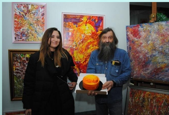
уроки с приглашенными специалистами