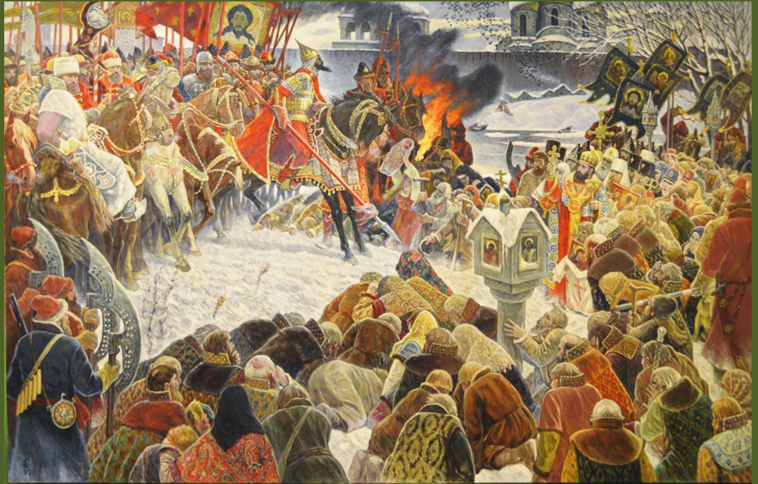
«Опричнина». Картина Ореста Бетехтина