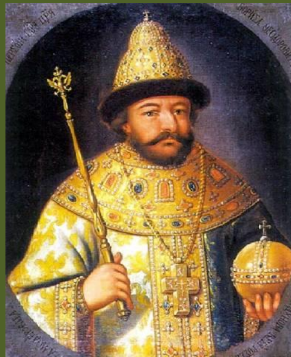
Борис Годунов. Парсуна XVI в.