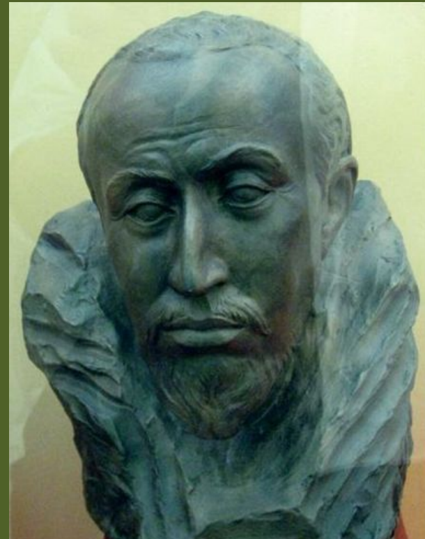
Царь Федор Иоаннович — реконструкция его облика по черепу, выполненная профессором М. М. Герасимовым.

• http://student-hist.ru/fedor-ioannovic/pravlenie-fedora-ivanovica/