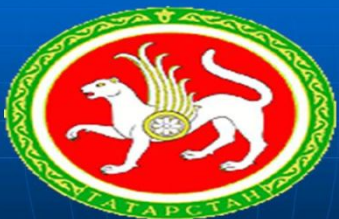
Герб Республики Татарстан.