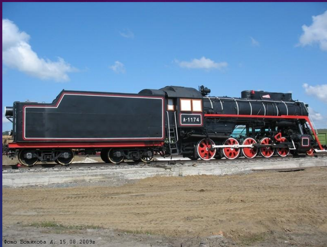
15.08.2009г

Находится по адресу: Алтайский край, Бийск, Привокзальная улица