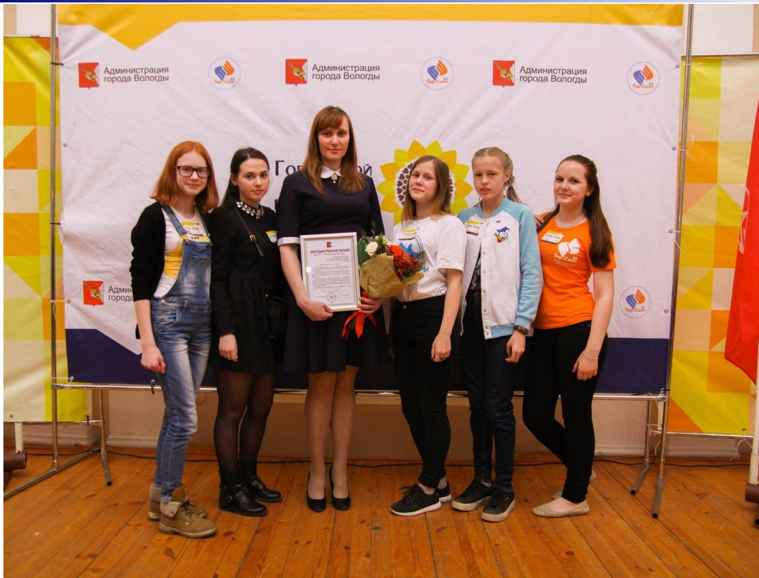
Руководитель и некоторые участники волонтерского отряда "Сердцебиение"